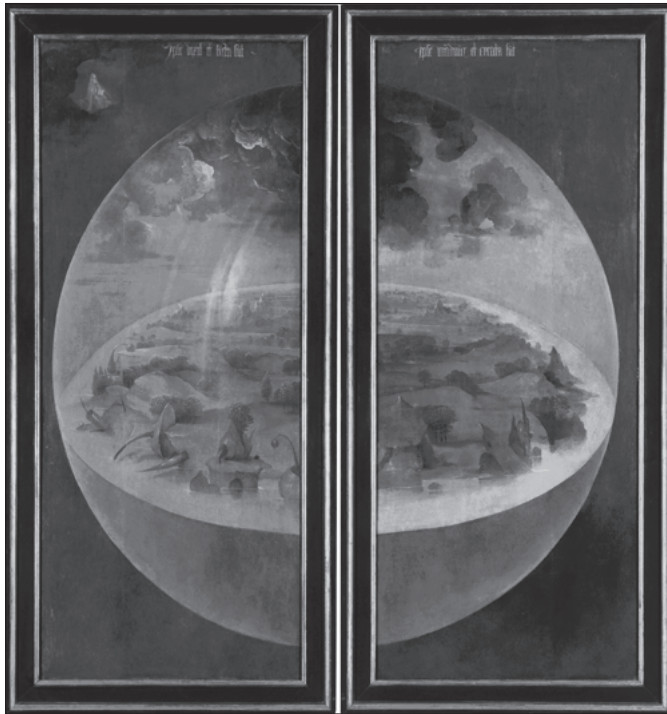
Figura 7. El jardí de les delícies , de Hieronymus Bosch (s. XV). Madrid, Museu del Prado. Tríptic tancat

El que em sembla més interessant i destacable és l'estructura de l'obra en si mateixa; el seu enquadrament simbòlic: quan s'obre el tríptic, realment es