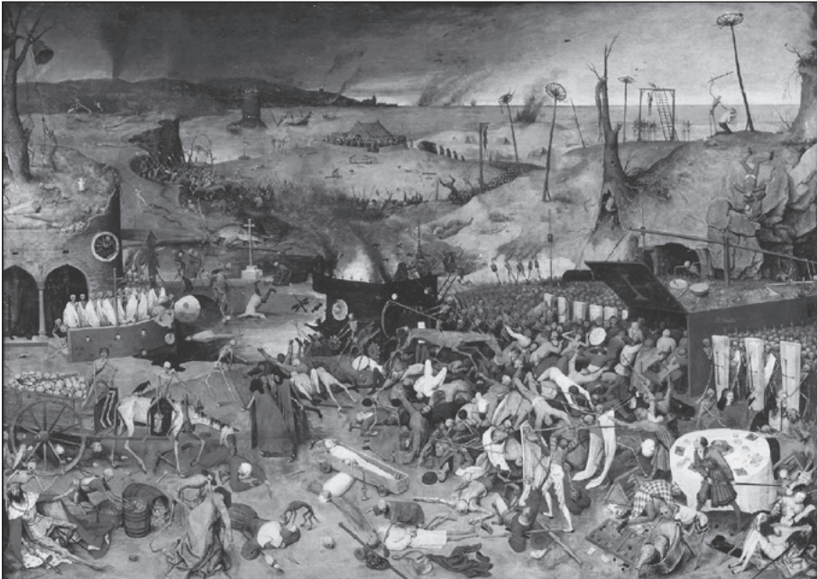
Figura 5. El triomf de la mort , de P. Bruegel (1562). Madrid, Museu del Prado

I es continua parlant de mestres i d'educació per no parlar de la mort triomfant, que és massa propera. La imatge següent il·lustra la mort tal com s'ha posat de manifest avui dins del grup: una mort feixuga, massiva i devastadora que ha aglutinat el grup en un pacte de silenci (Figura 5).