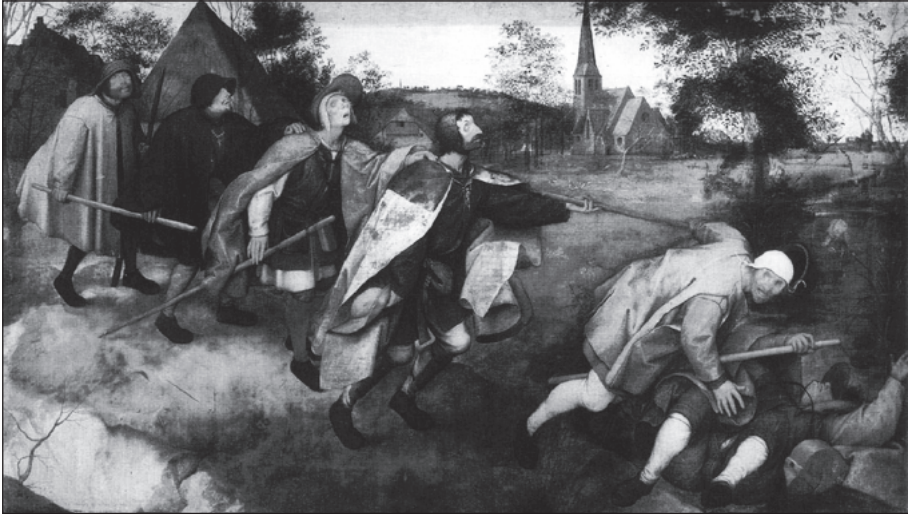
Figura 4. La paràbola dels cecs , de P. Bruegel el Vell (s. XVI). Nàpols, Museu de Capodimonte

inexorable. El nostre destí és comú. El desconexim i ens hi aboquem de manera irreversible, encara vius. Com els cecs de l'obra (Figura 4).