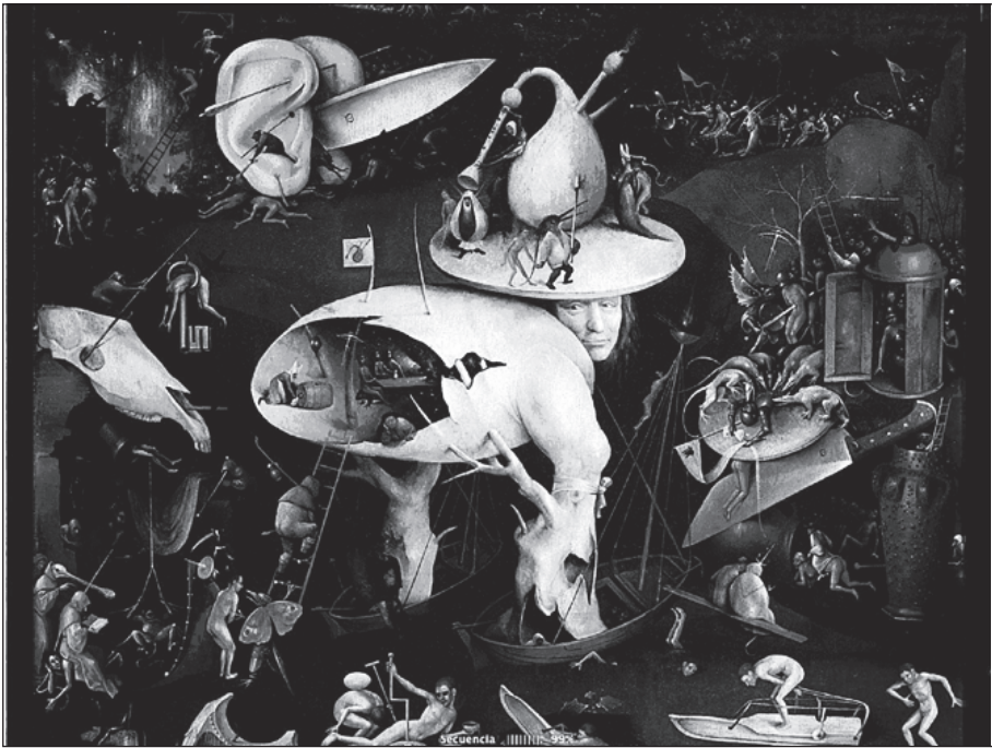
Figura 1. L'infern musical , fragment d' El jardí de les delícies , de Hieronymus Bosch (segle XV). Madrid, Museu del Prado

En la sessió que ara veurem, els motius pels quals les persones no hi assisteixen posen en evidència la fragilitat i la pèrdua de la salut en la vellesa. La pèrdua de la integritat física i també de la mental. Com pot sobreviure un cos -com el de L'infern musical - que s'ha estrocat per la meitat? Com pot sobreviure un grup en què hi manquen gairebé la meitat dels seus membres? Aquest planteig és en si mateix inquietant. Tant per al terapeuta com per als membres que hi assisteixen. Igual d'inquietant com és la contemplació de L'infern musical , on la visió apocalíptica d'allò que ens espera després d'haver gaudit d' El Paradís -que constitueix la part dreta del tríptic- i d' El jardí de les delícies terrenals -la part central- no fa res més que remetre'ns a allò que ens espera després de la mort.