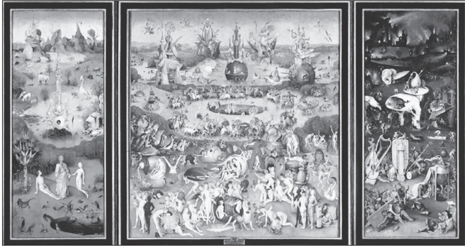
Figura 6. El jardí de les delícies , de Hieronymus Bosch (s. XV). Madrid, Museu del Prado. Tríptic obert

He comentat ja que sovint em vénen imatges d'aquesta obra cada vegada que treballo amb el grup d'avis del Centre. L'infern musical , que correspon a la part dreta de l'obra, el vinculo amb el desmembrament constant que pateix el nostre grup. És una imatge apocalíptica que em fa pensar en la dificultat que comporta l'elaboració de les ansietats de mort d'un grup on la mort es fa present d'una manera tan significativa i desbordant.