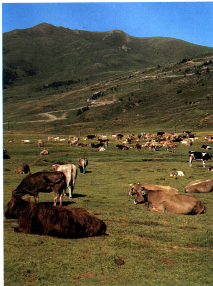
El pla de Beret, capçalera de la Noguera Pallaresa, constitueix encara avui, durant l'estiu, un indret ideal per a la pastura, malgrat les transformacions que l'estació d'esquí hi ha introduït.

El règim dels rius aranesos és complex, nival a les capçaleres i nivo-pluvial tot seguit; d'aquí que les aigües fluvials segueixin l'estacionalitat pluviomètrica. Per altra banda, la retenció nival accentua la secada hivernal. La Garona és el més important dels rius que neixen a l'Aran, en consideració al seu recorregut posterior, però destaquen també les dues Nogueres, Pallaresa i Ribagorçana, que neixen dins dels límits de la comarca. Els llacs són un altre fenomen hidrogràfic important, ja que són molt abundants a les capçaleres glacials dels