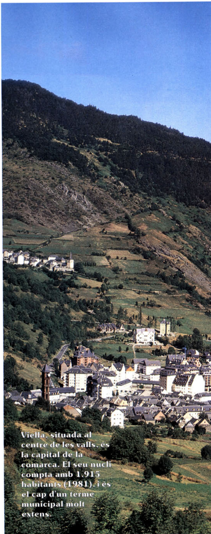
Viella, situada al centre de les valls, és la capital de la comarca. El seu nucli compta amb 1.915 habitants (1981), i és el cap d'un terme municipal molt extens.

L'explicació bàsica d'aquest redreç en la situació demogràfica aranesa rau en el desenvolupament recent del turisme, que ha transformat totes les seves estructures socials i econòmiques. La Vall d'Aran era una comarca desenclavada de Catalunya, amb la qual era difícilment comunicada, sobretot durant l'hivern, cosa que li valgué una sèrie de règims especials durant la major part de la seva història. Aquest fet fou reforçat ja que la comarca era alhora contrada fronterera amb l'estat francès, d'on venien tradicionalment la major part dels perills. Aquest desenclavament permeté també curiosament la perduració de l'economia tradicional