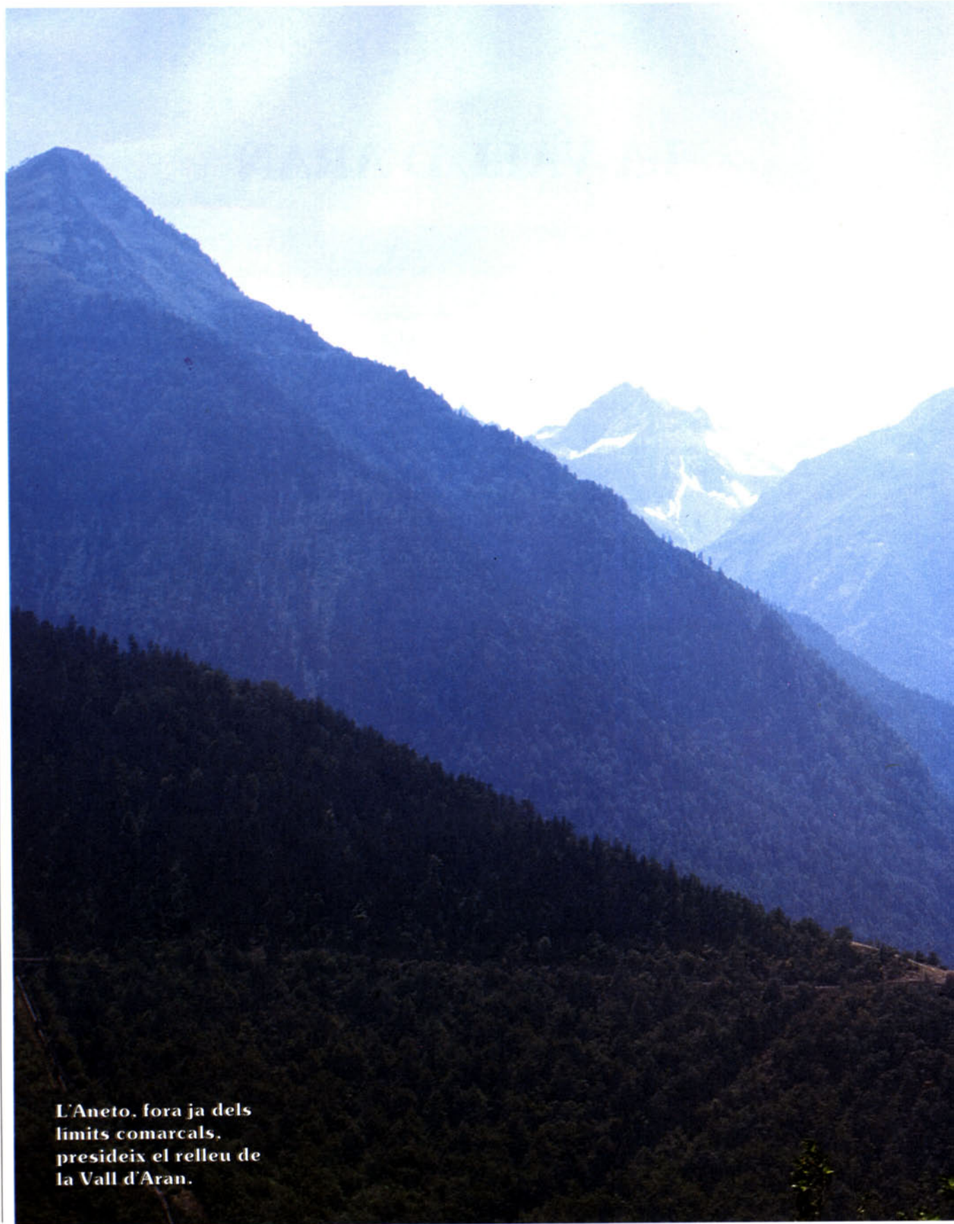
L'Aneto, fora ja dels límits comarcals, presideix el relleu de la Vall d'Aran.