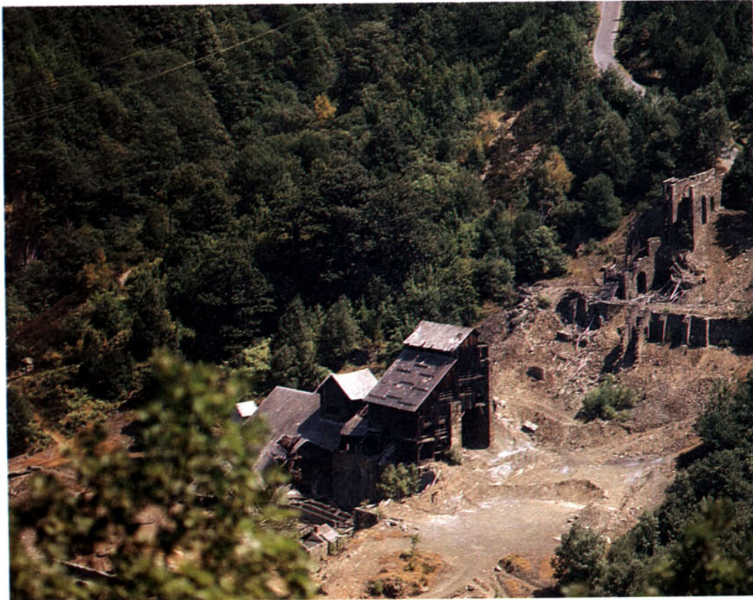
Les activitats tradicionals, com les restes d'aquesta farga prop de Pontaut, han reculat davant l'impuls del turisme.

Els materials sobre els quals han estat excavades les valls són dels més antics del cor dels Pirineus, i les formes glacials hi són predominants arreu (circs, valls penjades, valls en U), sobretot al vessant de la baga, mentre les periglacials, en canvi, senyoregen els vessants septentrionals del solell. Això dona un relleu notablement