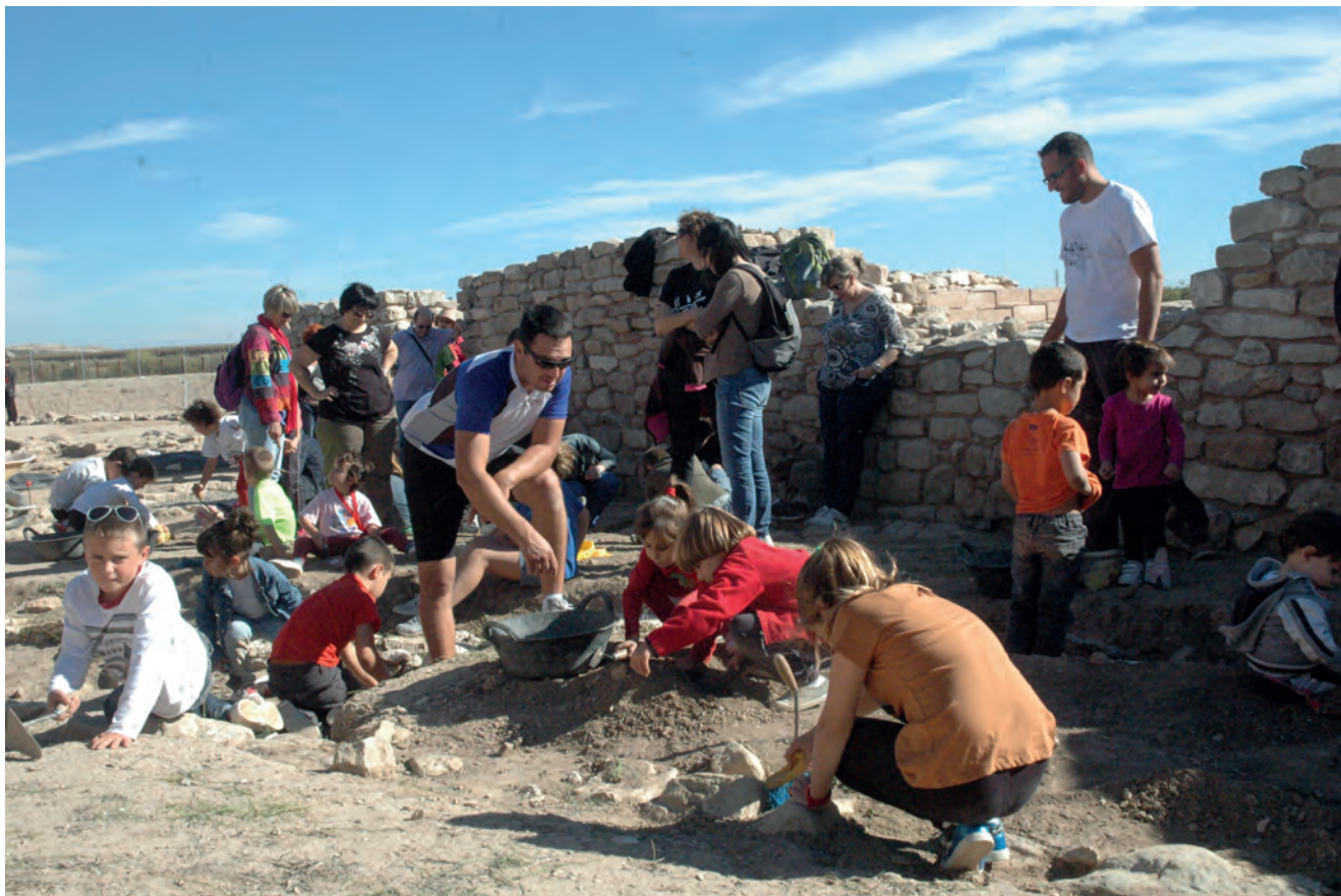
Figura 9. Taller d'excavació amb nens i nenes d'Arbeca, l'any 2013.

específics, en la qual van participar més d'un centenar de nens de les escoles CEIP Albirka (Arbeca), CEIP Joan XXIII (les Borges Blanques) i ZER Riu Corb (Belianes). Després la iniciativa, malauradament, no ha tingut la continuïtat sistemàtica desitjada, però no hi ha dubte que era el camí més idoni per sensibilitzar l'entorn immediat vers el seu patrimoni (figura 9).