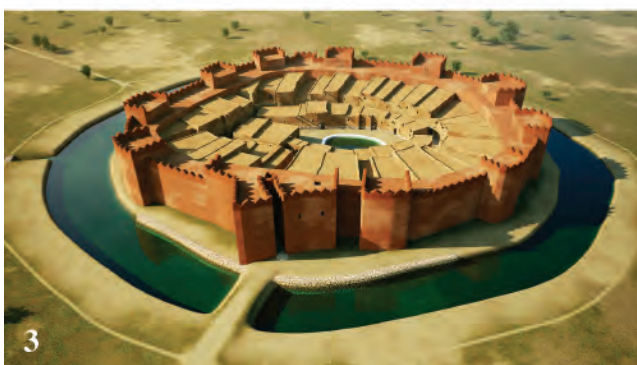
Figura 6. Evolució de les restitucions virtuals del jaciment: 1. (GIP-GRIHO 1998); 2. (GIP-GRIHO 2005); 3. (GIP- J. R. Casals 2016).

d'objectes tridimensionals que permetés representar de manera automàtica les planimetries 2D amb una interface que, a més a més, possibilités la representació a partir de variables com la cronologia o la ubicació espacial. El sistema de registre, orientat a fets arqueològics, estava preparat per al repte, però evidentment es feia necessària una tasca de programació ex novo i una infraestructura informàtica ( software especialment) que el mercat no havia previst.