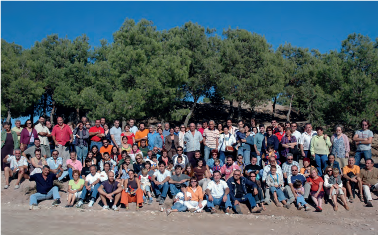
Figura 10. Participants en la festa commemorativa del 20è aniversari de les excavacions als Vilars, l'any 2005.