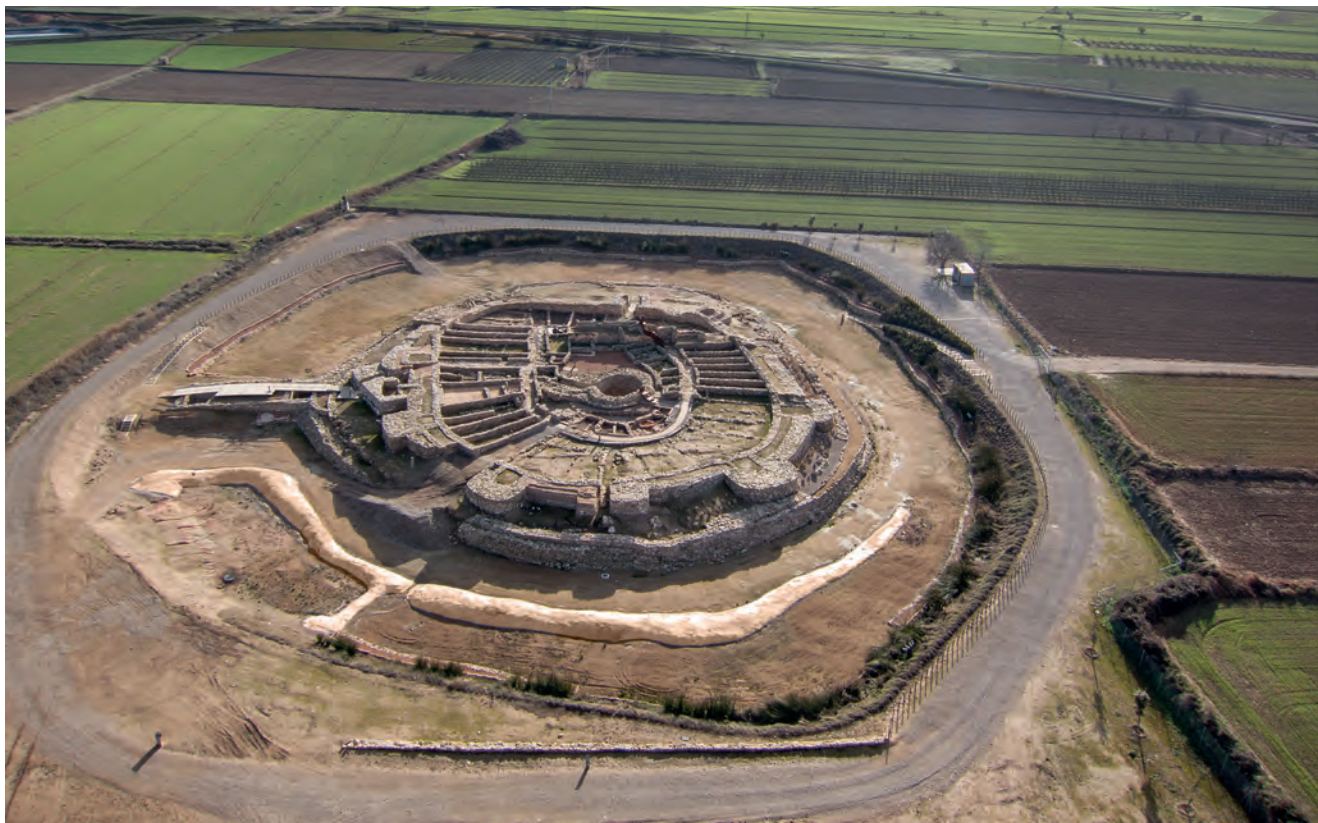
Figura 12. Vista general de la fortalesa dels Vilars, l'any 2014.

de setembre de 2016, en l'acte de la presentació a Arbeca de l'exposició ja esmentada: La Fortalesa dels Vilars d'Arbeca. Terra, aigua i poder en el món ibèric . L'exposició, d'altra banda, ell l'havia dedicat públicament al poble d'Arbeca en la seva presentació al Museu de Lleida l'any anterior; el sentiment mutu de gratitud es manifestava en perfecta simbiosi i no mancaren mostres d'emoció continguda (figura 11).