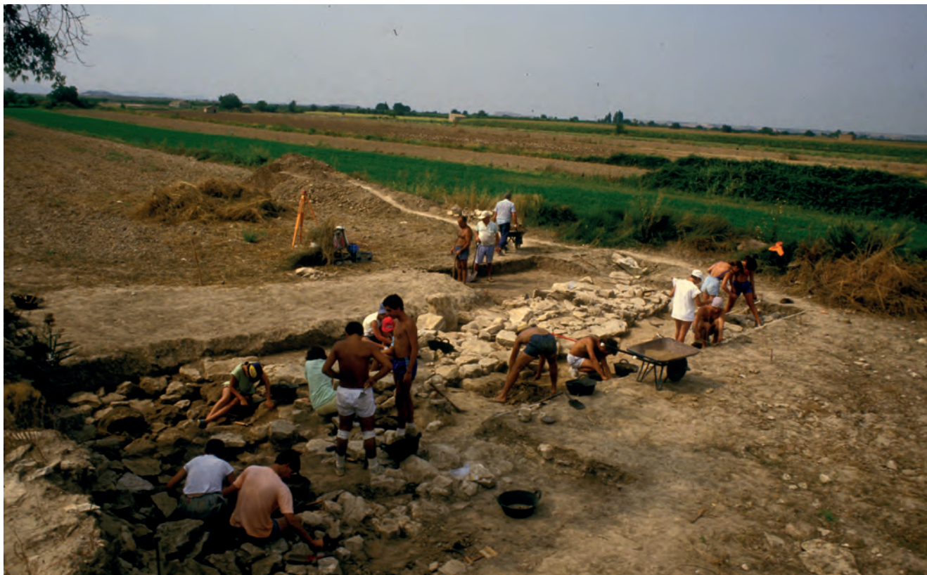
Figura 5. Inici de l'excavació de la muralla dels Vilars d'Arbeca l'any 1987.

durant l'ibèric ple (450/425-200 ANE) (Junyent 2015; Junyent, López 2015, amb la bibliografia). A més a més, la lectura poliorcètica dels elements més significatius de la fortificació (rampa, pou-cisterna, fossat) han suposat una aportació clau a la comprensió de la filiació i la complexitat de la fortificació ibèrica i a qüestions bàsiques sobre la guerra ibèrica (defensa passiva/defensa activa, setge i assalt...) i, més indirectament, a temes concrets com la gestió i els usos de l'aigua, el cavall o els mercenaris. Igualment, la interpretació en el territori ha convertit la fortalesa en paradigma d'un dels camins del trànsit dels cabdillatges vers l'estat arcaic.