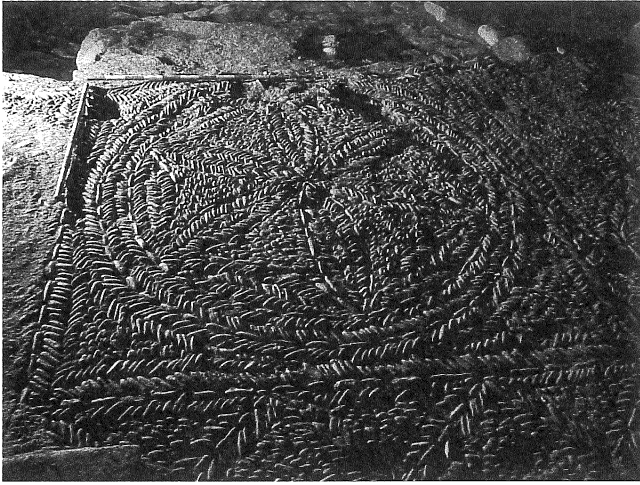
Foto 1. Vista parcial del paviment de còdols del segle xv.