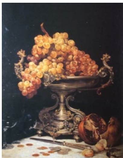
Pere Borrell del Caso Fruiter amb raïm, magrana, ganivet i monedes. 1884 Núm. catàleg 324