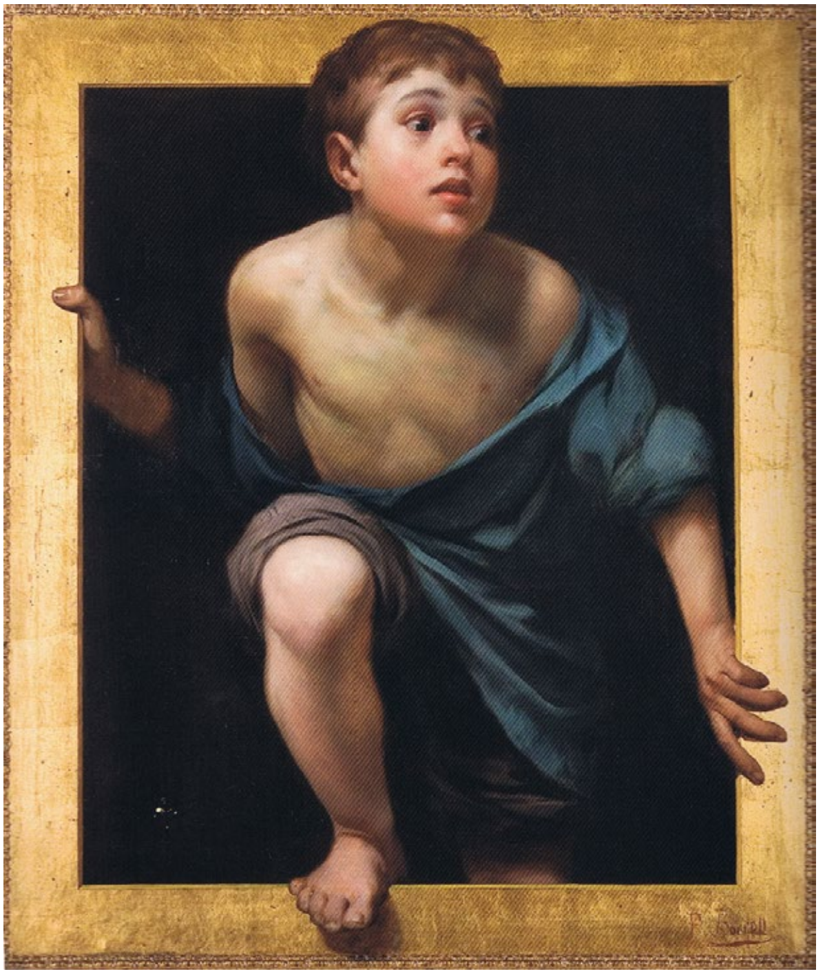
Pere Borrell del Caso Fugint de la crítica IV c. 1885 Núm. catàleg 88