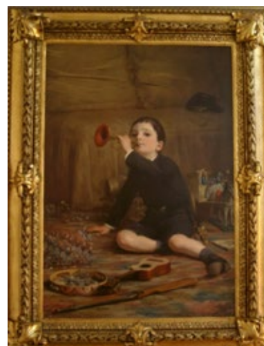
Pere Borrell del Caso Retrat pòstum del fill d'E. Sala 1888 Núm. catàleg 322