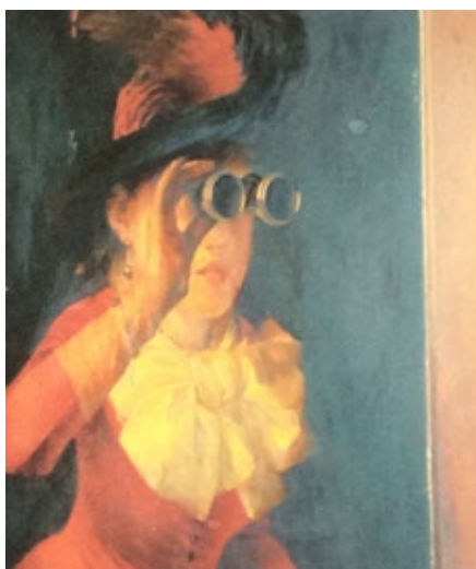
Pere Borrell del Caso Nena amb prismàtics (Detall) Núm. catàleg 326