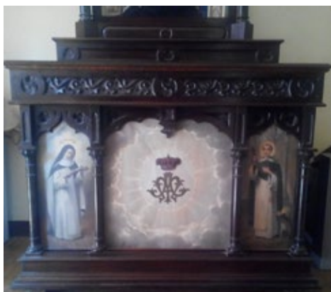
Pere Borrell del Caso Moble-Altar domèstic, amb pintures Núm. catàleg 341