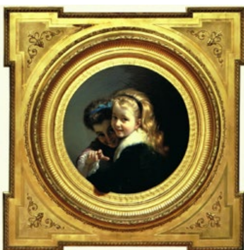
Pere Borrell del Caso Dues noies rient. Núm. catàleg 327