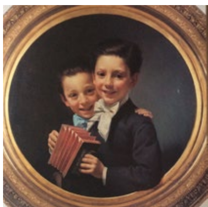
Pere Borrell del Caso Retrat dels fills d' E. Sala, grup. 1883 Núm. catàleg 323