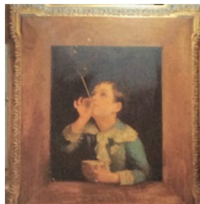
Pere Borrell del Caso Nen fent bombolles de sabó Núm. catàleg 325