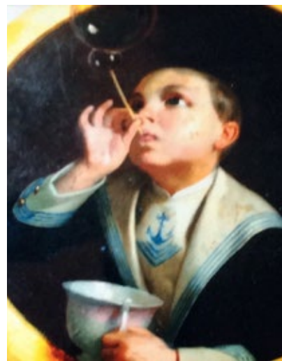
Pere Borrell del Caso Nen vestit de mariner fent bombolles de sabó Núm. catàleg 331