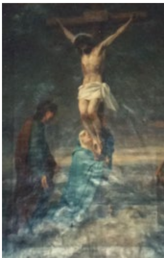
Pere Borrell del Caso Enterrament de Crist Núm. catàleg 332