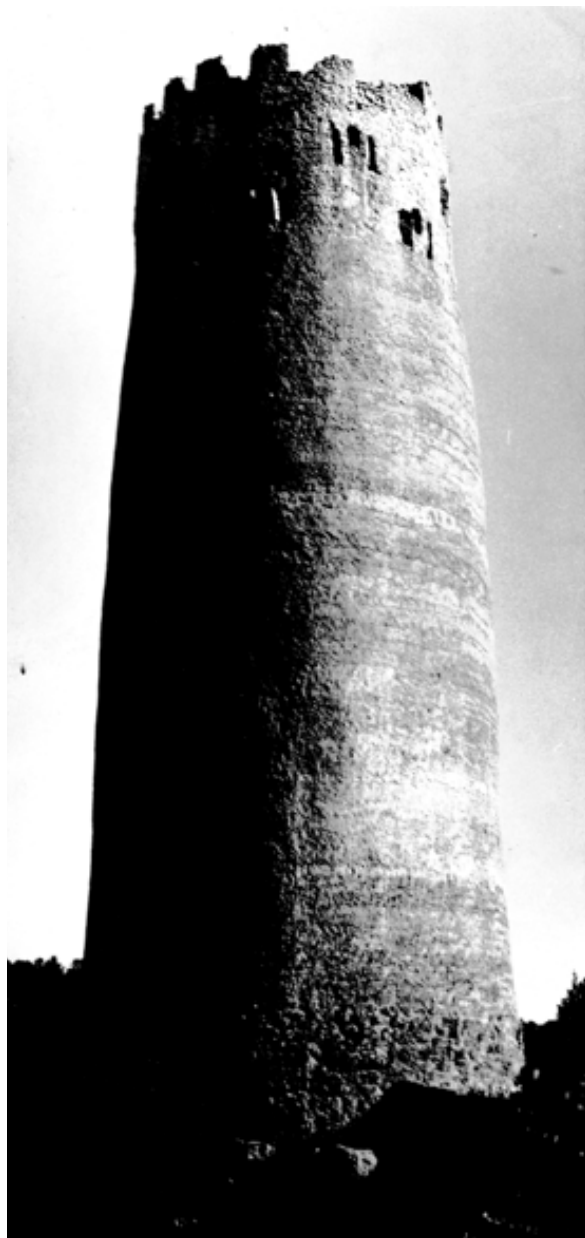
Torre de defensa de Vallferosa (Llanera, Solsonès).

ses o militars. Com deia Lluís el Piadós 22 , de monestirs n'hi ha de tres classes: Aquells que serveixen per resar a favor de l'ànima dels reis i dels seus fundadors; aquells que serveixen per recaptar impostos a favor de la família reial o comtal; aquells que serveixen per "militar", és a dir, com a control i poder militar a favor dels comtes i reis. D'aquest tipus, la majoria de monestirs en temps del rei Lluís el Pietós s'ubicaven en els comtats de Ràsès i Conflent, localitzant-se posteriorment en el Vallès, Empúries, Besalú, i el Bages.