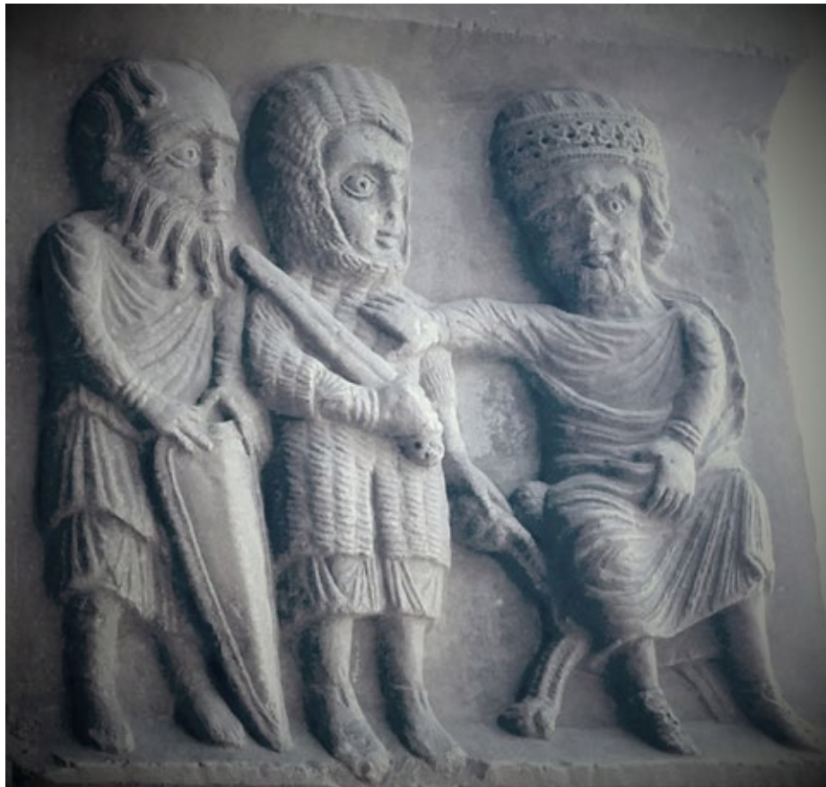
Detall del claustre d'Elna. Representació de la jerarquia dels levites (comte, jutge i sacerdot).