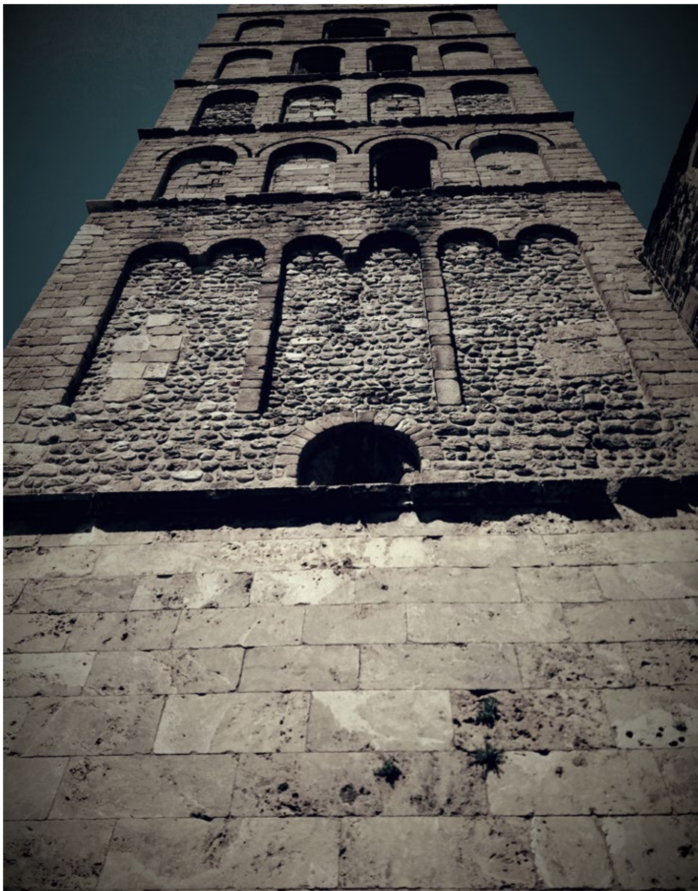
Detall d'una de les torres de l'antiga església expiscopal d'Elna. Recordar que el germà de Guifré el Pilós, Riculf, entre altres parents seus foren bisbes de la metropolitana d'Elna que protegia sota la seva diòcesi els monestirs de levites existents al Conflent, Rasès, Rosselló, Vallespir i Empúries