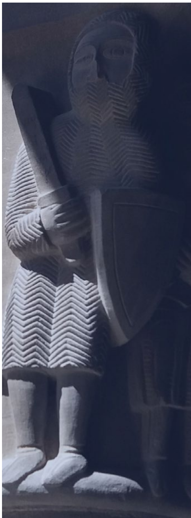
Figuració de levita (ss. IX-X) - Claustre d’Osca. En aquests dos DETALLS DE CLAUSTRE, s’aprecia l’evolució de les ARMES DEL LEVITA segons documentació citada a finals de l’article.