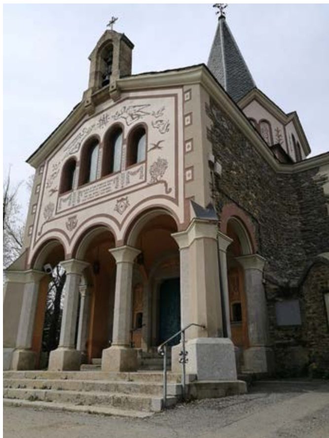
Santuari de la Mare de Déu del Remei.

per treure's l'espina, va encarregar a Calixte Freixa la construcció d'un altre castell al seu destí d'estiueig, al municipi d'Alp. Aquesta juguesca perduda fou l'origen de l'actual Torre del Riu, construïda a partir de 1896 segons el seu particular estil neogòtic que incorporà al paisatge cerdà un castell grandios, emmerletat i farcit de torrasses de coberta cònica, com mai no s'havia vist en tota la terra de Cerdanya.