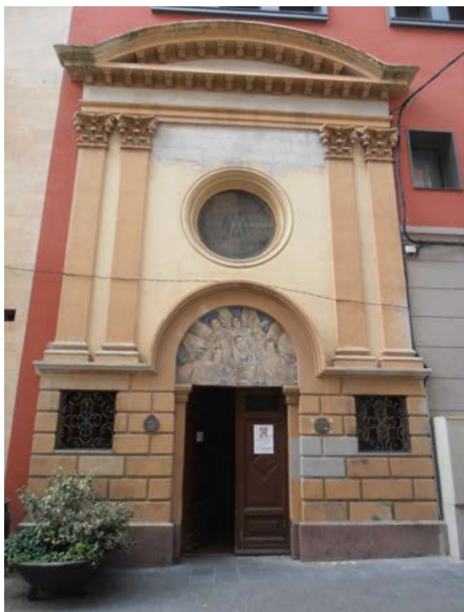
Façana de l'església de la Missió, a la Seu d'Urgell. Autor: Carles Gascón Chopo