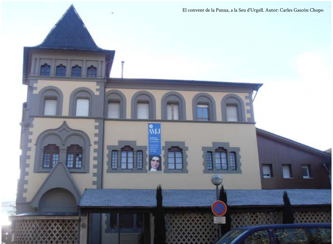
El convent de la Punxa, a la Seu d'Urgell.