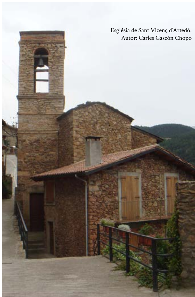
Església de Sant Vicenç d'Artedó. Autor: Carles Gascón Chopó

d'estudi d'aquest personatge singular, que reivindicuem des d'aquestes línies. Calixte Freixa va morir el 24 de febrer de 1920, segons ens informa una esquila publicada al diari La Vanguardia . No va tenir fills i va deixar una part substancial de la seva herència per a finançar una escola catòlica a Llivia. Des del punt de vista arquitectònic, Calixte Freixa és el màxim exponent de l'eclecticisme arquitectònic propi del canvi de segle a l'àrea de l'alta conca del Segre, propi d'un moment històric molt determinat en què els barcelonins "redescobrien" el Pirineu, bé a través dels burgesos que pujaven a estiuejar a la Cerdanya, bé a través de la figura d'un nou bisbe urgellenc com fou el cardenal Casañas que, per cert, també era d'origen barceloní.