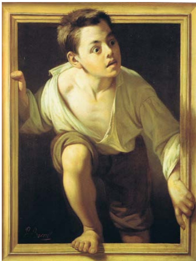
Fugint de la crítica. 1874 Oli/tela. Col·lecció Banco de España