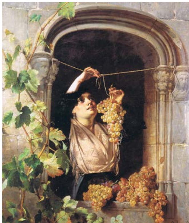
La Pagesa del raïm. 1878 Oli/tela. Col·lecció particular