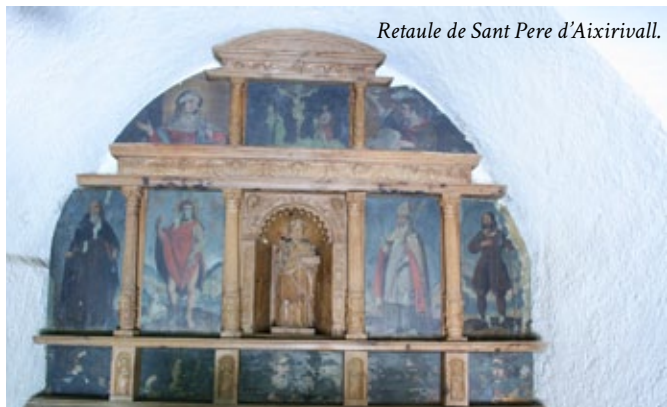
Retaule de Sant Pere d'Aixirivall.

tem el impactant petit espai de Sant Cristòfol d'Anyós. Per a nosaltres, passats els llargs temps de l'injustificat menysteniment de l'art de les etapes del Renaixement i del Barroc, aquesta evidència, clamorosa i indiscutible, hauria de tenir conseqüències en la valoració de l'art dels segles XVI al XVIII i hauria de ser aprofitada en la política de gestió patrimonial andorrana.