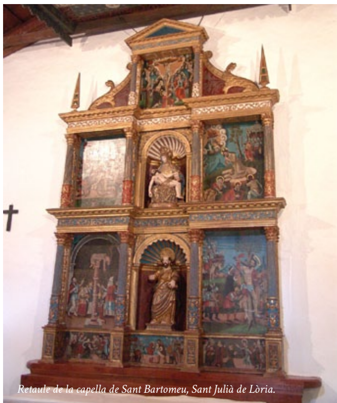
Retaule de la capella de Sant Bartomeu, Sant Julià de Lòria.

Cadascuna d'aquestes tasques és profitosa i enriquidora. Així, per exemple, l'imprescindible i obligat treball de catalogació desplegat església per església a totes les parròquies de les valls, posa en evidència una dada importantíssima: la riquesa del patrimoni dels segles XVI, XVII i XVIII conservat als edificis religiosos, casals i museus d'Andorra. És una observació que ja permet avançar una de les conclusions de l'estudi: la importància capital que la producció artística de l'època moderna va tenir en la caracterització de la imatge històrica d'Andorra. Tanta com la que s'ha assignat a l'activitat artística de la suggerent i decisiva etapa medieval. Com va passar a les altres diòcesis catalanes, els segles de l'època moderna van ser artísticament molt dinàmics, una característica que s'ha esborrat de les esglésies catalanes per culpa de les destruccions ocasionades durant la Guerra Civil espanyola. Aquesta última, afortunadament, va estalviar el territori andorrà que avui ofereix uns temples transformats en evocadors palimsestos d'imatgeria acumulada des dels segles medievals –ressal-