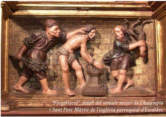
"Flagel·lació", detall del retaule major de l'Assumpta i Sant Pere Màrtir de l'església parroquial d'Escaldes.

tilística i del llenguatge plàstic dels pintors i escultors depengué en gran mesura de l'impuls de les idees figuratives i compositives proposades pels gravats internacionals d'autors com ara Albrecht Dürer, Marcantonio Raimondi, Crispin de Passe, Johann I Sadeler, Gilles Sadeler o Lucas Vorsterman, usades abundantment els obradors més artesanitzats, els quals procuraven copiar-les per aconseguir referents gràfics atractius. Aquestes seran les responsables de guiar els canvis estilístics des dels dialectes tardogòtics fins a l'adopció de superfícies maneres "barroques".