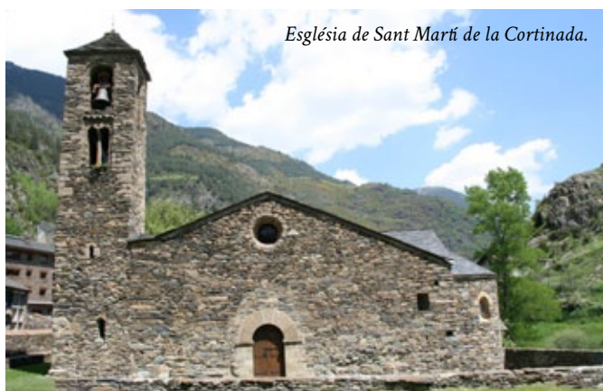
Església de Sant Martí de la Cortinada.

El segon mirarà de caracteritzar el llenguatge pictòric i escultòric emprat pels tallers actius a Andorra i la menor o major competència "estilística" dels autors analitzats. És segur que observarem que fins i tot a les valls andorranes, com arreu d'Europa, l'evolució es-