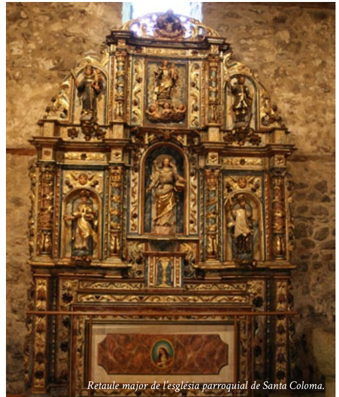
Retaule major de l'església parroquial de Santa Coloma.

Finalment, el catàleg procurarà deixar constància dels grans temes que van interessar i van involucrar la població andorrana fins a extrems que avui en dia costa d'imaginar: els temes devots lligats a una confiança cega en la salvació i a una por igualment cega en la condemna. Per a reconeixer-les cal llegir els retaules com a escenaris on s'explicaven els anhels i les conviccions religioses d'aquelles comunitats muntanyenques, tant els vinculats