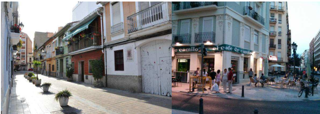
Figura 1. Barri de Russafa, a l'esquerra, barri de Benimaclet a la dreta.

En relació amb la composició social dels barris, durant la dècada dels noranta, mentre que a Russafa destaca l'arribada d'immigrants extracomunitaris conformant les