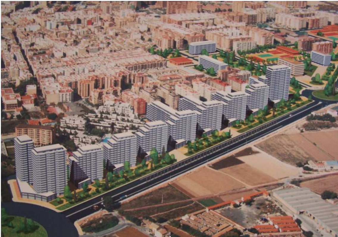
Figura 3. Projectió del PAI Benimaclet-est.

És, aleshores, quan el moviment veïnal de Benimaclet inicia accions destinades a desbloquejar la cessió per a equipaments dotacionals al barri i es presenten al·legacions per tal de limitar la construcció d'habitatges, l'altura dels edificis i la cessió dels terrenys. Davant la paràlisi del PAI i la falta de resposta de l'Administració Pública, l'Associació de Veïns i Veïnes i tots els col·lectius que s'havien organitzat al caliu de la dècada del 2000, decideixen passar de la reclamació a l'acció. En Febrer de 2010, el veïnat va començar a ocupar els terrenys abandonats del PAI, plens d'enderrocs i brossa, per tal de condicionar-los i dedicar-los a usos veïnals d'acord amb les seues peticions i necessitats. En primer lloc es condicionà una superfície de 5.000 m 2 per al seu ús com a aparcament gratuït amb capacitat per a 60 vehicles. L'aparcament porta en funcionament sis anys i el manteniment veïns, i recentment amb l'ajuda dels serveis municipals.