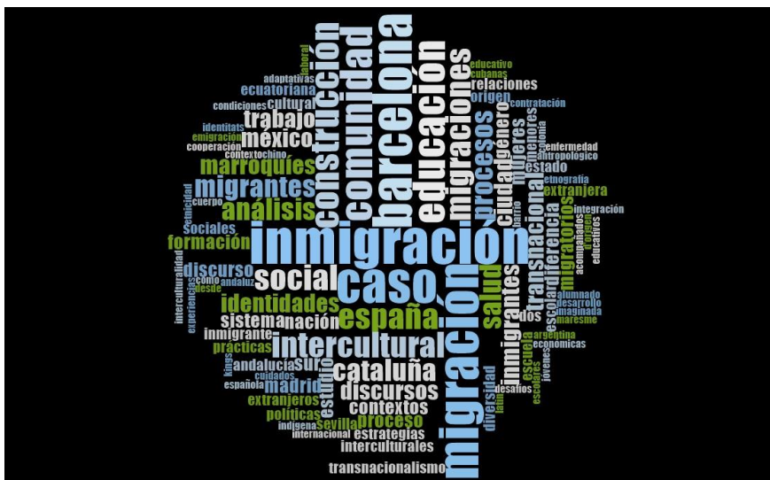
Cuadro 1. Representación de la presencia de palabras en los títulos de las tesis doctorales analizadas