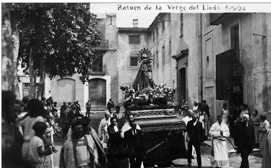
Imatge de la processó de la Mare de Déu del Lledó que se celebrà, el 1924, per demanar pluja just en el moment que passava per davant del convent de les Monges Mínimes del Pati.