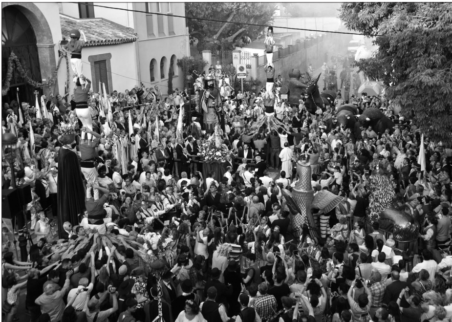
Ballada final de la processó del diumenge 26 de juny.