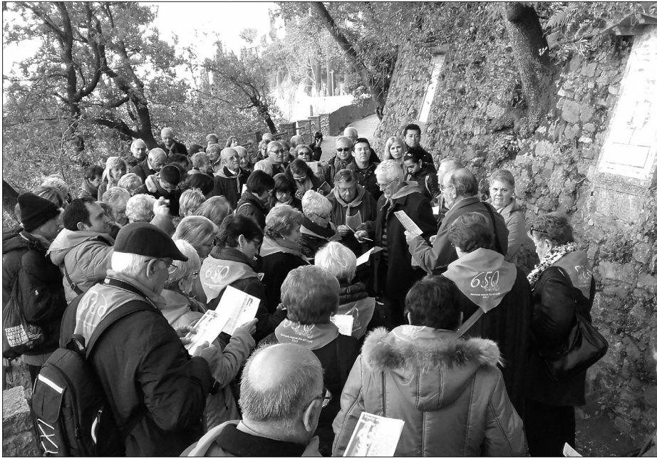
Peregrinació a Montserrat el dissabte 23 de gener.