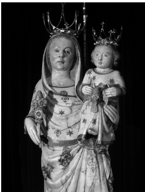
Detall de la imatge. Observem la flor que sosté i l'ocellet del nen.

per aquest mantell, que es recull a la seva esquerra, i li baixa fins als peus en plegat suau amb uns treballadíssims plecs a l'alçada dels seus genolls.