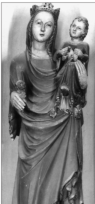
Imatge de la Mare de Déu de Castellans de les Garrigues.

presenten els nens són ben similars. Pel que fa a la plàstica escultòrica de les efigies, els mantells que cobreixen les túniques de Maria constitueixen segurament allò que més defineix aquestes peces: els plecs caients en forma de cascada presenten un delicat treball característic de l'artista, una tipologia que acabà esdevenint un model propi del seu repertori i dels seguidors que n'emergiren.