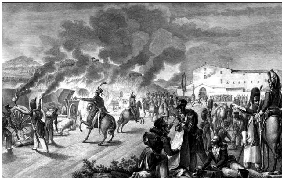
Imatge del convent caputxí de Calella durant la Guerra del Francès. L'any 1808 les tropes franceses van entrar a aquesta població, i el convent caputxí fou saquejat i incendiat. La seva semblança arquitectònica amb el de Valls fa que l'escena ens serveixi per il·lustrar la situació viscuda en el moment. Aiguafort de Bonaventura Planella (1822).

S'explica que, mentre contemplava l'espectacle, el general va demanar un edifici gran per poder-s'hi estar ell i la seva plana major; i els veïns van contestar ràpidament que el millor lloc era el convent dels Caputxins, molt proper a aquell lloc, que ja no tenia frares perquè ja havien fugit. Així, Gouvion i la seva tropa es dirigiren al convent. En arribar al santuari i trobar les seves portes obertes, el general francès va poder veure la imatge mariana sobre el seu pedestal mirant en direcció a la població, un moment en què, explica la tradició, en Gouvion es girà vers els seus ajudants per revocar l'ordre inicial de cremar la població. Aquest sobtat canvi de plans fou interpretat pels veïns com una intercessió de Maria del Lledó, tal com podem llegir en els seus goigs: "Quan aquí el francès entrava, / en Saint Cir, el general, / cremar el poble es proposava, / sens deixar un sol casal; / però prompte Vós, Senyora, / li mudàveu la intenció." 69