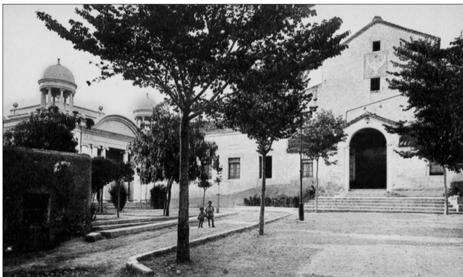
El santuari del Lledó ha presidit aquests terrenys de la població des del segle XIV. Aquesta bucòlica imatge ens mostra l'aspecte del capdamunt del passeig dels Caputxins als anys 30 del segle XX. Pere Català i Pic. (Fons AMV)

por haber mucho peligro de que se estropeará. Han regresado todos por la noche llenos de satisfacción y entusiasmo. Día 8. Han venido hoy los operarios para reparar el pequeño desperfecto de la Virgen. 38