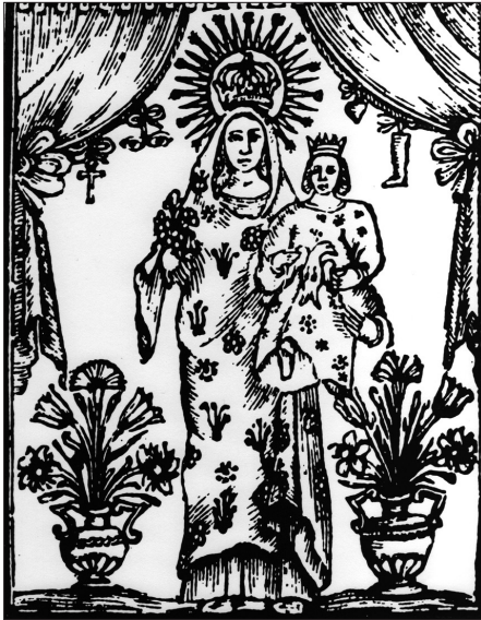
Imatge idealitzada de la Mare de Déu del Lledó impresa en un goig de finals del segle XVII.