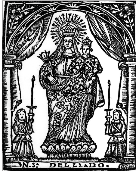
La Mare de Déu del Lledó en un goig imprès en el segle XVIII.