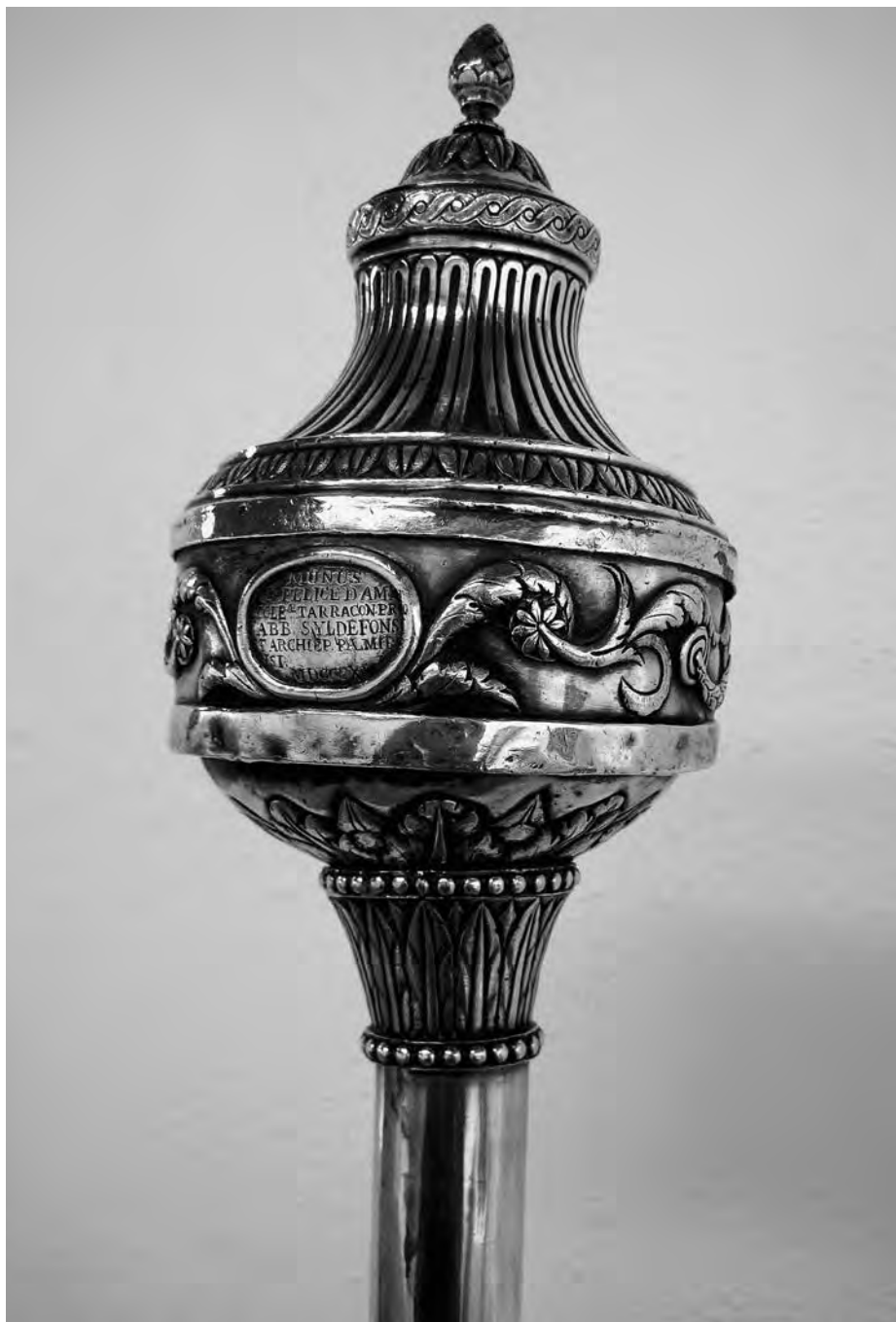
Masses (detall). Anònim, 1815. Plata. Col·lecció parròquia Sant Joan Baptista. Valls.