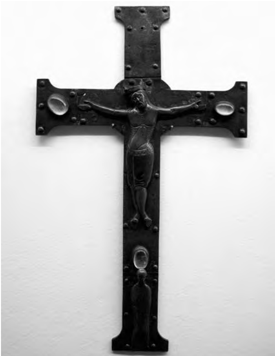
Creu de Llemotges. Anònim, finals s. XII i principis s. XIII. Bronze amb esmalts i cabuixons de cristall de roca. Col·lecció Fundació Privada per l'Arqueologia Ibèrica. Figuerola del Camp.