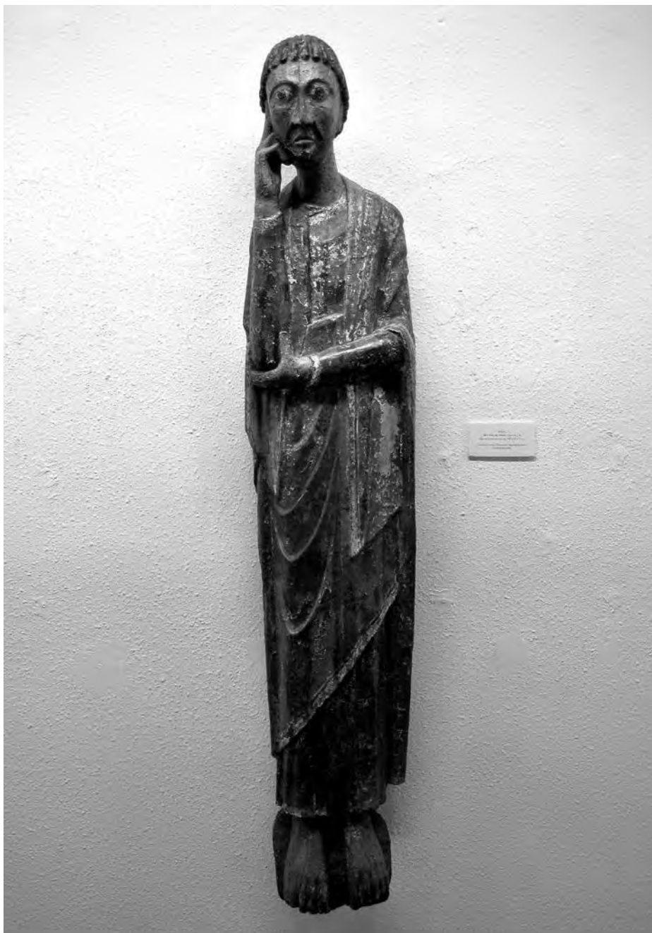
Sant Joan al Calvari. Anònim, principis s. XIV. Talla de fusta policromada. Col·lecció Fundació Privada per l'Arqueologia Ibèrica. Figuerola del Camp.