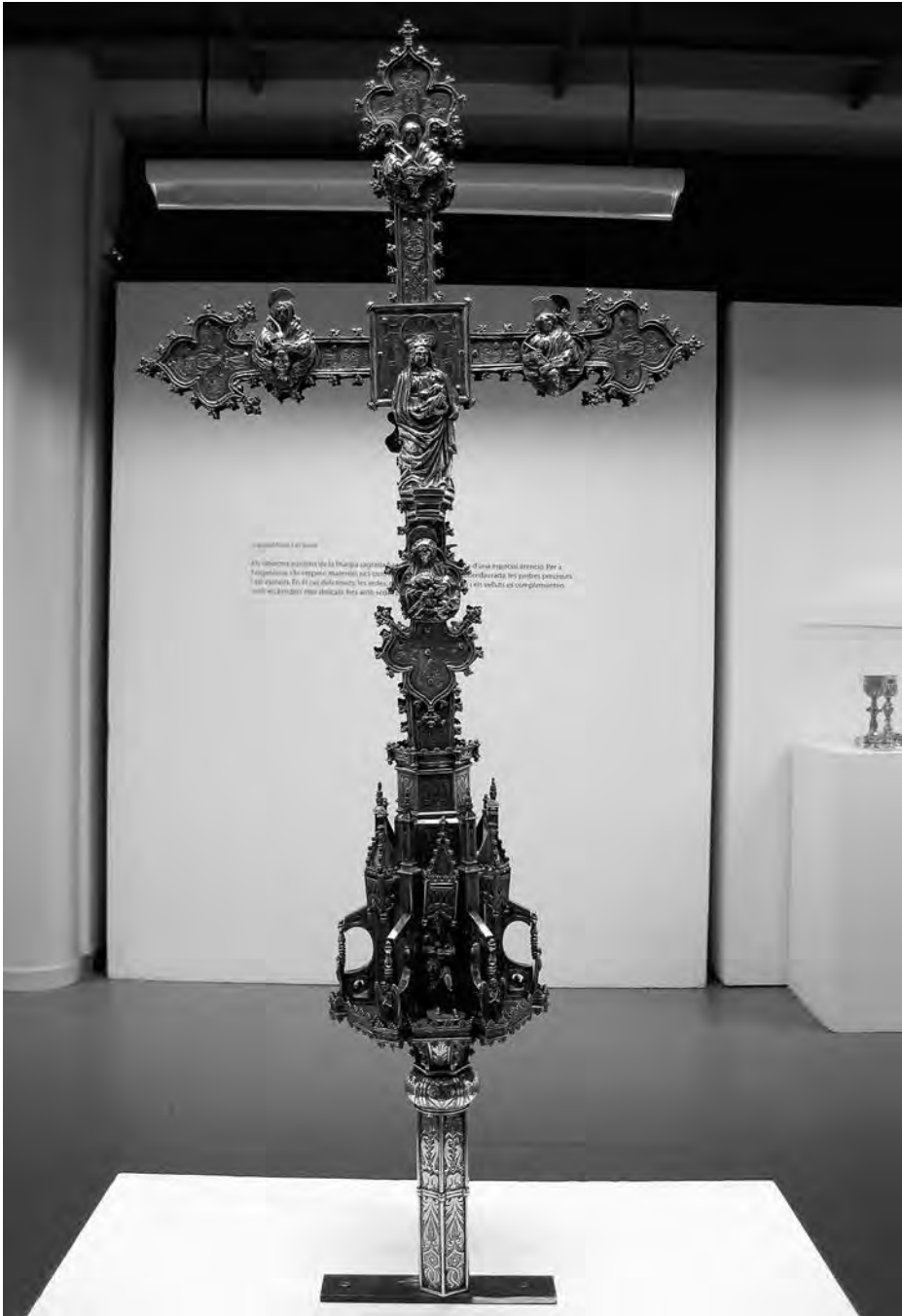
Creu processional. Anònim, principis s. XVI. Plata. Col·lecció parròquia Sant Joan Baptista. Valls.