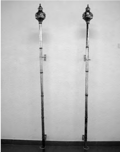
Masses. Anònim, 1815. Plata. Col·lecció parròquia Sant Joan Baptista.Valls.