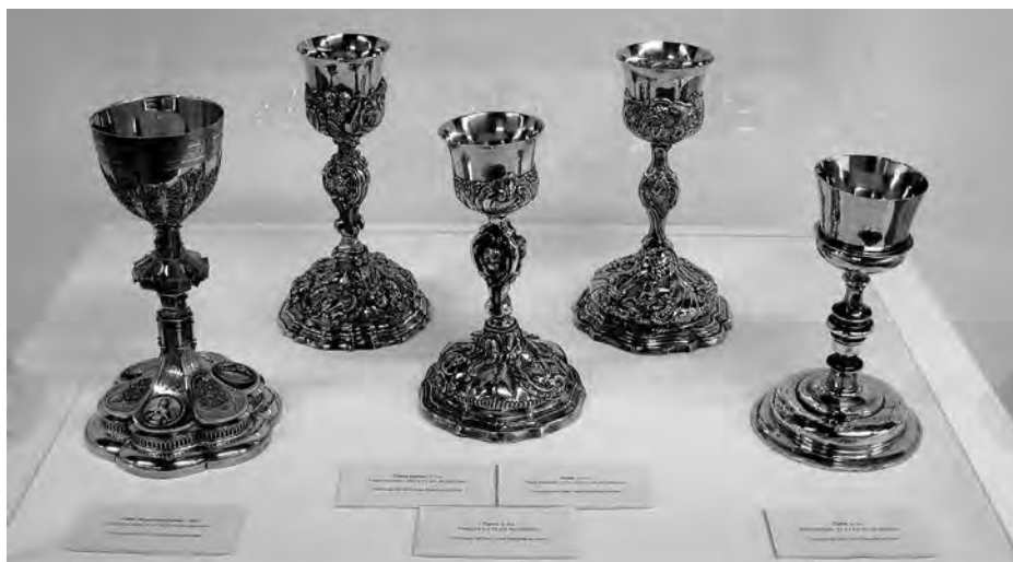
Calzes: Anònim, s. XVII. Anònim, s. XVIII. Anònim, s. XVIII. Calze barroc. Anònim, s. XVIII. Calze de primera missa. Anònim, 1890. Plata daurada. Col·lecció parròquia Sant Joan Baptista. Valls.