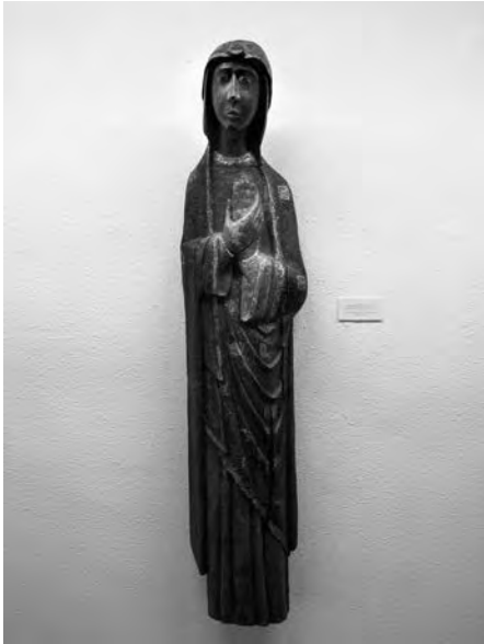
Mare de Déu al Calvari. Anònim, finals s. XII. Talla de fusta policromada. Col·lecció Fundació Privada per l'Arqueologia Ibèrica. Figuerola del Camp.