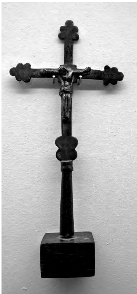
Crist en creu. Anònim, s. XIV. Coure sobredaurat. Col·lecció Fundació Privada per l'Arqueologia Ibèrica. Figuerola del Camp.