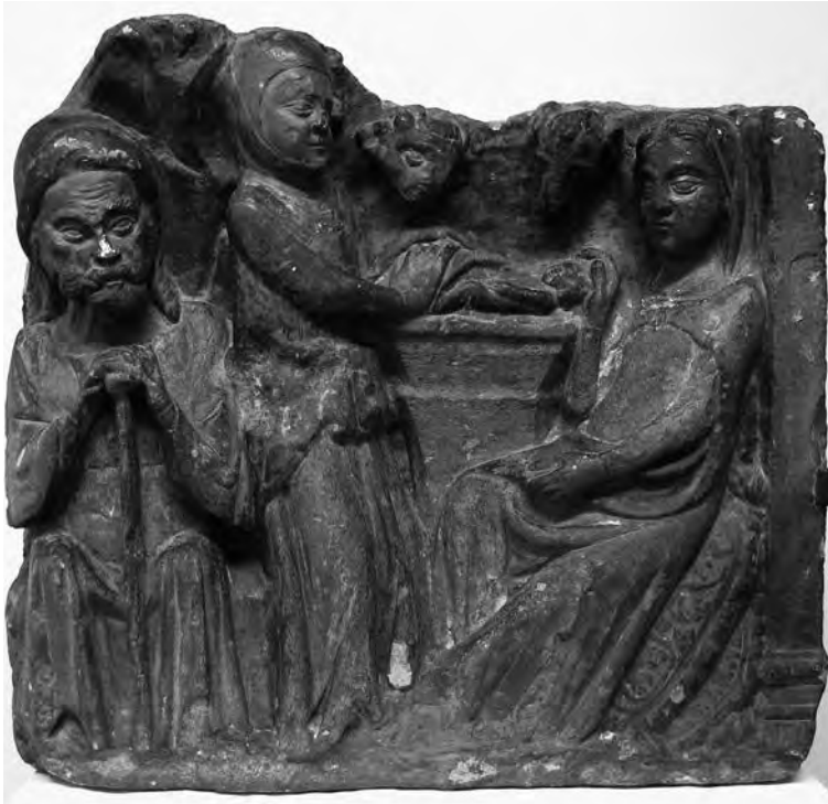
Naixement. Anònim (possible Escola Mestre d'Àger), s. XIV. Talla en pedra. Col·lecció particular. Valls.