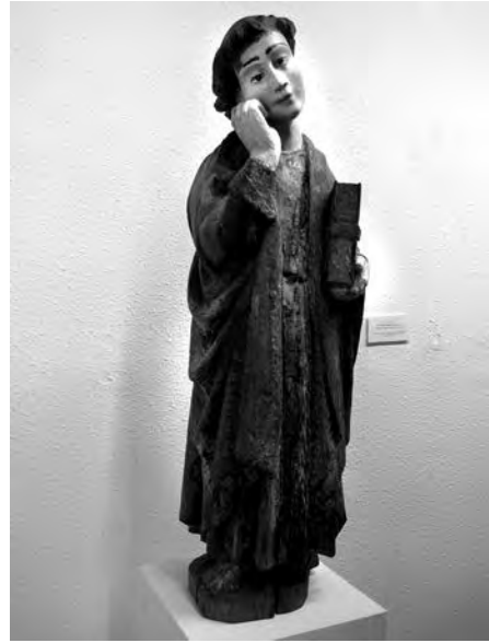
Sant Joan al Calvari. Anònim, principis s. XIV. Talla de fusta policromada. Col·lecció Fundació Privada per l'Arqueologia Ibèrica. Figuerola del Camp.