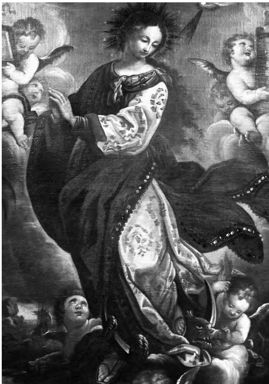
Immaculada amb els atributs de les lletanies. Anònim, finals del segle XVII i principis del segle XVIII. Oli sobre tela. Parròquia de Sant Joan Baptista de Valls.