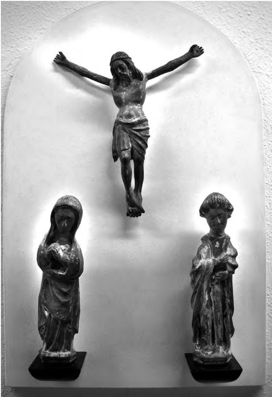
Calvari. Anònim, principis s. XVI. Talla de fusta amb restes de policromia. Col·lecció particular. Valls.