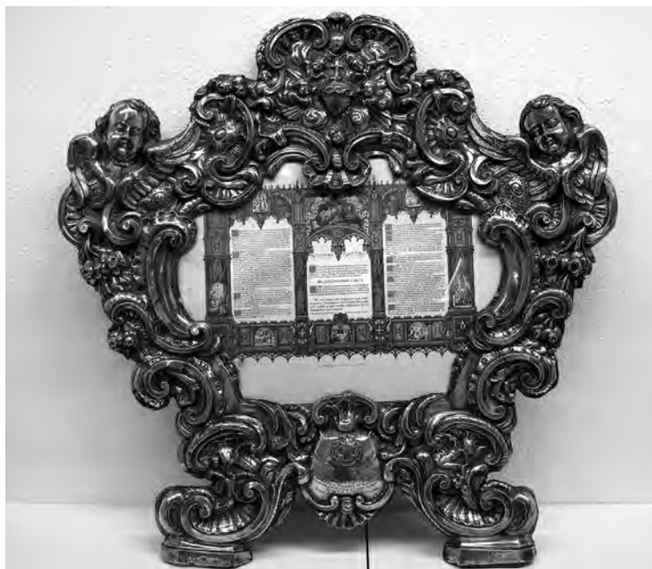
Sacra. Anònim, 1764. Plata i fusta. Collecció parròquia Sant Joan Baptista. Valls.