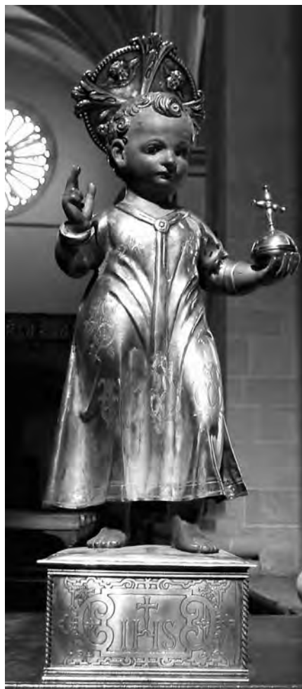
Nen Jesús. Anònim, s. XVII. Plata i policromia. Col·lecció parròquia Sant Joan Baptista. Valls.