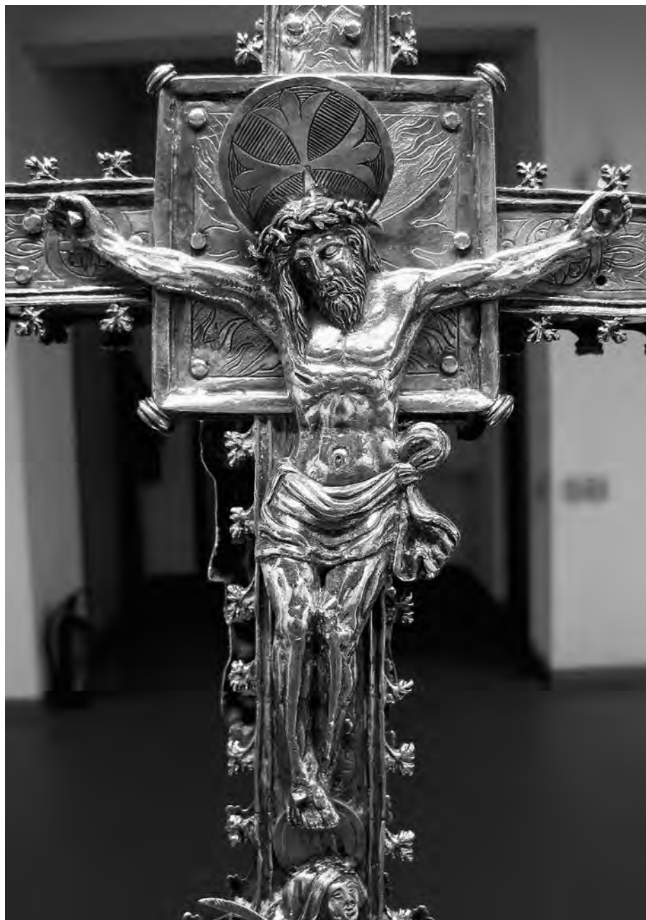
Creu processional (detall, Crist crucificat). Anònim, principis s. XVI. Plata. Col·lecció parròquia Sant Joan Baptista. Valls.