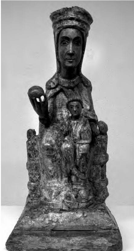
Mare de Déu amb Nen. Anònim, s. XII. Talla de fusta policromada. Col·lecció particular. Valls.

Aquest gest maternal també és present en l'obra actual de l'artista Matteo Ferroni, una peça que com totes les altres representacions marianes ens convida a la contemplació.