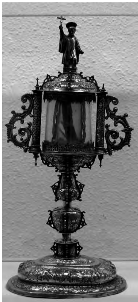
Reliquiari de Sant Francesc Xavier. Anònim, finals s. XVII. Plata i vidre. Col·lecció parròquia Sant Joan Baptista. Valls.