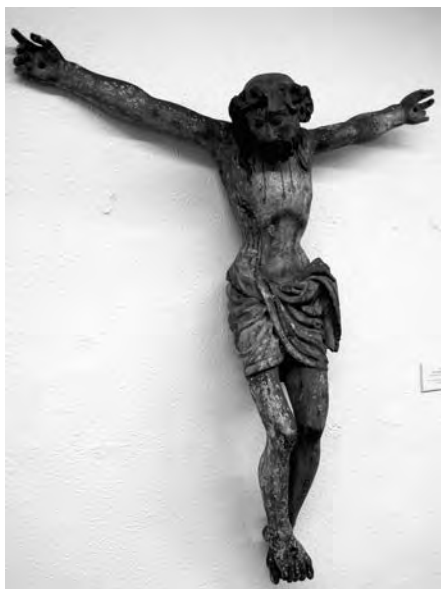
Crist crucificat. Anònim, principis s. XVI. Talla de fusta policromada. Col·lecció Fundació Privada per l'Arqueologia Ibèrica. Figuerola del Camp.