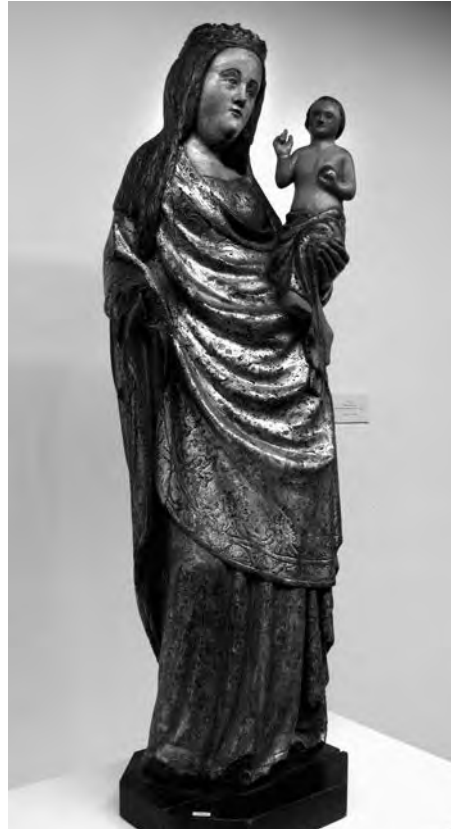
Mare de Déu amb Nen. Anònim, s. XV. Talla de fusta policromada. Col·lecció particular. Valls.