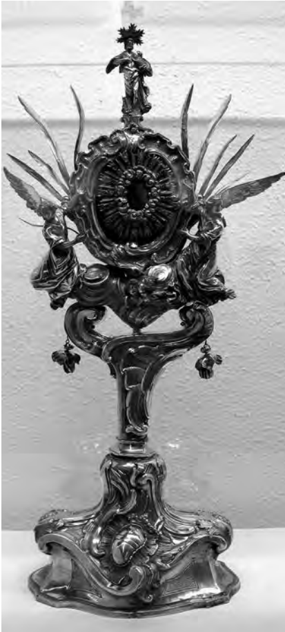
Reliquiari de Sant Joan. Anònim, 1766. Plata i vidre. Col·lecció parròquia Sant Joan Baptista. Valls.