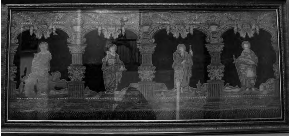
Frontal d'altar amb la Mare de Déu, sant Pere, sant Jaume i sant Pau. Anònim, primera meitat s. XVI. Brodat amb fil d'or sobre un fons de vellut. Col·lecció particular.Valls.