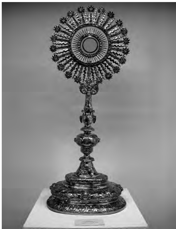
Custòdia. Anònim, s. XVII. Plata i vidre. Col·lecció parròquia Sant Joan Baptista. Valls.