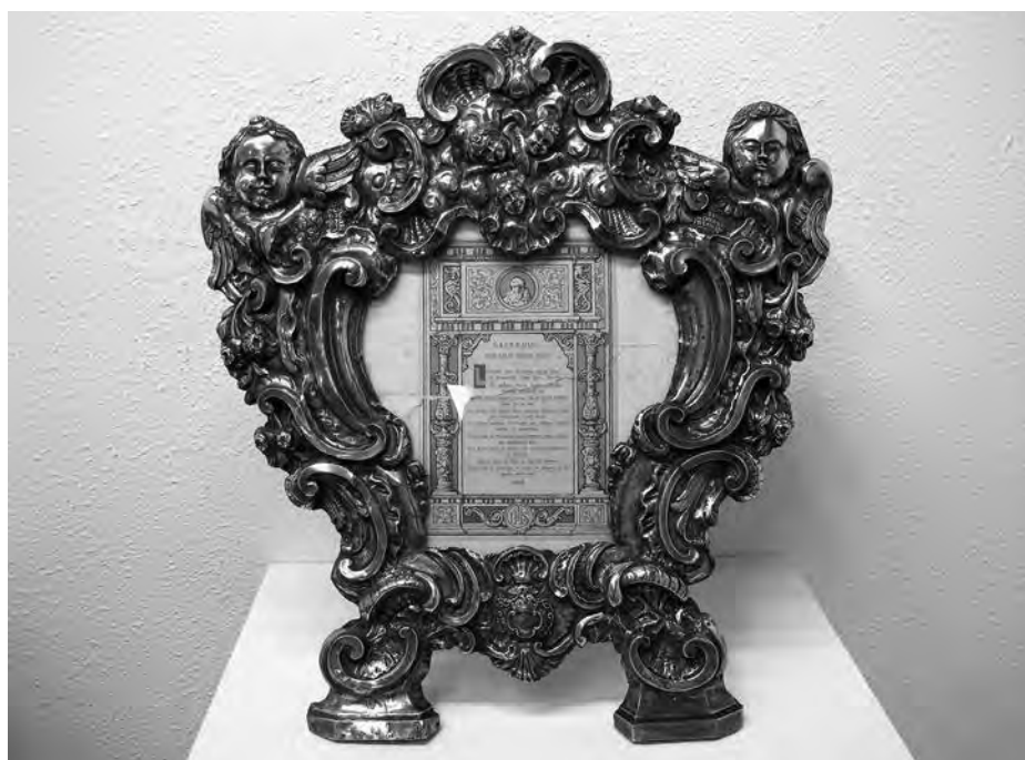
Sacra. Anònim (1764). Plata i fusta. Collecció parròquia Sant Joan Baptista. Valls.