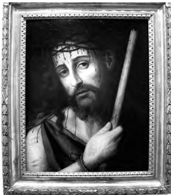
Ecce Homo. Anònim, s. XVI. Pintura sobre taula. Col·lecció particular. Valls.