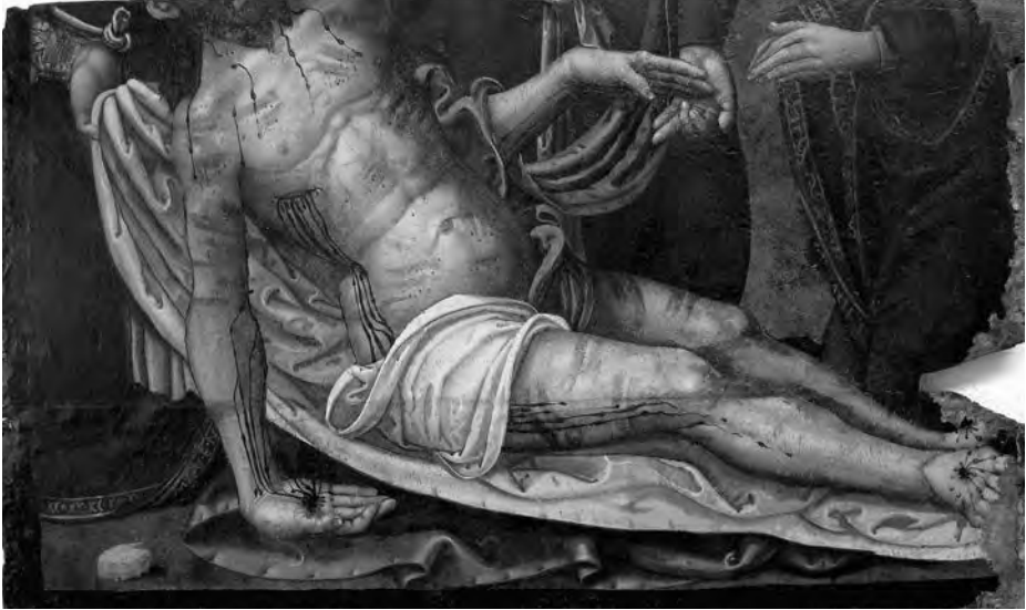
Deposició de Crist. Anònim, s. XVI. Pintura sobre taula. Col·lecció Fundació Privada per l'Arqueologia Ibèrica. Figuerola del Camp.