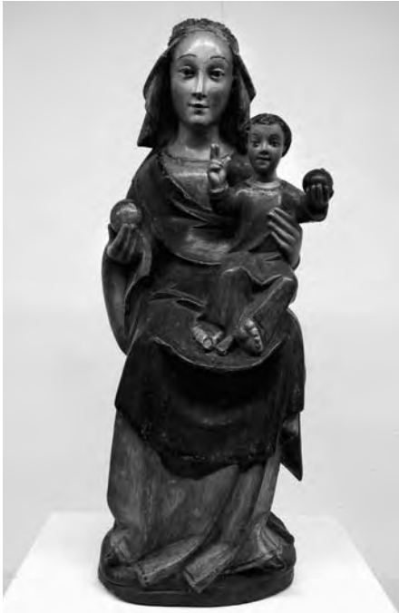
Mare de Déu amb Nen. Anònim, s. XV. Talla de fusta policromada. Col·lecció Fundació Privada per l'Arqueologia Ibèrica. Figuerola del Camp