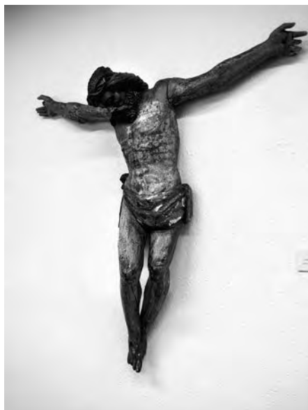
Crist crucificat. Anònim, finals s. XVI. Talla de fusta policromada. Col·lecció Fundació Privada per l'Arqueologia Ibèrica. Figuerola del Camp.