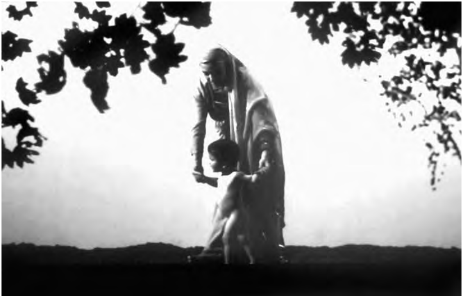
Maternità (Maternitat). Matteo Ferroni, 2007. Vídeo HD, càmera lenta, 23 minuts. Col·lecció de l'artista.