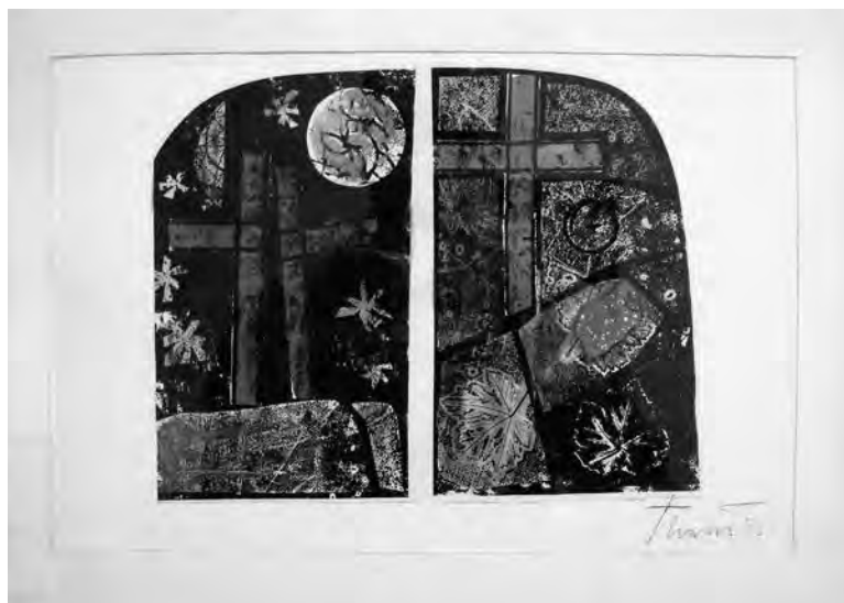
Calvari (projecte de vitrall). J.J. Tharrats, s. XX. Tècnica mixta sobre paper. Col·lecció particular. Valls.