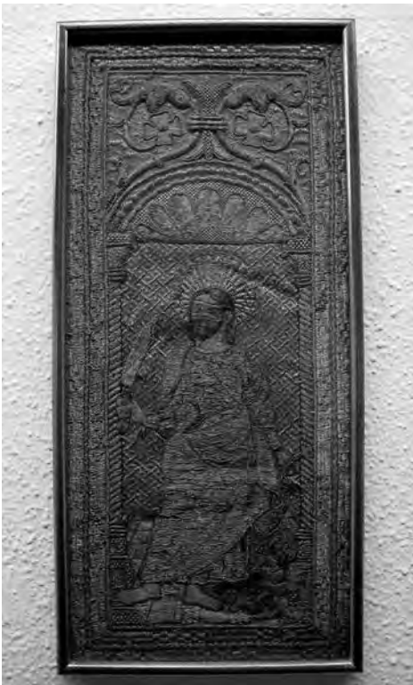
Sant Bartomeu. Anònim, s. XVI. Brodat amb fil d'or. Col·lecció particular.Valls.