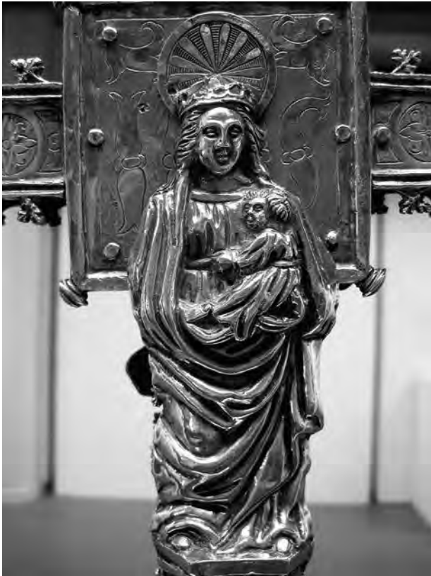
Creu processional (detall, Mare de Déu). Anònim, principis s. XVI. Plata. Col·lecció parròquia Sant Joan Baptista. Valls.