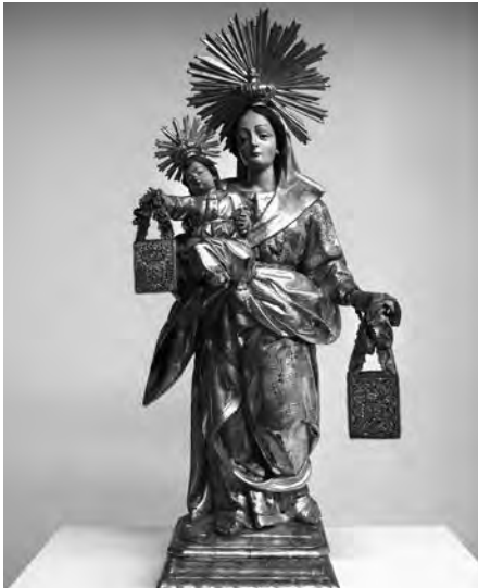
Mare de Déu sota la invocació del Carme. Atribuïda al taller de Lluís Bonifàs, s. XVIII. Talla de fusta policromada. Col·lecció particular. Valls.