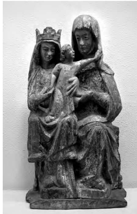
Santa Generació (Santa Anna, Maria i Jesús). Anònim, segona meitat s. XIV. Talla de fusta policromada. Col·lecció particular. Valls.