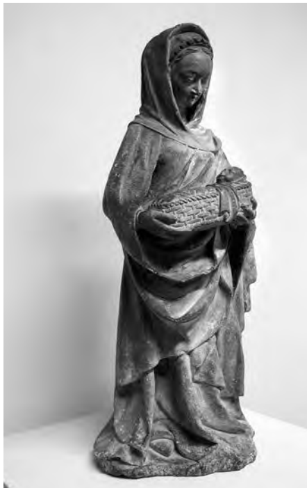
«Troballa de Moisès al riu Nil», o bé «Fugida a Egipte». Anònim, s. XV. Talla en pedra. Col·lecció Fundació Privada per l'Arqueologia Ibèrica. Figuerola del Camp.