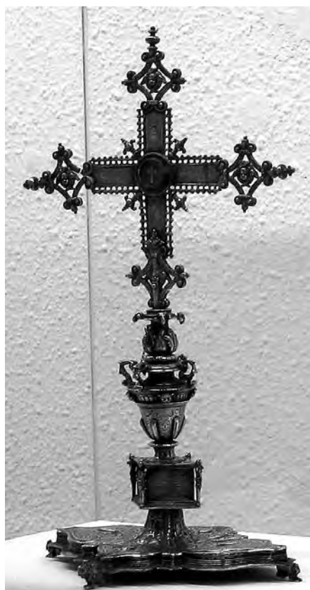
Vera creu gòtica. Anònim, s. XV. Plata. Col·lecció parròquia Sant Joan Baptista. Valls.