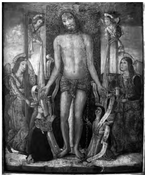
Crist al peu de la columna. Anònim, s. XVI. Pintura sobre taula. Col·lecció Fundació Privada per l'Arqueologia Ibèrica. Figuerola del Camp.