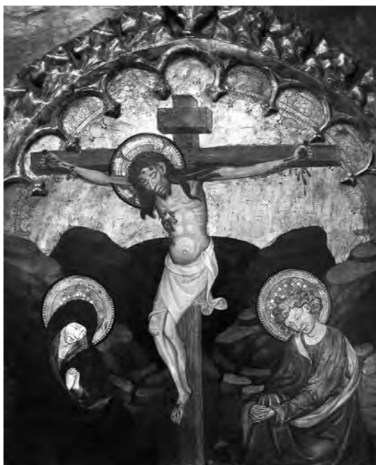
Taula del Calvari. Anònim, s. XIV. Pintura sobre taula. Col·lecció Fundació Privada per l'Arqueologia Ibèrica. Figuerola del Camp.