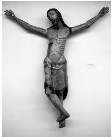
Crist crucificat. Anònim (XIII-XIV). Talla de fusta policromada. Col·lecció Fundació Privada per l'Arqueologia Ibèrica. Figuerola del Camp.