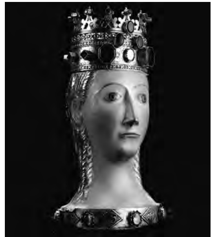
Cap-reliquiari de santa Úrsula. Anònim, s. XIV. Plata i policromia. Col·lecció parròquia Sant Joan Baptista.Valls.