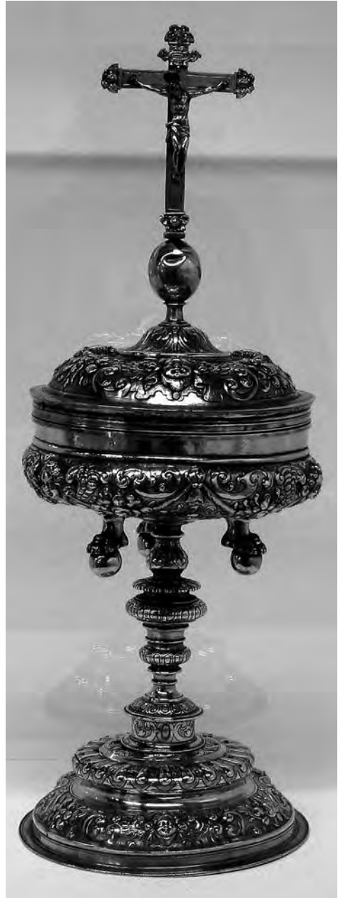
Copó. Anònim, s. XVII. Plata daurada. Col·lecció parròquia Sant Joan Baptista. Valls.