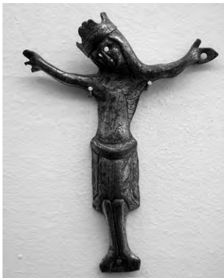
Creu de Lletotges. Anònim, finals s. XIII. Coure sobredaurat. Col·lecció Fundació Privada per l'Arqueologia Ibèrica. Figuerola del Camp.