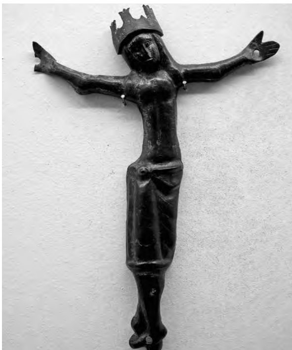
Crist. Anònim, s. XIV. Coure sobredaurat. Col·lecció Fundació Privada per l'Arqueologia Ibèrica. Figuerola del Camp.