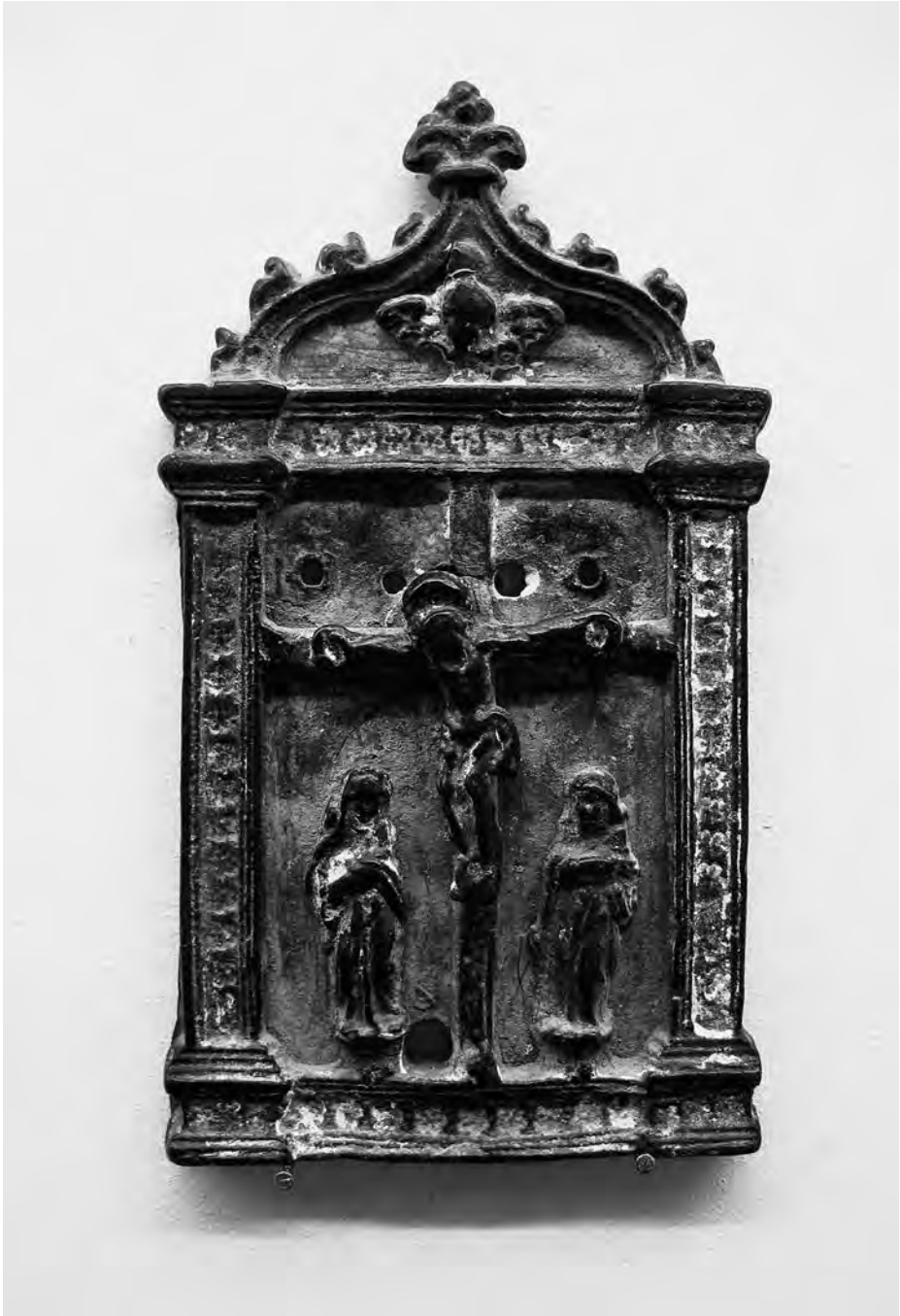
Portapau. Anònim, s. XVI. Fosa de bronze. Col·lecció particular. Valls.