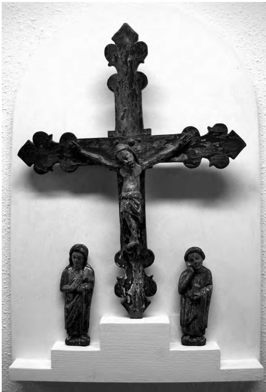
Calvari. Anònim, s. XIII. Talla de fusta policromada. Col·lecció particular. Valls.