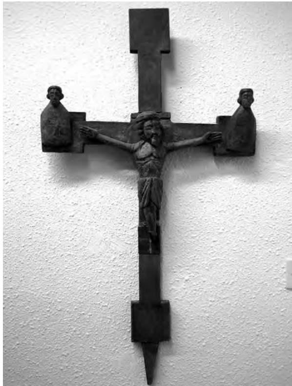
Calvari. Anònim (provinent del Pirineu), s. XII. Talla de fusta amb restes de policromia. Col·lecció particular. Valls.