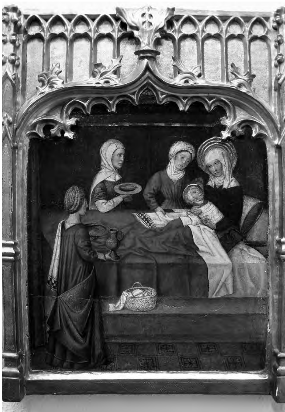
Nativitat de la Mare de Déu. Anònim, s. XIV. Pintura sobre taula. Col·lecció Fundació Privada per l'Arqueologia Ibèrica. Figuerola del Camp.