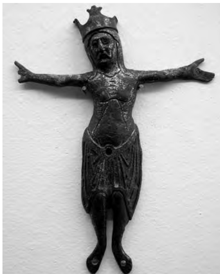
Creu de Lletotges. Anònim, s. XIII. Coure sobredaurat. Col·lecció Fundació Privada per l'Arqueologia Ibèrica. Figuerola del Camp.