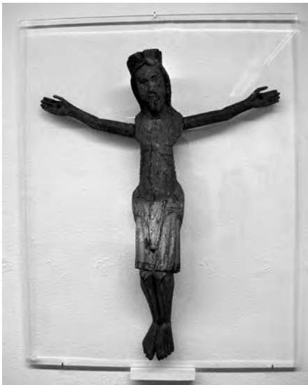
Crist crucificat. Anònim (XII-XIII). Talla de fusta policromada. Col·lecció Fundació Privada per l'Arqueologia Ibèrica. Figuerola del Camp.