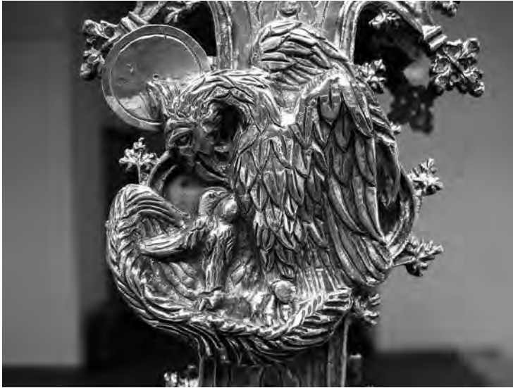
Creu processional (detall, pelicà). Anònim, principis s. XVI. Plata. Col·lecció parròquia Sant Joan Baptista. Valls.