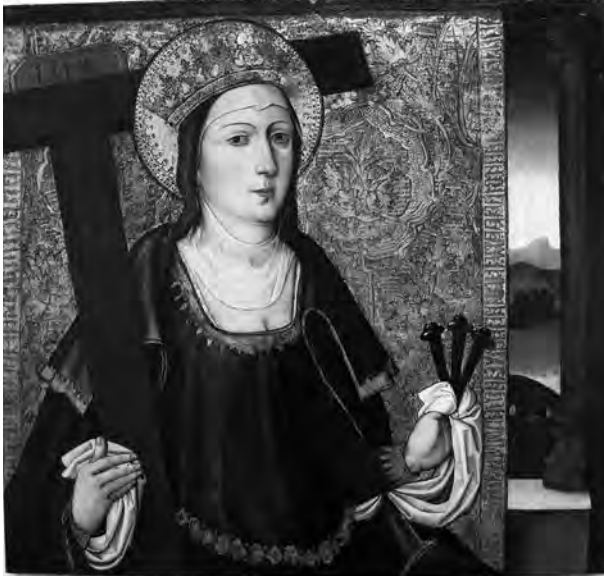
Santa Helena. Anònim, s. XVI. Pintura sobre taula. Col·lecció Fundació Privada per l'Arqueologia Ibèrica. Figuerola del Camp.