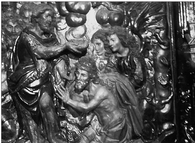
Detall de l'escena del Baptisme de Jesús per sant Joan en un dels quadres del segon pis del retaule.