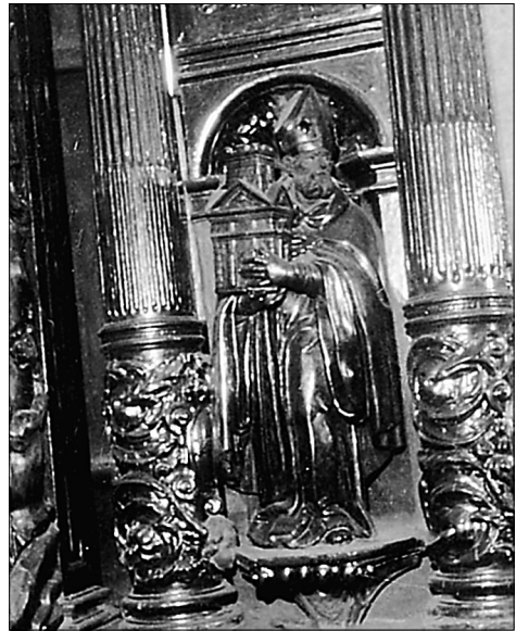
Escultura d'un dels doctors de l'Església (sant Agustí ?).