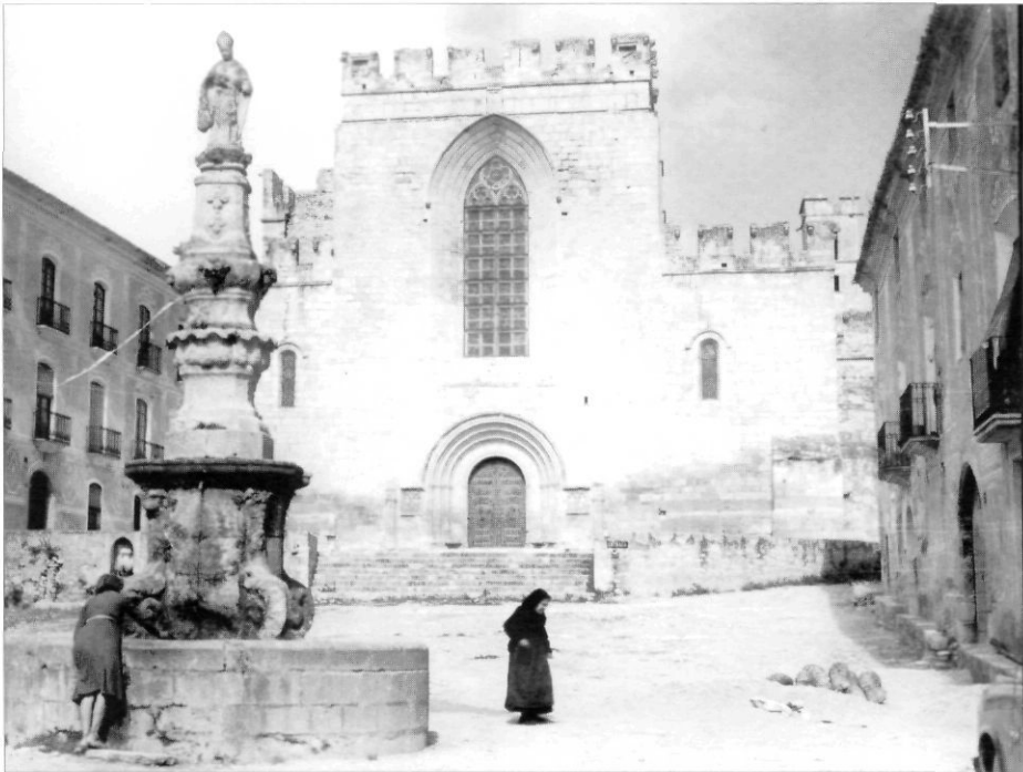
Fotografia de Santes Creus feta per Pere Català i Roca l'any 1959 i publicada a la primera edició de la Guia de Catalunya de Josep Pla.