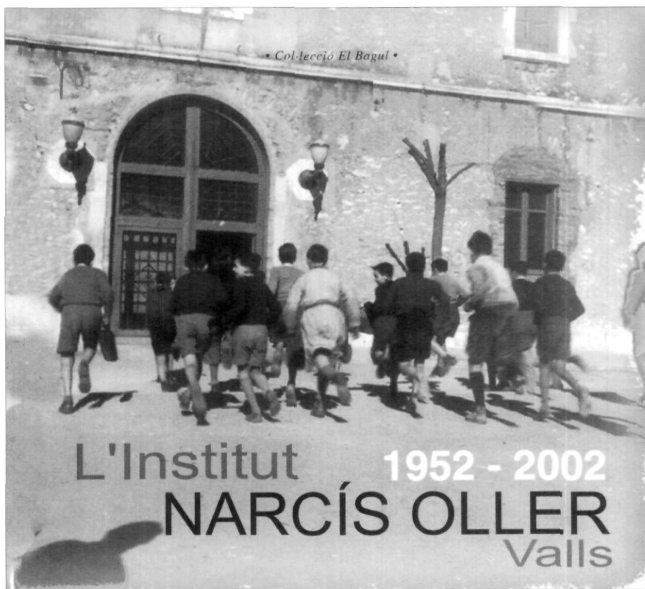
Coberta del llibre sobre la història de l'Institut editat amb motiu del 50è aniversari: L'Institut Narcís Oller. Valls, 1952-2002 .