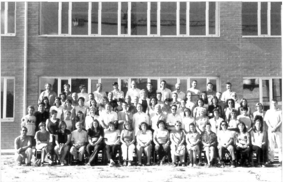
Professorat i personal no docent de l'Institut, en l'any del cinquantè aniversari.