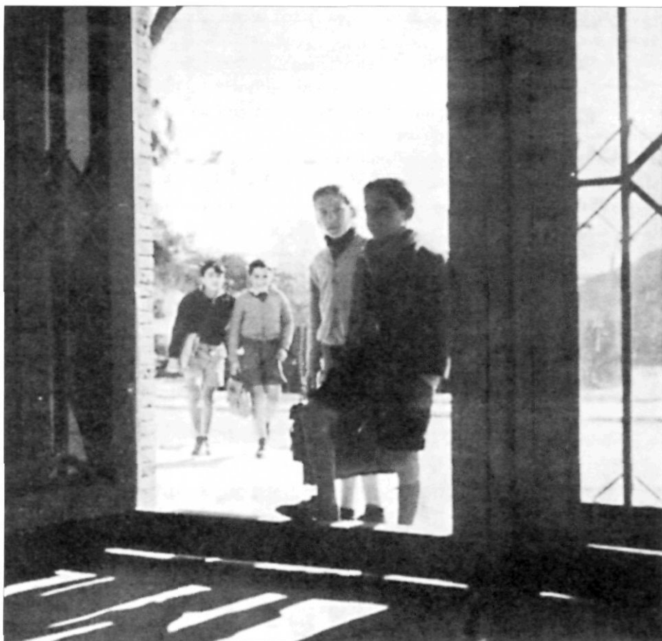
El fotògraf Valero Llussà és l'autor d'aquesta fotografia, segons sembla, feta el primer dia de classe del batxillerat laboral, el 4 de novembre de 1952.

Media y Profesional de Modalidad Agrícola-Ganadera”; dit d’una altra manera, es tractava d’un institut laboral que havia d’acollir els estudis de batxillerat laboral, implantats 4 recentment a l’Estat. Per poder realitzar les pràctiques agrícoles l’Ajuntament donà un terreny, conegut com ca la Bomba, al lloc que actualment ocupen la Creu Roja, els bombers, el Baltasar Segú i el Jaume Huguet. El propòsit d’aquest batxillerat era “cubrir una necesidad cual es dar mayores facilidades de expansión cultural a una gran masa de población que, por circunstancias de residencia lejos de