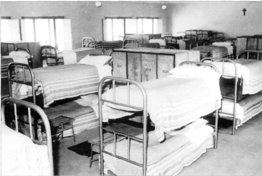
Un dormitori del Col·legi Menor, instal·lat a l'edifici de la plaça del Quarter durant vuit cursos.

(Ciutadella i Ferreries); tres de les Garrigues i la Segarra (l'Albi, Cervià i Sant Guim); quinze de les comarques de l'Ebre (especialment d'Ampostà i Gandesa i també d'Alcanar, l'Aldea, Ascó i Sant Carles); vint-i-sis del Penedès (sobretot de Vilafranca, però també de la Bisbal, Castellví de la Marca, els Monjos, Sant Martí Sarroca, Sant Sadurní i Subirats), i encara cinc més d'Herbès, Gironella, Moià, l'Ordal i Sallent, respectivament.