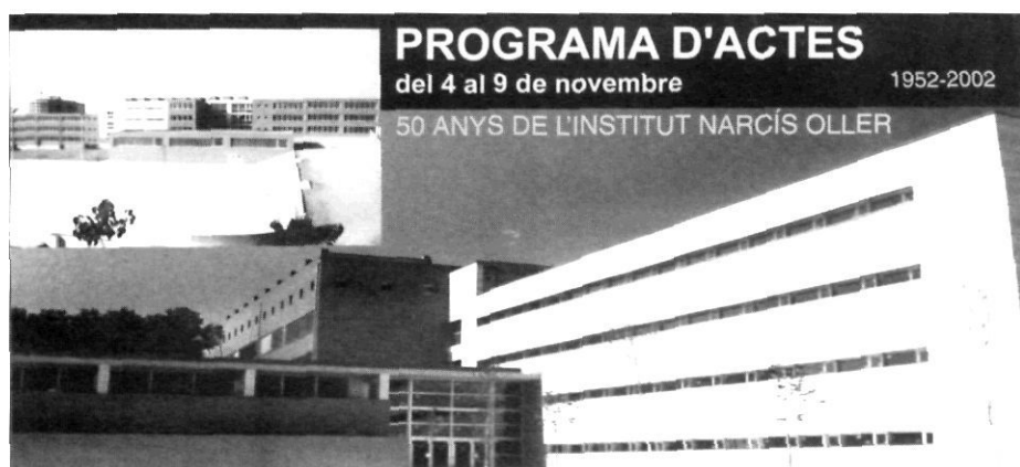
Coberta del programa d'actes que s'elaborà amb motiu del 50è aniversari de l'Institut.

El gruix de la commemoració, però, es va concentrar en la setmana del 4 al 9 de novembre de 2002, exactament cinquanta anys després de la primera setmana de classes a l'Institut. Un cop inaugurat el centre per la consellera d'Ensenyament, Carme Laura Gil, el mateix dia 4, tot un seguit d'actes de diferent caire van configurar la celebració de l'efemèride. Els actes de caire intern, com xerrades, tallers, gimcana, cinema, excursió col·lectiva, berenar i concert van dirigir-se essencialment a la comunitat educativa actual. D'altra banda, amb els actes externs es va intentar que tota la població —relacionada o no amb l'Institut— visqués també d'alguna manera l'aniversari.