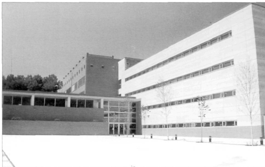
Vista frontal de l'edifici actual de l'Institut Narcís Oller, estrenat el curs 2002-03.