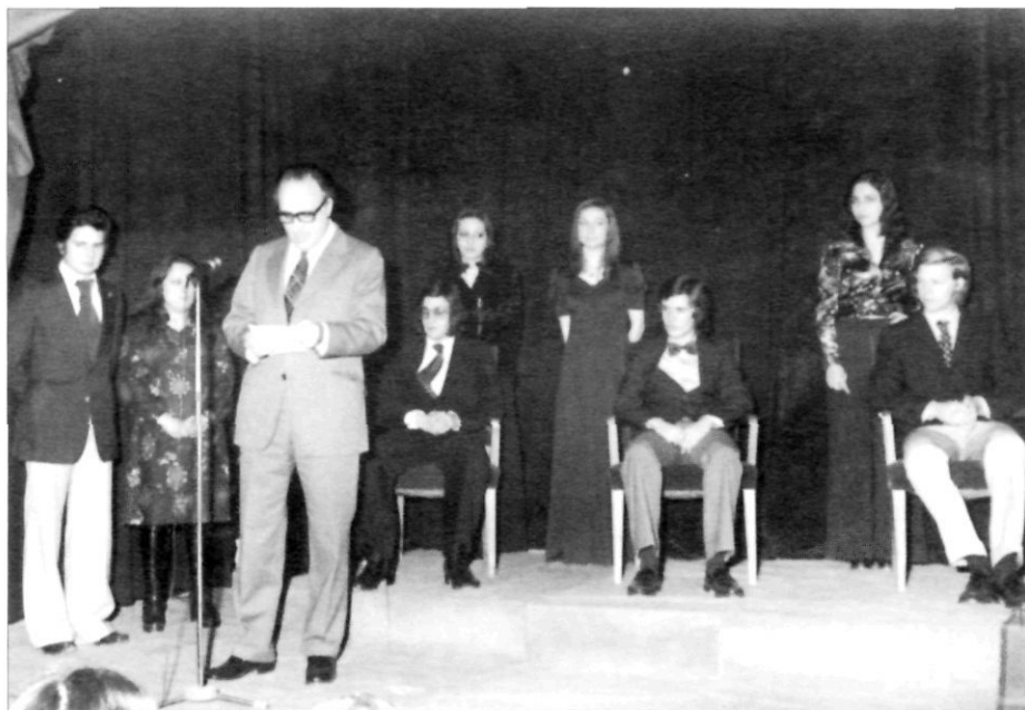
Un moment de la festa de Sant Tomàs d'Aquino de 1974.