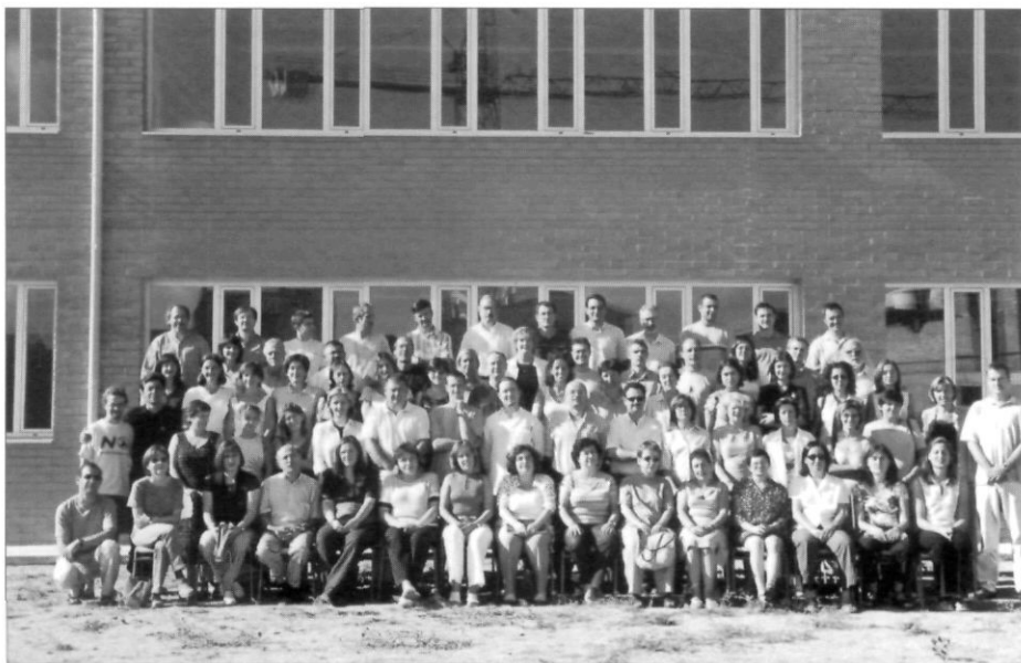
Professorat i personal no docent de l'Institut, en l'any del cinquantè aniversari.