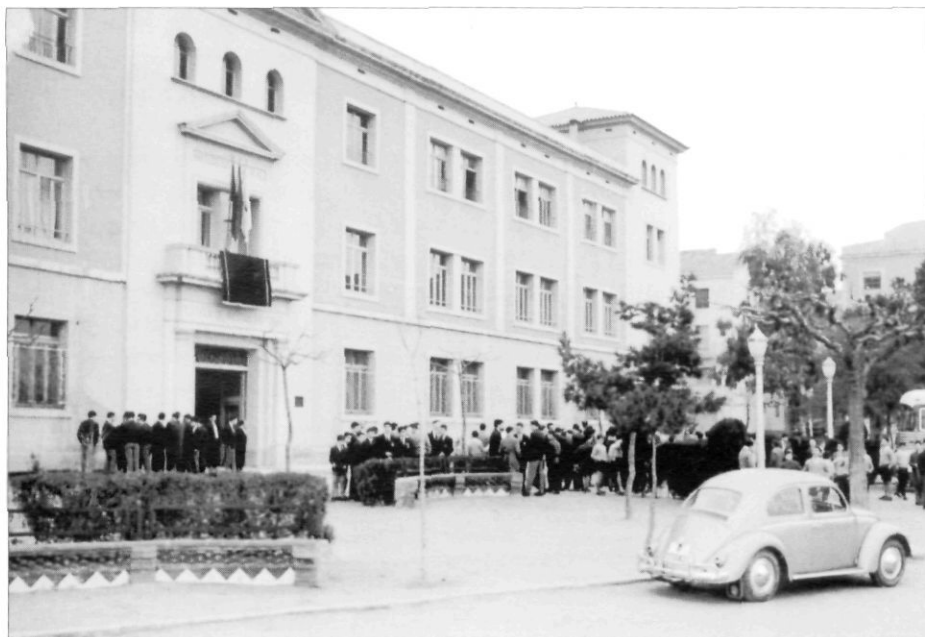
Façana de l'edifici de l'Institut, a la plaça del Quarter, a començament dels anys 60.