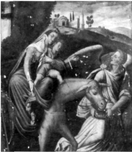
Hortonedà, pel que sembla, va pintar el 1608 el quadre Fugida a Egipte , compartiment del retaule del Sant Nom de Jesús, per a l'església de Vallmoll. (Extret d' Aplec de Treballs núm. 12. CEGB. Montblanc, 1994, p. 97)

Treball que sintetitza el conegut sobre el pintor Hortonedà. De Vallmoll, va rebre l'encàrrec de la suposada taula que va pintar el 1608, Fugida a Egipte , compartiment del retaule del Sant Nom de Jesús, dipositat al Museu Diocesà de Tarragona, el 1914, procedent de la parroquial. S'assenyalen detalls curiosos com que el 4 d'agost de 1608 el pintor cobrà 130 lliures i 2 diners dels jurats de Vallmoll, reconeixent haver-los cobrat pel seu treball en un retaule dedicat al Sant Nom de Jesús. Part de la quantitat l'havia rebuda en espècies: carn i una mesura (cortera) de blat, aspecte que fa suposar a l'autora de l'article que aquesta vianda li devia haver estat subministrada a Vallmoll mentre pintava. A continuació s'hi detallen aspectes de contrast amb un quadre del mateix nom realitzat a Montblanc, en punts com Maria, amb l'infant als braços, rialler, muntada sobre una somera conduïda per l'àngel; turons coronats per unes construccions que poden ser identificades amb un obelisc i el Panteó de Roma; les tonalitats grisenques com a paisatge de fons i del cel; etc.; i, tanmateix, aspectes que no surten en un dels dos quadres posats a col·lació i contrast. Una fotografia il·lustra l'explicació.