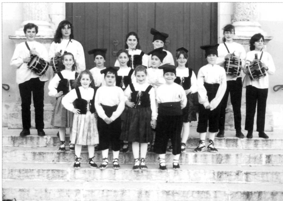
A Vallmoll s'ha recuperat el Ball del Patatuf gràcies a l'agrupació El Moll. Components del ball, el 1996, a Vila-seca, a les portes de l'església, a la Trobada de Danses Vives.