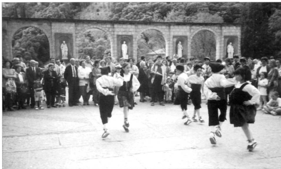
Ball del Patatuf de Vallmoll, a Montserrat, a l'Aplec de Pentecosta