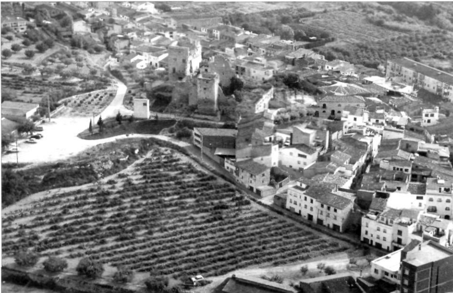
Fotografia de Vallmoll des de l'aire, publicada al llibre A vol d'ocell . Setmanari El Pati . Valls, 1999, pp. 112-113.

Loc. pàgs. 53, 136, 152, 166, 173, 357-358 i 365 (BIEV)