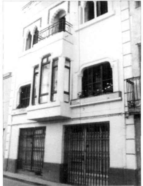
Fotografia del llibre L'Alt Camp : habitatge de l'avinguda de Catalunya

Estudi minuciós, de qualitat, que concorda totalment amb el títol del treball. A través de l'enquesta, àmplia, ben documentada, es treuen unes conclusions de present i, sobretot, de futur, de múltiples aspectes dels hàbits de la població estudiada. Les referències de Vallmoll que hi surten són, d'una banda, la població a 31 de març de 1992, xifrada en 1.031 persones, i de l'altra que a la mostra de 830