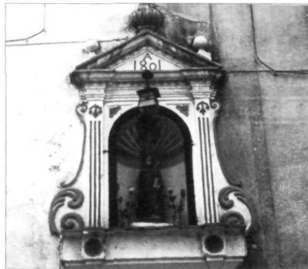
Fotografia del llibre L'Alt Camp : Capelleta de Sant Magí.

Excel·lent treball de síntesi, el qual, acompanyat de vint fotografies de Vallmoll, el fan summament atractiu. S'hi desgranen una visió panoràmica de la vila, per entrar després en l'explicació del castell,