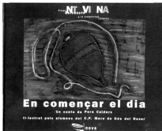
Portada del llibre En començar el dia , conte de Pere Calders, il·lustrat per escolars del col·legi públic.

A partir d'estudis precedents de caire sociològic es repassa l'escassa incidència dels alumnes adolescents a participar-opinar en política. L'estudi se centra a treballar amb 381 alumnes, majoritàriament de 12 a 16 anys, per veure'n la seva possible implicació a votar en unes eleccions al Parlament de Catalunya del març de 1992. En aquest estudi s'interrelacionen la concepció nacional catalana amb el curs que cada alumne fa a l'escola o Institut, l'edat i el sexe, i naturalment en surten diverses variables i conclusions. Una d'aquestes és el fort component nacional en determinats segments d'enquestats en funció de la seva procedència.