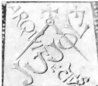
Fotografies del llibre L'Alt Camp : ermita del Roser i signatura de l'arquitecte Jujol, restaurador de l'ermita.