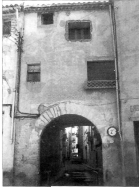
Fotografia del llibre L'Alt Camp : Portal de la Creu.

584. L'Alt Camp . Direcció General del Patrimoni Cultural. Servei de Patrimoni Arquitectònic de Catalunya. Departament de Cultura. Generalitat de Catalunya. Barcelona, 1992. 150 pàg.