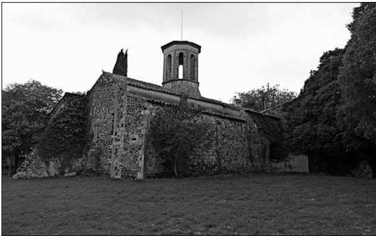
Fig. 2. Façana nord de l'església de Franciac, a la dreta de l'arbre es poden veure els carreus ben escairats resta del mur de l'antic temple romànic.

Tot i totes aquestes notícies, és difícil fer una reconstrucció de la trama urbana que tenia la cellera de Franciac, potser amb una lectura completa de tots aquests documents i els que puguin anar apareixent en un futur es podrien establir les diferents propietats, tot i així és fàcil pensar que es tractava d'una trama prou consolidada amb petites cases, patis i corrals amb façana a un carrer que donava a l'església i esquena a un mur que l'envoltava. Pels documents sabem que a la banda exterior del mur una depressió del terreny com a petit vall o fossar acabava d'ajudar a augmentar l'eficàcia de les defenses d'aquesta petita força. L'últim document que aportem potser és el que ens dóna més dades sobre l'interior d'aquest petit nucli urbà, les cases que es venen els Batlle al teixidor Viader, es trobaven en l'angle