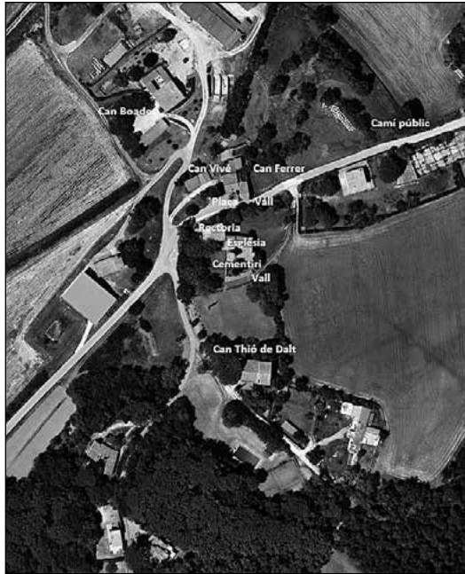
Fig. 5. Situació actual de les cases que es capbreven el 1757-58 i del vall de la fossa que encara es recorda.

la mateixa parròquia i de ses terres, honors i possessions” capbreva “vuit vessanes de terra poc mes o menys que juntes afronten a Solixent amb honor meu que fou de pertinences del mas Martorell part i amb honor del mas Vidal que jo posseixo; a Migdia amb honor meu camí mitjançant, a ponent amb camí en part i part amb el vall de la fossa i part amb honor d'en Domènech; i a tramuntana amb dit Domenech mediant camí públic.