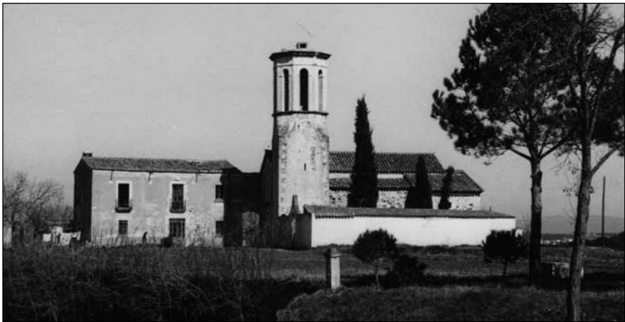
Fig. 1. El nucli de Franciac a principis dels 60.

Si avui ens acostem al nucli rural de Franciac, un petit conjunt format per l'església, el cementiri i la rectoria annexa, ens és difícil imaginar que mai hi hagi pogut haver cap trama urbana però els documents dels segles XIII i XIV ens diuen una altra cosa.