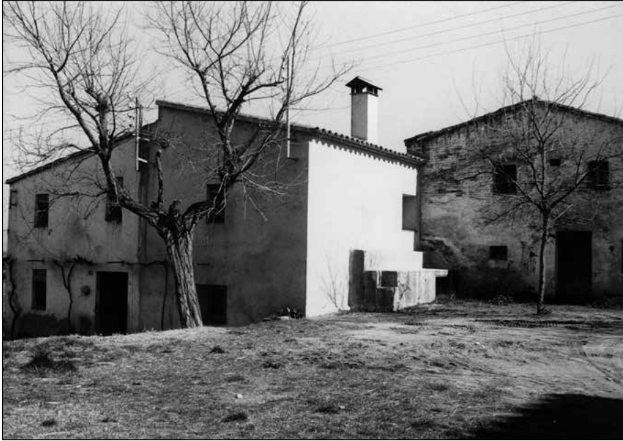
Fig. 4. La Plaça de Franciac, antigament coneguda com l'Era del Benefici, en primer terme can Vivé, amb el pedrís dels músics adossat a la paret sud, al fons la façana de can Ferrer (Anys 60).