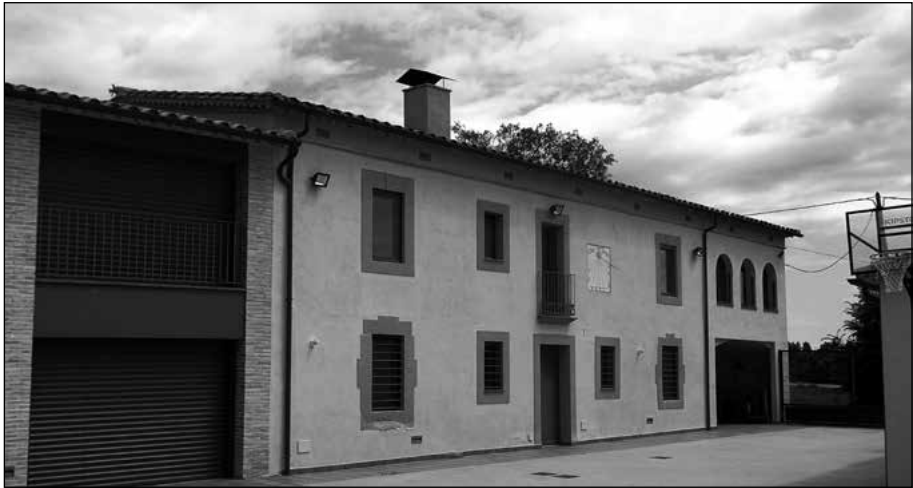
Figura 5. Can Turon.