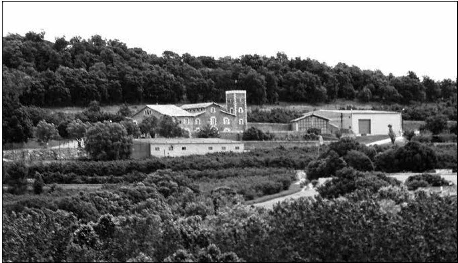
Figura 1. Can Costa.