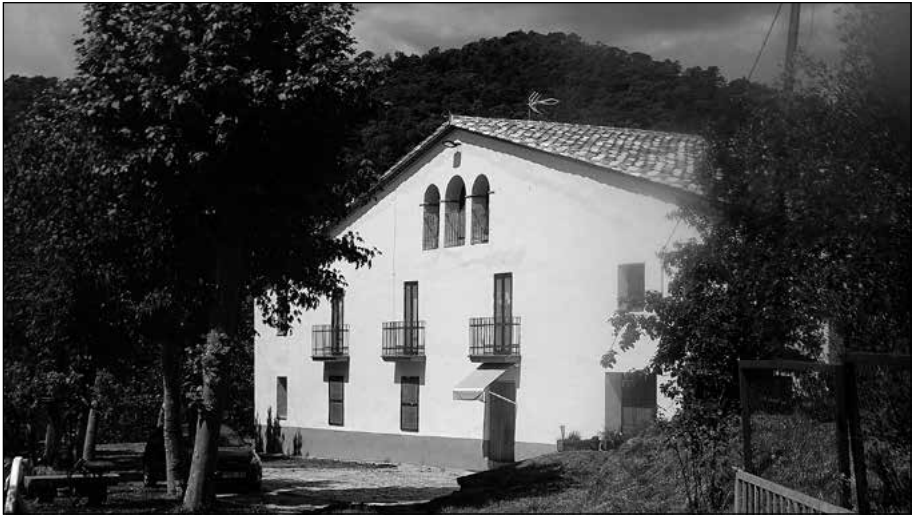
Figura 6. Cal Sabater.