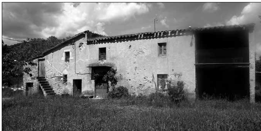
Figura 3. La Casa del Pla.