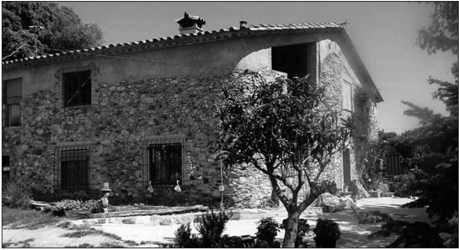
Figura 4. Can Font.