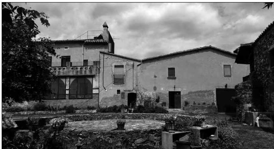
Figura 7. Can Grau.