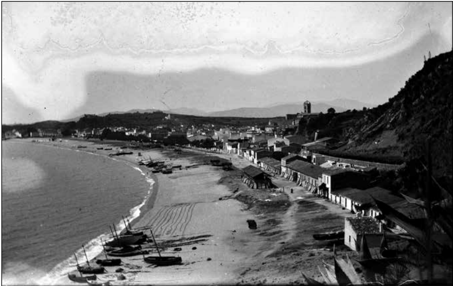
Imatge 2. Blanes des del racó de Sant Antoni. Al fons, acabada la vila, el puig Massaneda, on s'hi deuria trobar la borda d'en Massanet.

Font: AMLB, Fons Josep Alemany i Borràs, c. 1905.