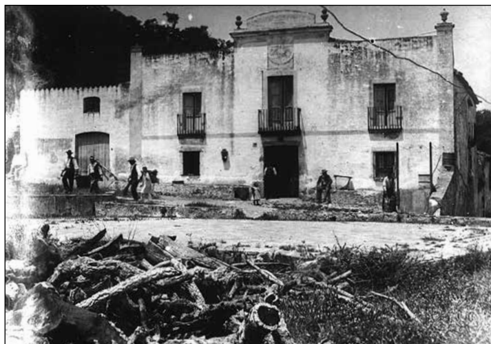
imatge 1. El mas Salvador de la Creu de Tossa a finals del segle XIX.