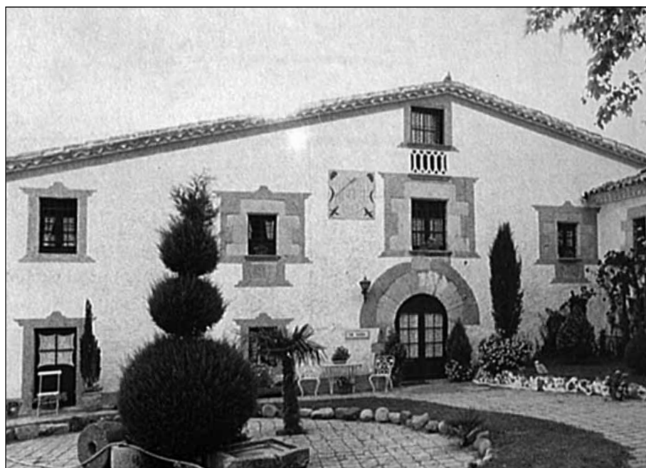
Figura 5. Can Sagrera, masia del segle XVI construïda sobre el mas on vivia Pere Sagrera el 1336.

Procedència de la foto: Reproduïda a la p. 34 del llibre Carícia de Volcà . Autors del llibre: Silvia Arbat, Eva Rigau, Lluís Solé i altres. Ajuntaments de Bescanó i Vilobí, 1991.