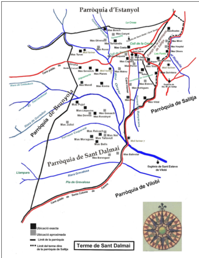
Figura 4. Els masos del terme de Sant Dalmai l'any 1336.

línies divisòries de les parròquies d'Estanyol i Brunyola. Hi ha 8 masos situats a ponent del volcà de la Crosa.