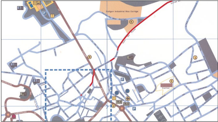
De la pista del Sobirà a l'interior de Sant Hilari (recorregut urbà).

travessa la carretera d'Osor. Continua pel carrer Montsolís i desemboca a la plaça Jacint Verdaguer, on podem posar fi al seu recorregut. No és difícil saber la resta del recorregut pel poble. Des d'aquí puja pel carrer Valls i després pel carrer de Vic, fins a la sortida.