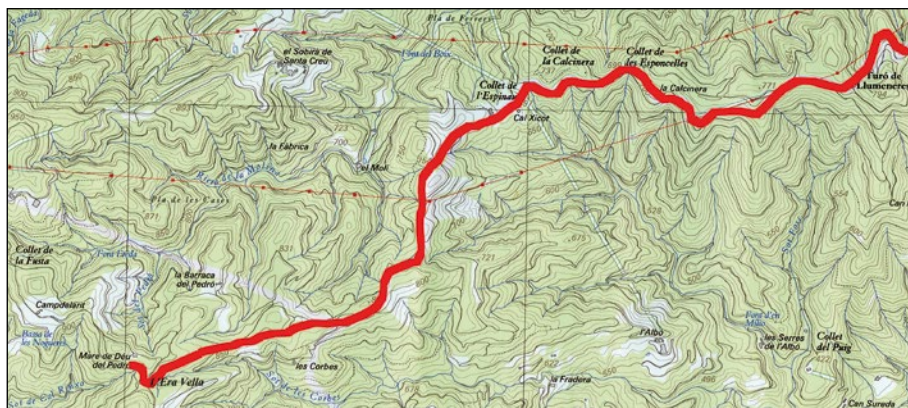
Del turó de Llumeneres a l'ermita del Pedró.

El collet de l'Espinau (el Nomenclàtor Geogràfic Oficial de Catalunya de l'any 2004 el recull com a collet de l'Espinal) és un indret d'entrada a la subcomarca natural de les Guilleries i límit municipal entre Santa Coloma de Farners i Osor i en el qual s'hi situa el mas homònim 13 . Possiblement el collet va originar el nom del mas, però també podria ser a l'inrevés 14 . El mas de l'Espinau o simplement l'Espinau (antigament lo Espinalb) es troba documentat per primera vegada l'any 1562: "Una casa de nou construïda a la part de migdia del camí vigatà" 15 . Pertany a la parròquia de Santa Creu d'Horta i des de sempre ha estat propietat de ca n'Iglésies. És probable que ja des del seu origen fes d'hostal, atesa la seva situació al peu del camí ral. En una gran pedra de granit que hi ha sobre la llar s'hi veu