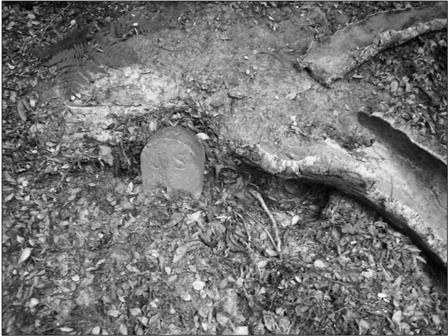
Una fita de terme particular situada al peu del camí, prop del Coll de Roscall.