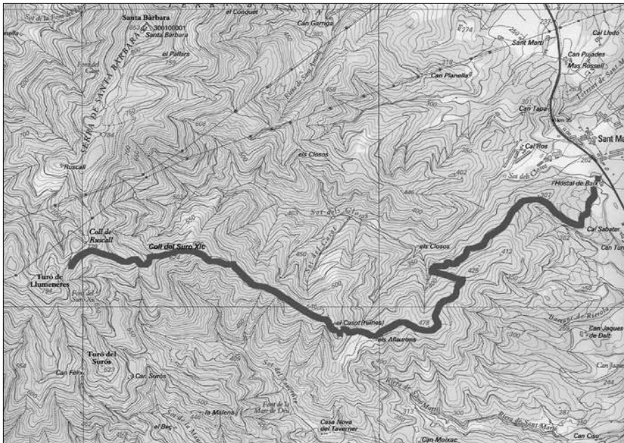
De Sant Martí a sota del turó de Llumeneres.

Passat l'antic hostal de Baix, el camí travessa la riera del Conquet mitjançant un pont. És una pista ampla que segueix en un terreny pla i de bon fer que va