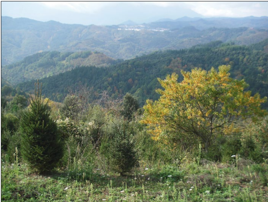
Vista de la vall de Vallors des de Campdelarit, una casa situada al costat del camí, a mig trajecte entre l'ermita del Pedró i la pista del Sobirà.

Passada l'ermita el camí segueix davallant suaument i després remunta fins a arribar a la pista forestal del Sobirà. El recorregut és d'un quilòmetre. El llarg tram restant (6,6 Km), és de bon fer fins a Sant Hilari. Cal suposar que aquesta pista, ara ampla i fresada, abans era més estreta. Probablement, el camí antic seguia el mateix traçat amb alguna variant. Crec que l'entrada al poble és feia pel carrer mas Garriga, que parteix de la pista uns 500 metres abans d'arribar al polígon industrial, i continuava pel Camí del Fondo En entrar a les primeres cases del poble, enllaça amb el carrer Hospital; després segueix pel carrer Torras i Bages i