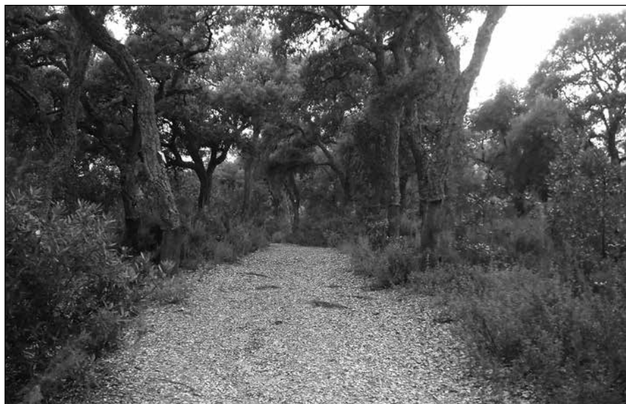
Prop dels Allaurons el camí passa per un bosc d'alzines sureres.