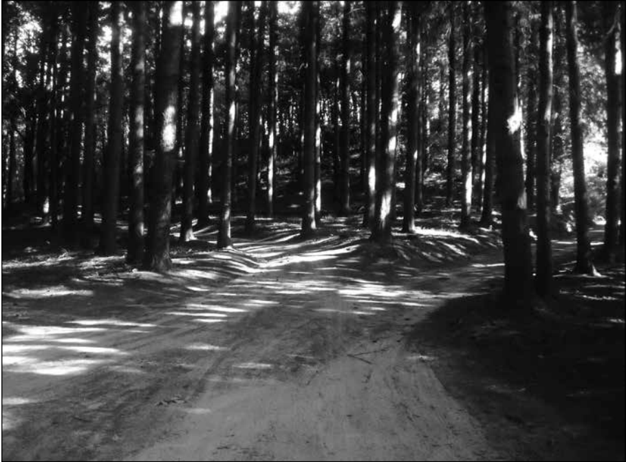
L'Era Vella és un ample coll cobert per una plantació de cedres i amb una cruïlla de varis camins.

l'actualitat, en aquesta casa de pagès solitària encara s'hi segueix fent d'hostal. Si hom ha fet una llarga ruta des de Sant Martí o des de Sant Hilari igual que ho feien segles enrere aquells traginers, bandolers, trabucaires, maquis, tropes i tota mena de transeünts, aquest vell hostal convida a fer-hi una parada. L'edifici, situat en un lloc feréstec al cor de les Guïlleries, amb les velles parets velles i els sostres fumats té més semblança a un hostal d'abans que a un d'ara.