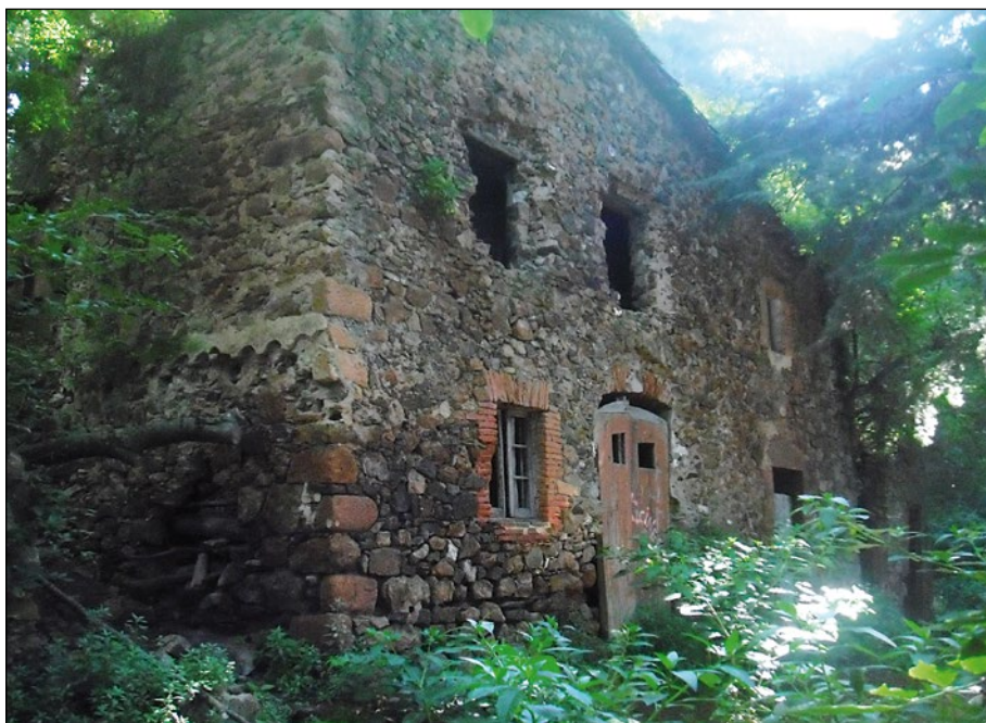
La Calcinera és una casa deshabitada i en ruïnes des de fa molts anys. Les parets gruixudes de pedra es resisteixen a caure.