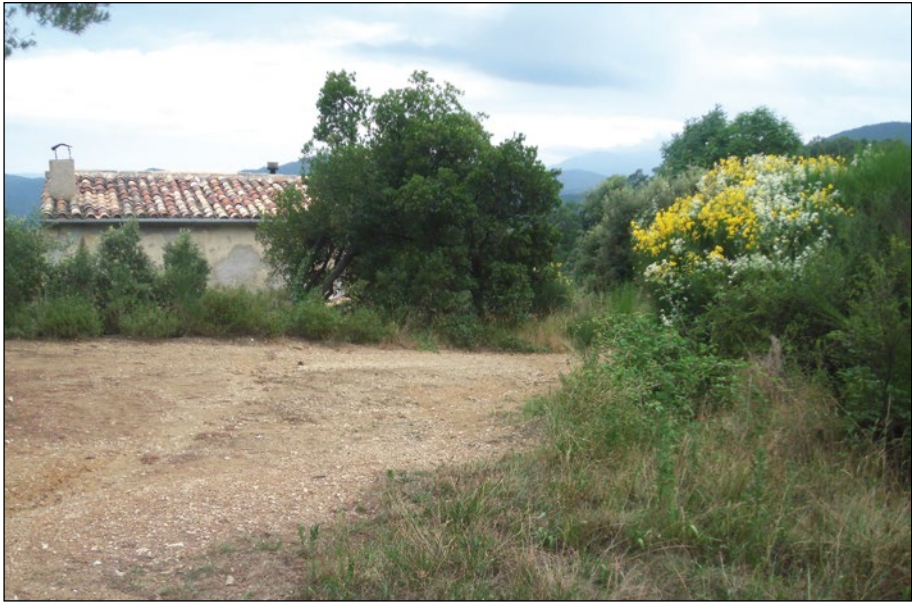
La Casa dels Allaurons. És una de les dues –i l'única habitada– que trobem al llarg del camí des de l'Hostal de Baix fins al Coll de Roscall.