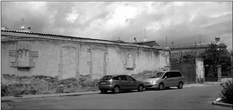
Riudarenes. A l'esquerra les restes de la casa Cobarsí, després anomenada Manresa, i a la dreta el mas oller del Padró. L'espai buit entre les dues construccions és on hi havia el molí vell d'en Manresa.