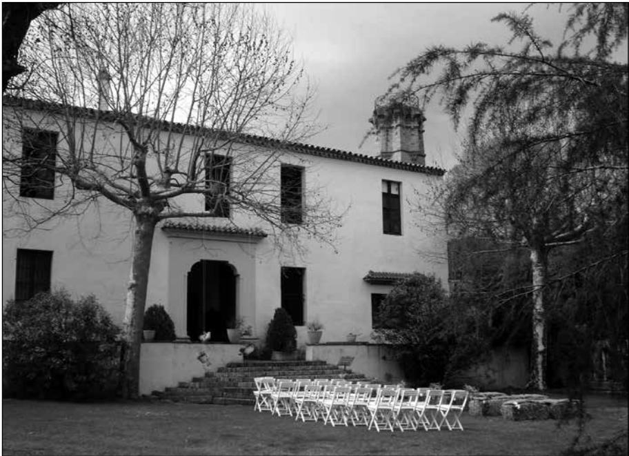
Riudarenes. Aspecte actual de la torre de Montcorb després de les reformes de finals del segle XIX realitzades per les famílies Manresa i Soler.