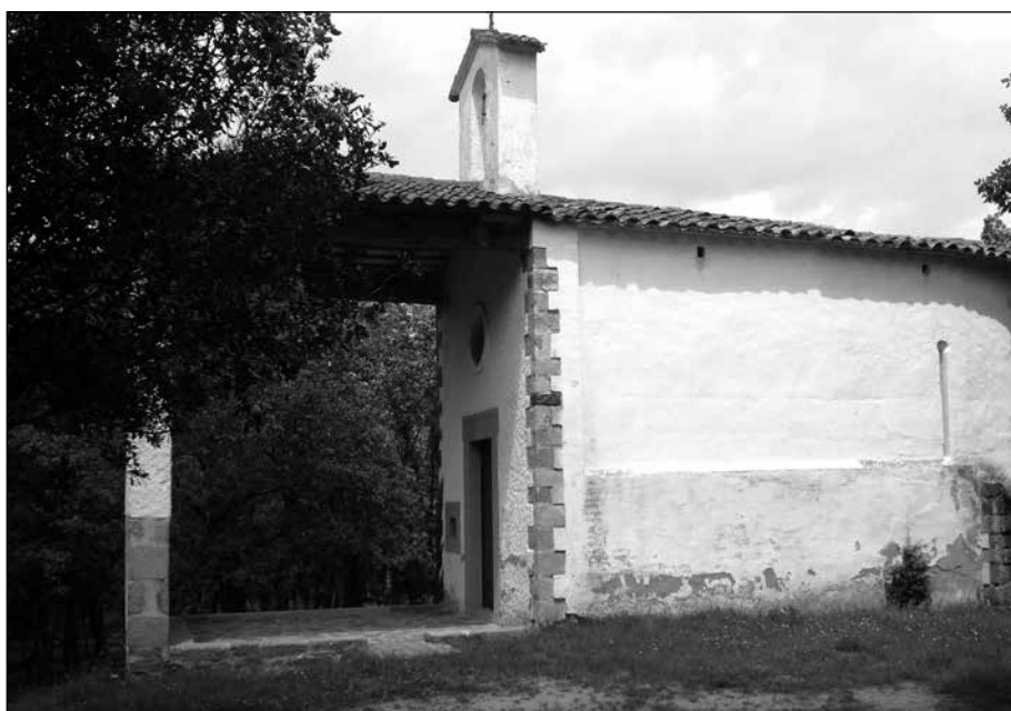
Riudarenes. La capella de Montcorb.