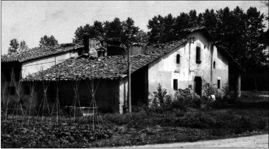
Riudarenes. El mas Rechs, actualment inexistent, per on passava el rec del molí.