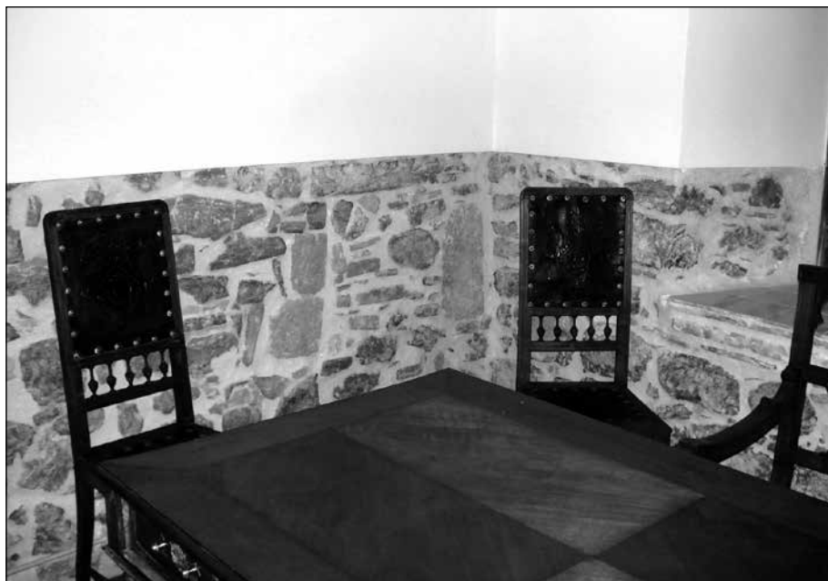
Riudarenes. Interior de la torre de Montcorb, on es veuen parets anteriors a la reforma de finals del segle XIX, quan l'edifici era de planta quadrada.