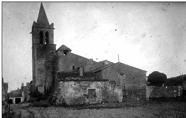
Maçanet de la Selva. Foto de l'any 1930 on es veu l'església parroquial, enganxada a la rectoria la casa Manresa, actualment inexistent. En el segle XVI, la pubilla Manresa es va casar amb l'hereu Cobarsí.