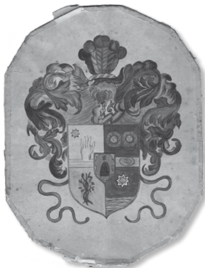
Escut dels Manresa.

Hisendat era el nom que a la fi del segle XVIII, concretament a partir de la Guerra Gran (1793-1795), designava a Catalunya el sector més ric dels propietaris rurals. Allò que els definia era el fet que la font principal dels seus ingressos provenia de les rendes de les finques. L'època daurada dels hisendats va coincidir amb l'era de la industrialització, els primers decennis del segle XIX. En canvi, el darrer quart del segle XIX suposà la crisi d'aquest sector, i molts s'arruïnaren. A començaments del segle XX ja no podien limitar-se a viure de les rendes i havien d'exercir com a professionals liberals a les ciutats. 1