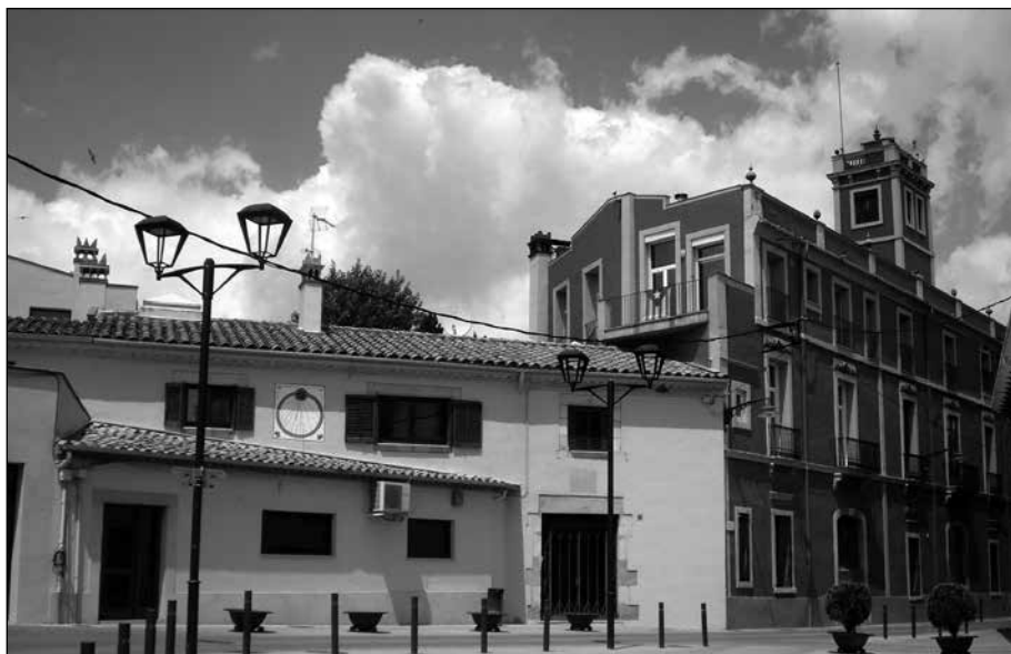
Riudarenes. A l'esquerra, el molí nou d'en Manresa edificat el 1816 i, a la dreta, la farinera aixecada a finals del segle XIX per la família Castells.

la Selva, disposaven de la casa Manresa, situada al costat de la rectoria i l'església parroquial, i del mas Manresa, que es vengueren el 1601. Fruit dels seu ascens econòmic aconseguiren la batllia de sac de Riudarenes i, en nom del vescomte de Cabrera, cobraven les rendes que corresponien a aquest a la batllia. També obtingueren el dret de vendre carn a Riudarenes i l'edifici de la carnisseria estava situat al costat de la casa Cobarsí. Percebién el terçó del delme, dit d'en Hostalric, a les parròquies de Riudarenes i Sils. També tenien el patronat del benefici de Sant Miquel, fundat a l'església parroquial de Riudarenes.