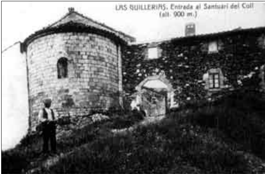
Antiga imatge de l'entrada al Coll. Els límits municipals se situarien enmig del camí i, per tant, de la porta d'entrada, de tal manera que la part de l'esquerra (el santuari) pertany a Osor i la de la dreta (l'hostal) a Susqueda.