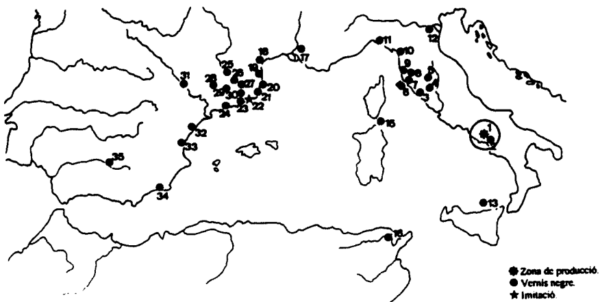
Fig. 2. Mapa de distribució de la forma Morel 4750: 1. Cales; 2. Franclise; 3. Cosa; 4. Bolsena; 5. Todi; 6. Illa d'Elba; 7. Populonia; 8. Volterra; 9. Castiglione; 10. Luni; 11. Gènova; 12. Adria; 13. Derelict Filicundi A (Illes Eòlies); 14. Norchia; 15. Derelict d'Spargi (Sardenya); 16. Cartago; 17. Glanum ; 18. Ensèrune; 19. Ruscino ; 20. Rhode ; 21. Emporion ; 22. Blanda ; 23. Burriac ; 24. Tarraco ; 25. Iesso ; 26. Aeso ; 27. Sant Miquel de Sorba; 28. Ilerda ; 29. Sigarra ; 30. Turó de Can Tacó; 31. Salduie ; 32. Torre la Sal; 33. Valentia ; 34. Cartagena ; 35. Corduba .

També s'ha localitzat un altre itinerari sud-mediterrani, des de la Península Itàlica cap al nord d'Àfrica (Campània-Cartago), demostrat pels exemplars exhumats d'aquesta forma al peci Roghi A de Filicundi (Illes Eòlies, Sicília) (CAVALIER, 1985: fig. 146), i a Cartago (Tunísia) (MOREL, 1981: 328-329) (fig. 2).