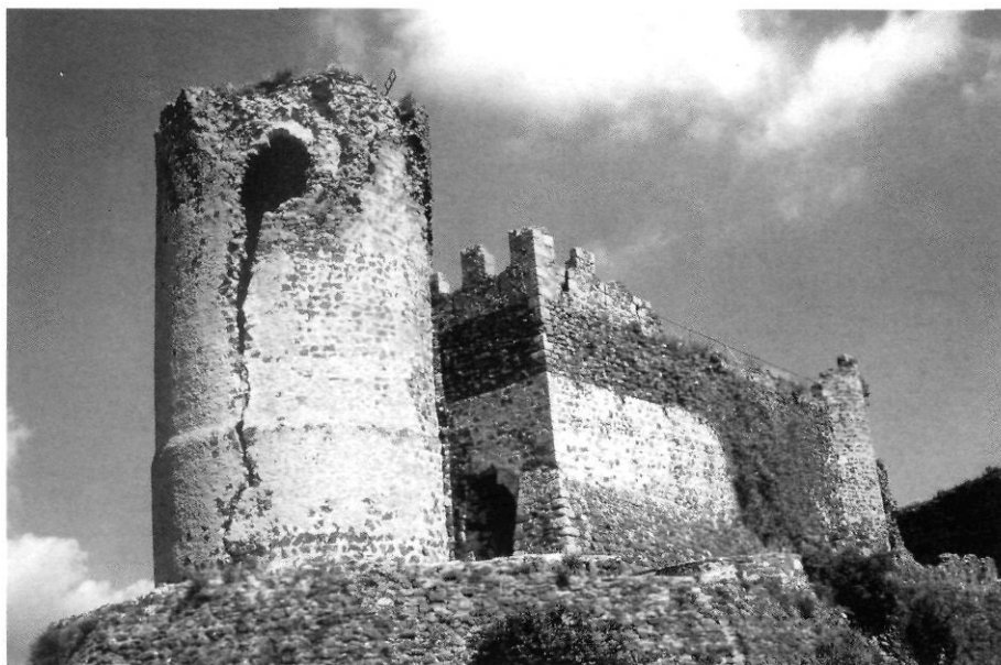
Castell de Montsoriu.