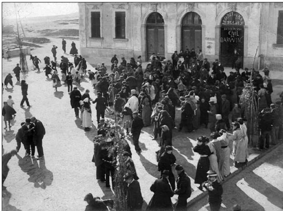
Acte d'inscripció de Darwin Austrich Alum al registre civil.

interessat pel seu contingut. A la fotografia es pot veure un parell d'homes llegint la inscripció d'aquestes targetes.