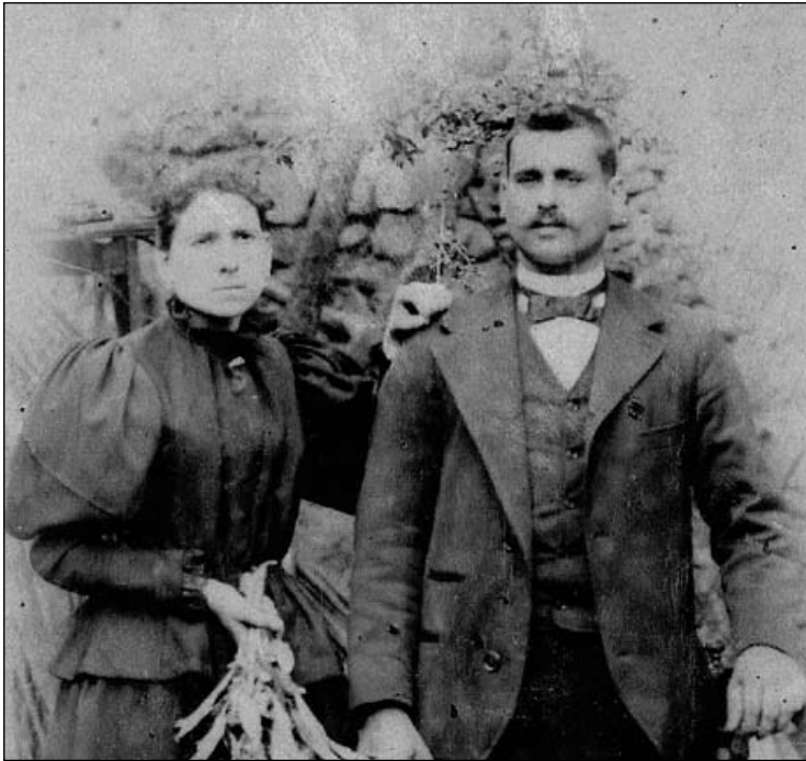
El matrimoni Austrich-Alum recent casats

d'altres, pel pare de la criatura, la mare de Germinal Ros i tres representants de la Unió Republicana, vinguts expressament de Barcelona.