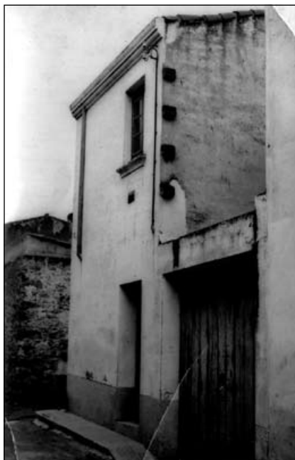
Núm. 14 del carrer Repartidor de Sant Isidre, casa on la Rosita venia a la menuda l'aigua de Caldes