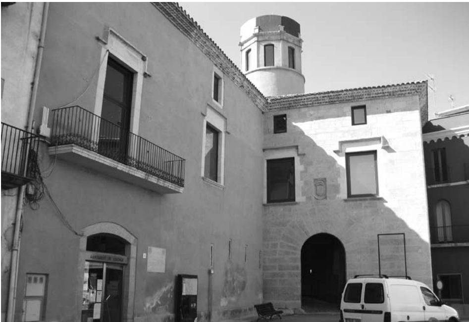
Ampliació amb les dependències de palau construïdes al segle XVII al castell de Calonge, residència habitual de Pere de Gomar (Baix Empordà).