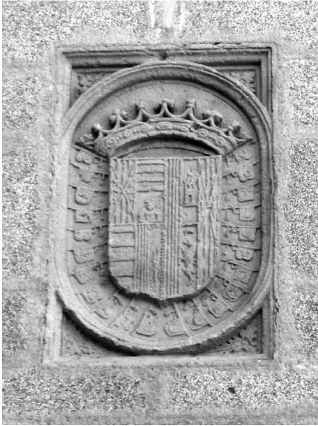
Escut del duc de Sessa, amb les armes dels Fernández de Córdoba sobre la llinda del portal del castell de Calonge, la que dóna a la plaça Major.

serioses dificultats econòmiques les universitats de dites viles, i els impedia “ administrar aquells los molts negocis y quefers que nos han oferts y se nos ofereixen cada dia per dita universitat ”. En altres paraules, no podien treure benefici dels arrendaments municipals, principal font d’ingressos dels comuns (les despeses que generava la guerra anaven en augment i l’administració necessitava noves fonts d’ingressos). Qualsevol infracció o cobrament no autoritzat estava amenaçat de càstig pel segrestador, que “ per raó d’aquella (pena) no pogués venir dany a nosaltres ni altres persones comuns ni universitats ”. 5