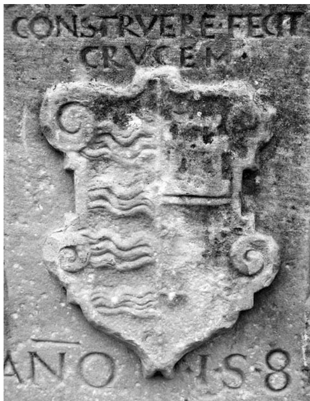
Escut d'un membre de la família Gomar, Bartomeu de Gomar, a la base de la creu de terme de Casrellnou de Seana, 1580.