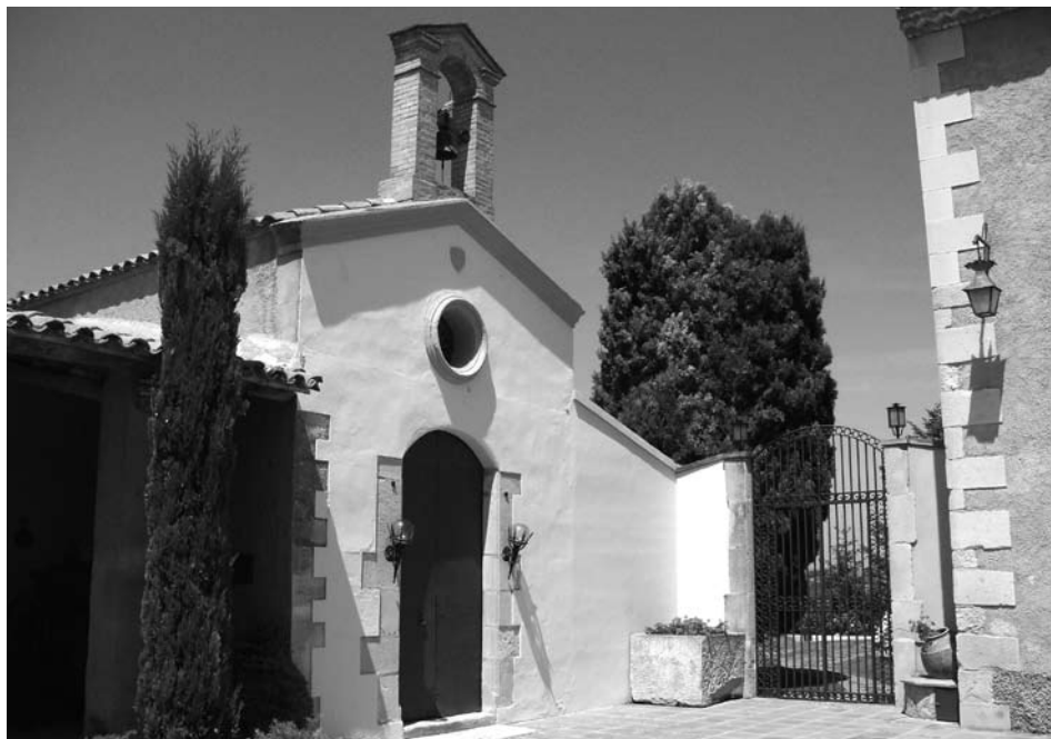
Vista de la façana de la capella de Mare de Déu de la Cabeça a Vila-sana.