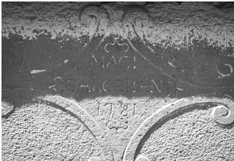
Llinda del portal del pati de "Cal Galceran" on figura el nom de Magí Galceran i la data de 1781, segurament d'algun dels nebots del procurador substituït de Pere Gomar.