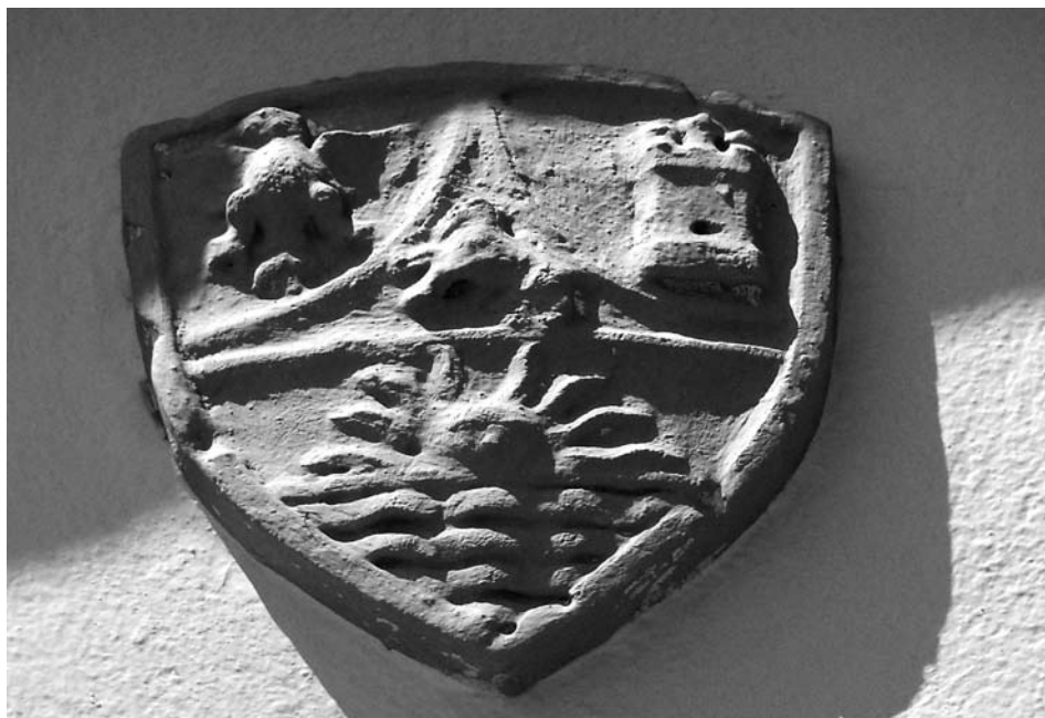
Escut d'armes dels Dalmasses-Gomar a la façana de la capella de Mare de Déu de la Cabeça, que segurament substitueix el que hi havia abans, del duc de Sessa.