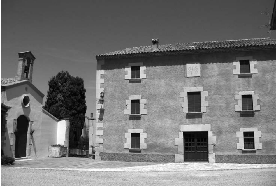
Conjunt format per la capella de la Mare de Déu de la Cabeça i la Casa Vella que havia estat de Pere de Gomar (Vila-sana)