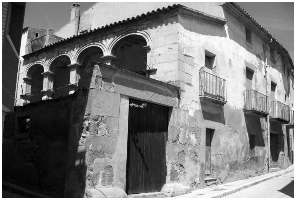
"Cal Galceran", casal senyorial dels Galceran de Linyola, segurament de finals del XVII amb afegits dels segles XVIII i XIX.