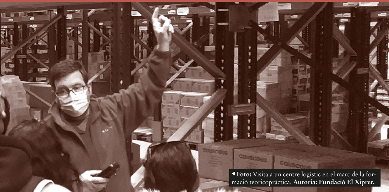
◀ Foto: Visita a un centre logístic en el marc de la formació teòricopràctica.

Així, l'octubre de 2020 iniciaven la primera promoció de la Formació en Inclusió i Prelaboral. Però malgrat la bona predisposició de tots els agents implicats, el projecte va tornar a topar amb el mur administratiu.