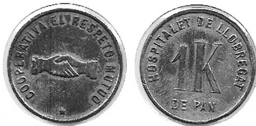
Fotos monedes de la Cooperativa Respeto Mútuo. Data desconeguda.

vançament del pagament que fins i tot eren reciclats anotant a llapis, les copes que cadascú bevia. S'esborrava a final de l'any, un cop traslladats els números al llibre major, per a tornar a començar amb les anotacions a principis de l'any següent. "Uns conceptes ecològics totals", en opinió d'Esteban que reflecteixen l'essència del funcionament.