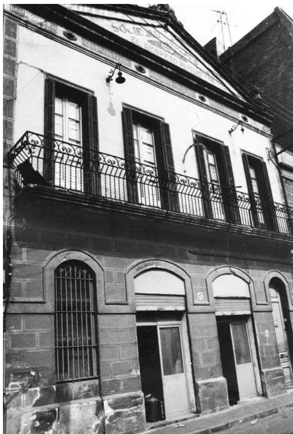
Foto de la seu de la Cooperativa, Carrer Buenos Aires, 27. Data desconeguda.

Entre els estris que expliquen només amb la seva existència com va ser aquest espai, es van trobar també un aparell per a mesurar la graduació del vi, un fet que demostra l'interès per oferir productes de qualitat als seus socis i sòcies. Però, potser l'objecte que millor explica com s'articulava aquesta confraternització són els llibres de copeos trobats. Documents on quedava constància de les consumicions i rondes, que cada soci havia d'abonar i per les quals es rendien comptes a l'intercanvi de la moneda cooperativa.