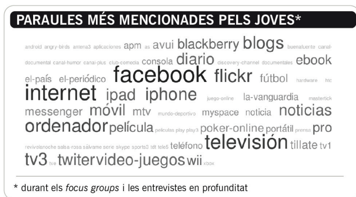
Taula 4. Paraules més mencionades pels joves i per les joves

En tots dos sexes, l'accés a internet és fonamental dins i fora de la feina. Algun entrevistat home va ressaltar que l'ús de l'ordinador i del telèfon mòbil està totalment vinculat a l'accés a