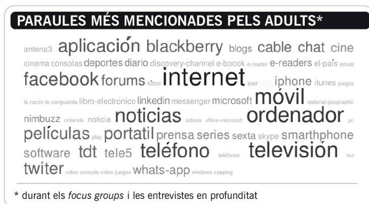
Taula 5. Paraules més mencionades pels adults i per les adultes

Sobre nous mitjans, destaquen l'ús de l'ordinador amb accés a internet i el telèfon mòbil. Del primer, elles usen el servei de veu per IP (Skype), les xarxes socials (Facebook), la missatgeria instantània (Messenger) i jocs online/offline , i ells consulten blocs i fòrums sobre viatges. Tots dos subratllen els perills per als més joves i les possibles estafes per la xarxa.