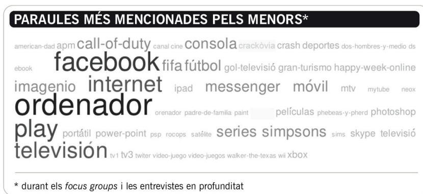
Taula 3. Paraules més mencionades pels nens i per les nenes

Usen les xarxes socials, d'una banda, perquè substitueixen les trucades telefòniques tradicionals: serveixen per quedar amb els amics, per tafanejar en els perfils en línia i per recuperar amistats (elles). I, de l'altra, en destaquen la versatilitat, la possibilitat de planificar esdeveniments, d'estar en contacte amb els amics i de "perdre el temps". Elles perceben que a Facebook hi són tots els seus amics i, per tant, és un lloc en el qual cal ser-hi. També elles fan la distinció de l'ús de la xarxa social LinkedIn amb finalitats professionals i són usuàries del xat i dels missatges instantanis en línia.