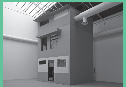
— NAGELHAUS CARUSO ST JOHN ARCHITECTS P.22