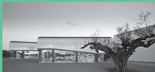
— LOLITA LANGARITA NAVARRO ARQUITECTOS P.18