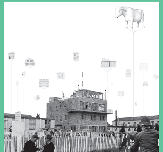
— HEATHROW AIRPORT: WEIGHTLESS PAISAJES EMERGENTES P.10