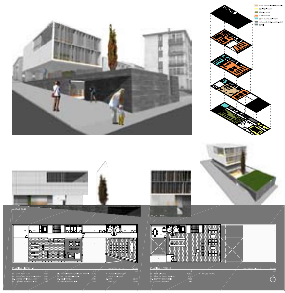
1 Concurs obert per a la Biblioteca Pública d'Hostalric (la Selva) 114 presentats, 3 A1. Guanyadors: Abad, Altabàs, Àlvaro, Raventós Arquitectes SCP.