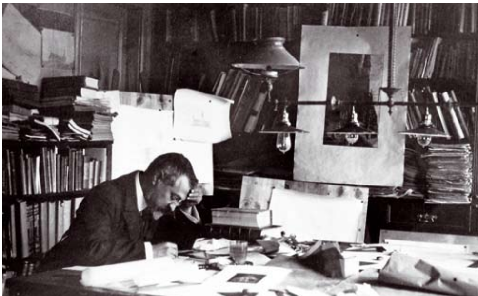
ARXIU HISTÒRIC DEL COAC

fer constar aquí que el Col·legi d'Arquitectes ja havia fet, fa temps, llargues i, en aparença, fructuoses diligències amb els familiars de l'arquitecte per tal de fer-se càrrec d'aquesta valuosa documentació, interrompudes per dos fets luctuosos i imprevistos. A conseqüència d'aquests fets, un familiar sobrevingut precipità la incomprendible venda per separat de l'arxiu i els llibres; el primer, a l'Arxiu Nacional de Catalunya, i els segons a un llibreter antiquari. Quan, en un darrer intent d'evitar la dispersió irreparable de la biblioteca, vàrem arribar a l'establiment, ja se'ns havien avançat la biblioteca del MNAC i les d'alguns departaments de la Generalitat, que havien picotejat sense manies els llibres del seu interès particular, en una mostra més del taifisme actual, derivat de la manca d'una política cultural, una situació que no es produïa, en canvi, a la Mancomunitat de Puig. Afortunadament, en aquesta primera tria, l'arquitectura va ser, en general, deixada de banda i el Col·legi aconseguí adquirir-la en bloc —amb una important despesa econòmica, tot s'ha de dir—, indeixant, a més, la resta de llibres aliens a aquesta matèria que, ara, en aquestes circumstàncies, ja no estàvem disposats a adquirir, però almenys volíem deixar constància de la seva existència, abans de l'escampada final.