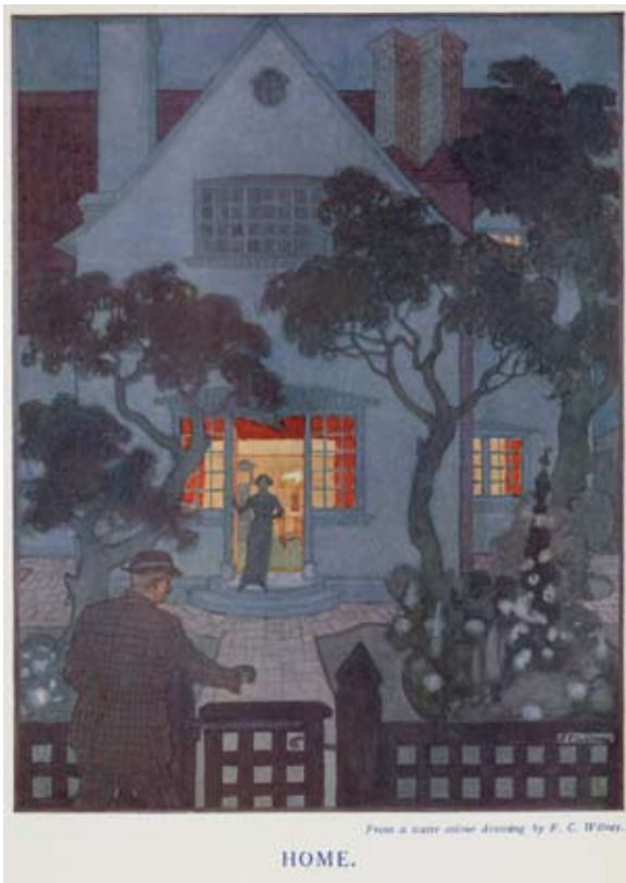
From a water colour drawing by F. C. White.