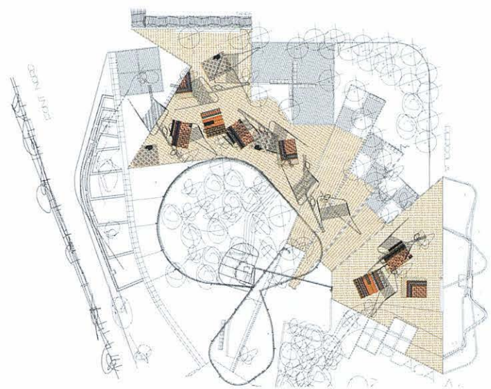
Detall plaça nord - Détail place nord | Escala - Échelle 1:200 | S