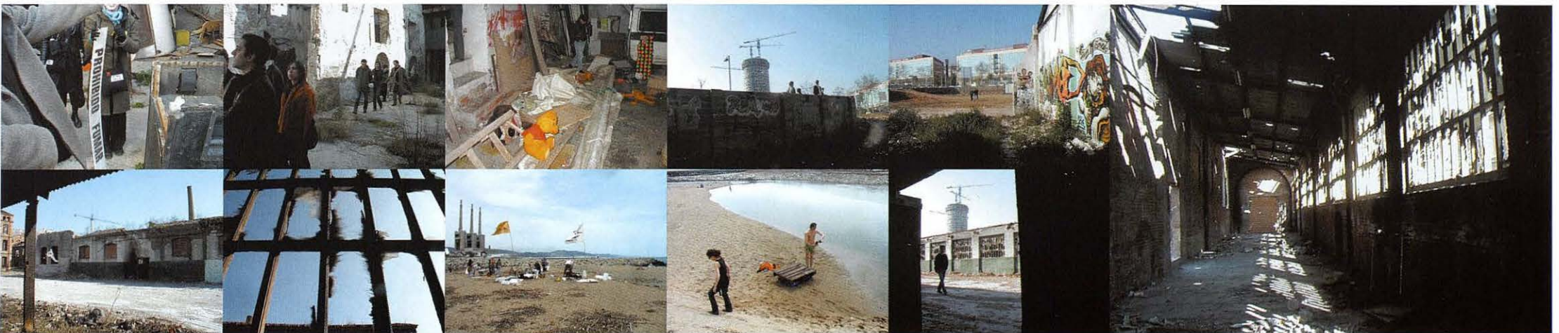
08/02/03_safari industrial_obeliscs i temples de l'antiga civilització industrial · safari industriel_obelisques et temples de l'ancienne civilisation industrielle