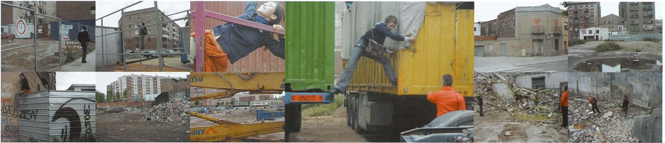
01/05/02_ruta obrera honorifica · route ouvrière honorifique_plaça del treball_carrer del treball_passatge del treball