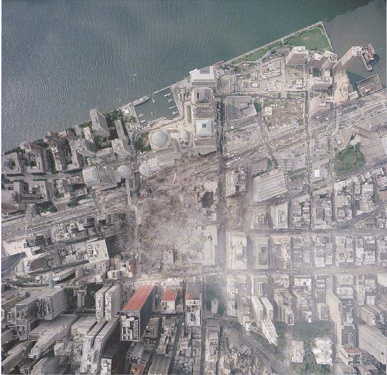
Fotografia satèl·lit - Photographie satellite