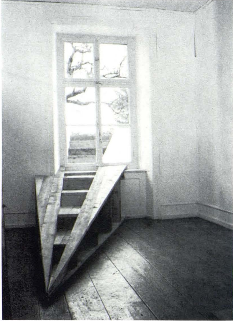
Rampa 2 Vicenzo Baviera