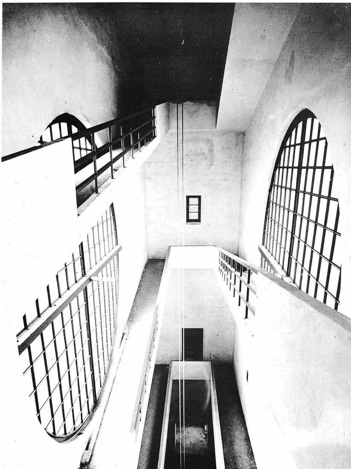
Rampa en la torre de las campanas que pasa por delante del gran reloj.