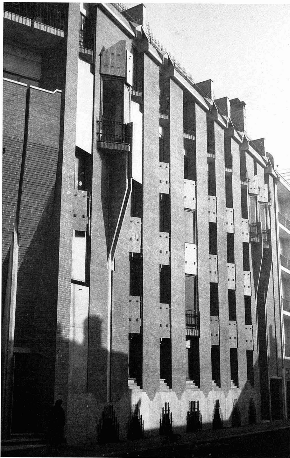
1. Vista de la façana de la «Bottega d'Erasmus».