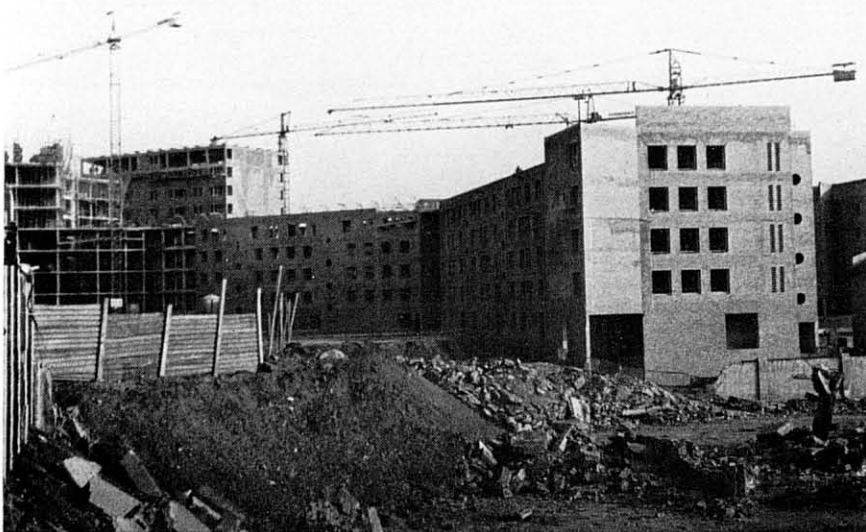
200 vivendes socials als antics terrenys de la RENFE a S. Andreu (centre direccional Maridiana-RENFE). Arquitecte: Ll. Nadal Oller.

Sobre aquest tema, un dels motors del canvi de l'edifici escolar al llarg dels anys, ens trobem amb actituds semblants. Aterreix el Ministeri qual-sevol relació entre la trama urbana i l'edifici escolar; té la idea que els centres escolars han d'ésser uns edifi-