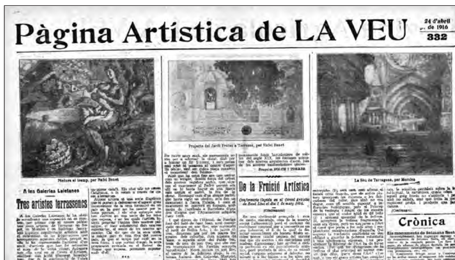
FIGURA 2. «Pàgina Artística de La Veu», núm. 332 (24 abril 1916). «A les Galeries Laietanes». «Tres artistes terrassencs»

uen també les seves últimes obres pictòriques i darrers dibuixos. Ara bé, en aquest singular cas, la mostra exposa, en una sala diferenciada de la galeria, en paral·lel a les pintures i dibuixos, el detall de jardineria del projecte del Jardí Freixa de Terrassa. D'aquest fet se'n fa ressò la «Pàgina Artística de La Veu » (figura 2) i d'altres mitjans que també anuncien la mostra. 17, 18, 19