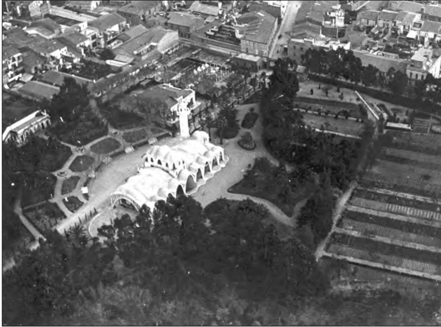
FIGURA 5. Vista aèria del conjunt de la Masia Freixa i part del seu jardí 35

pública, les ciutats jardí, de l'art nacional 34 a l'art dels jardins. No podem obviar cap dels seus nuclis de coneixences, les relacions directes i indirectes en tot l'aspecte programàtic del Noucentisme, la tríada Xènius, Joan Llongueras i Benet, o també la tríada Xènius, Joaquim Folch i Torres i Benet. Ambdós casos, que uneixen el Círcol Artístic de Sant Lluç, l'Escola de Galí i el Gremi d'Artistes de Terrassa, ens donen una idea de la capacitat de desenvolupament de l'encàrrec de disseny de jardí, del qual podem extreure conclusions ara ja més enllà del simple fet anecdòtic inicial. 35