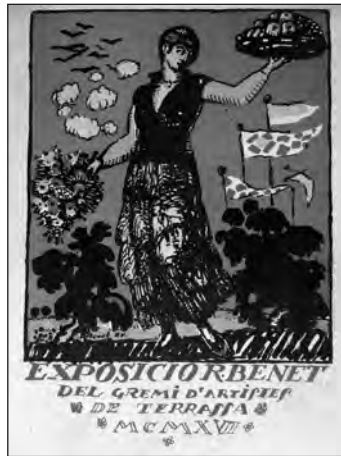
FIGURA 3. Catàleg de l'«Exposició R. Benet del Gremi d'Artistes de Terrassa. MCMXVI» 21