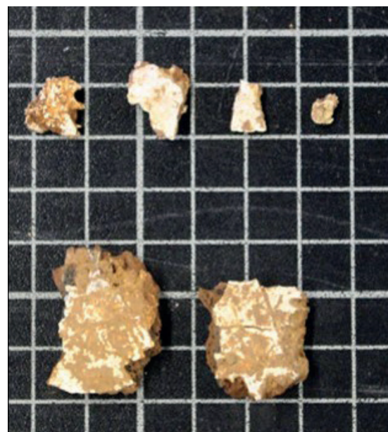
Figura 6. Agulla de bronze recuperada dins de l'urna 3 de Can Bellsolà.