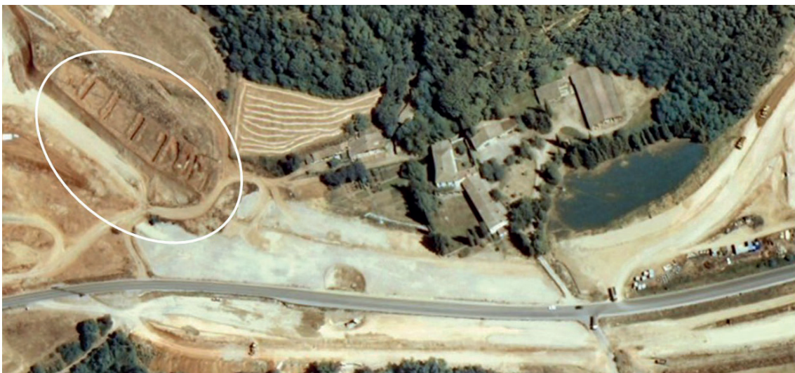
Figura 4. Ortofoto de l'ICC de l'any 2006 del moment on van realitzar les rases al jaciment de Can Bellsolà.

La memòria d'aquesta intervenció finalment mai es dugué a terme. La informació recollida en el treball de camp queda plasmada en un informe preliminar de Font (2006). És en aquest punt o a l'octubre