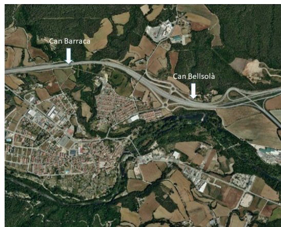
Figura 1. Mapa de situació dels dos jaciments, Can Barraca i Can Bellsolà.

El nom del jaciment té l'origen en la casa a la qual pertanyen els camps on s'ubica, anomenats també com a Camp Gran i està situat molt a prop d'un al-