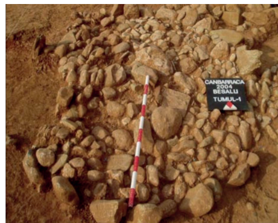
Figura 3. Imatge del túmul 1 (Martín, 2006).