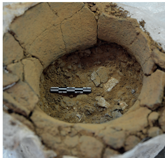
Figura 5. Imatges del procés d'excavació de l'urna 3 de Can Bellsolà (Fotografia MAC).

Un cop retirat aquest paquet de sediment més