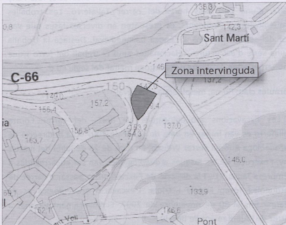
Fig. 1. Situació de la zona excavada.

Centrant-nos ara en la part excavada en 2007, primerament farem