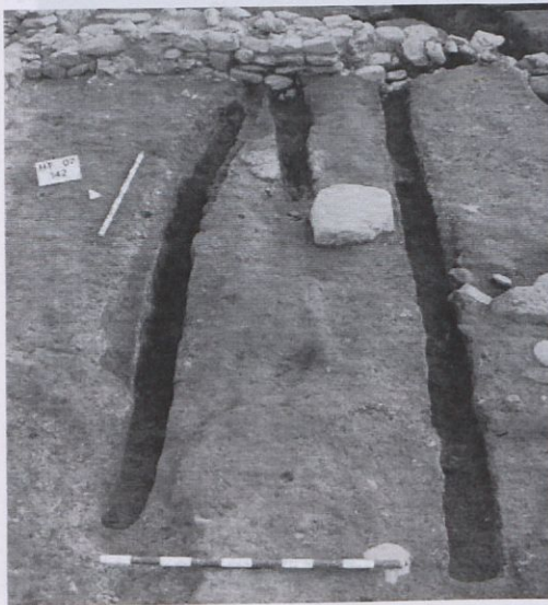
Fig. 5. Rases pertanyents al taller metal·lúrgic (segona meitat del segle I d.C.) dins el sector C. Autor: Josep Frigola.

Lattes (Herault, França). En aquest jaciment es va poder excavar, a principis dels 90, el que va ser interpretat com un taller metal·lúrgic 2 . Algunes de les estructures que es trobaven dins aquest taller eren molt similars a la fossa 4207 excavada durant la nostra intervenció.