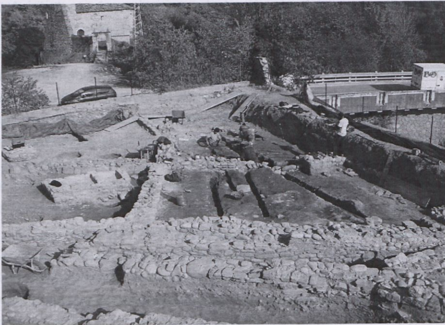
Fig. 7. Vista general del jaciment durant el procés d'excavació. Autor: Josep Frigola.

Les estructures que podem adscriure l'època medieval són els murs 4052, 4004, 4071, 4002, 4024 i 4038; els paviments 4005 i 4071 i les sitges 4133, 4192, 4125, a més del dipòsit 4011 i els basaments de pilar 4049 i 4112. Algunes d'aquestes estructures (4005, 4071, 4011, 4049 i 4112) van ser excavades per l'equip dirigit per Andrea Ferrer abans de la nostra intervenció, però incloem aquí part dels resultats obtinguts per tal de fer més entenedor el conjunt del jaciment.