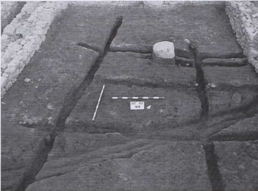
Fig. 4. Rases pertanyents a diverses fases sobreposades del taller metal·lúrgic (segona meitat del segle I d.C.) dins el sector B. Autor: Josep Frigola.

-La cronologia de totes elles és molt similar i se situa a mitjans i segona meitat del segle I d.C.