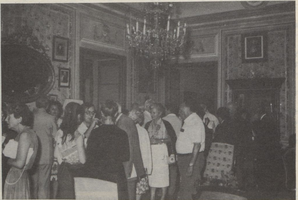
Recepció oferta a tots els assembleistes a la senyorial casa Pozo-Ferrer.