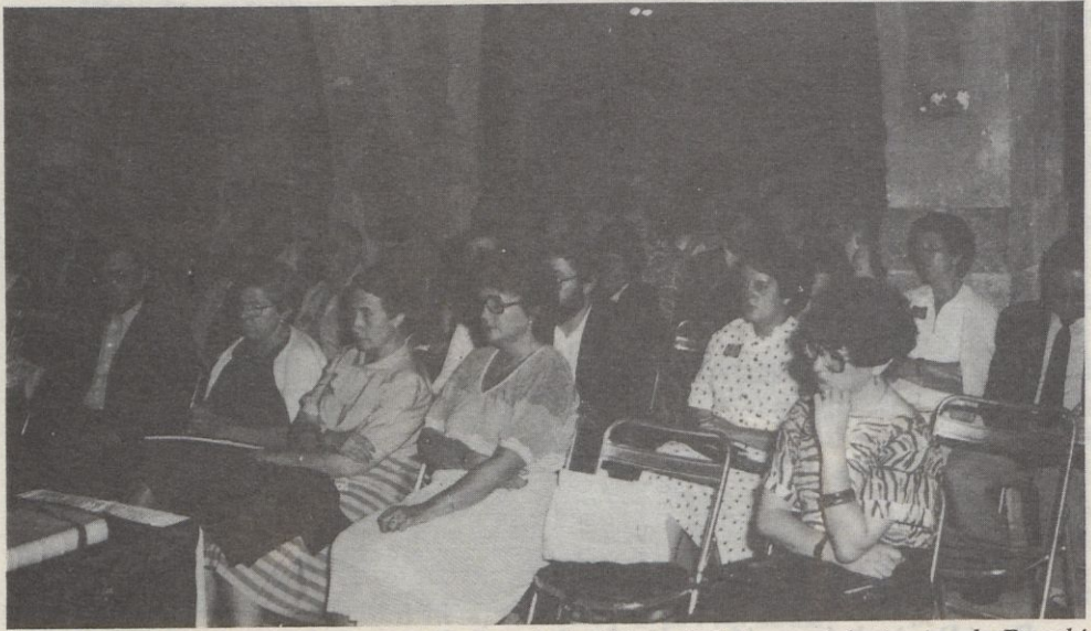
Aspecte de la sala gòtica del Palau de la Cúria Reial, seu dels Amics de Besalú, durant la sessió acadèmica.