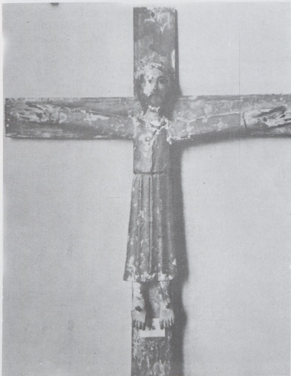
Majestat d'Aranyonet. Segle XIVè. M.E.V.