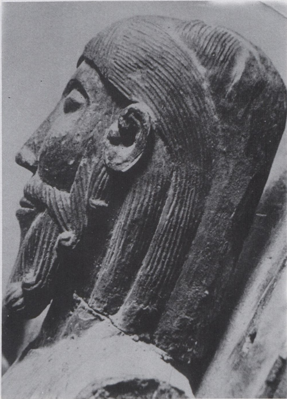
Majestat de Sant Joan les Fonts. Segle XIIè. M.D.G.