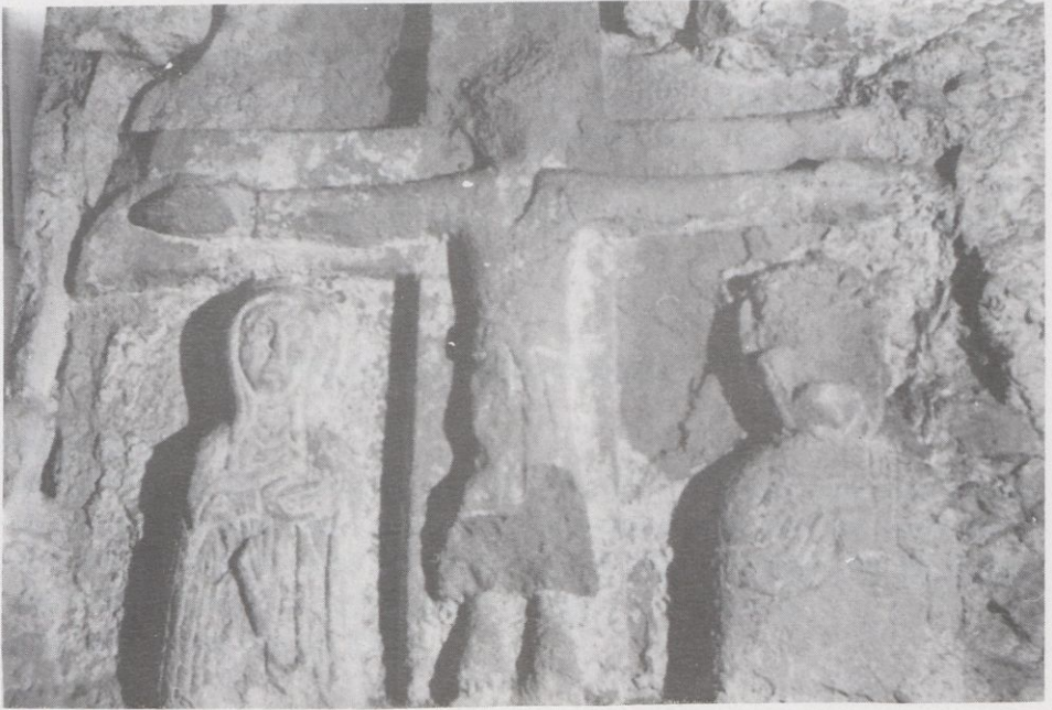
Majestat de Sant Esteve d'En Bas, segle XIè.