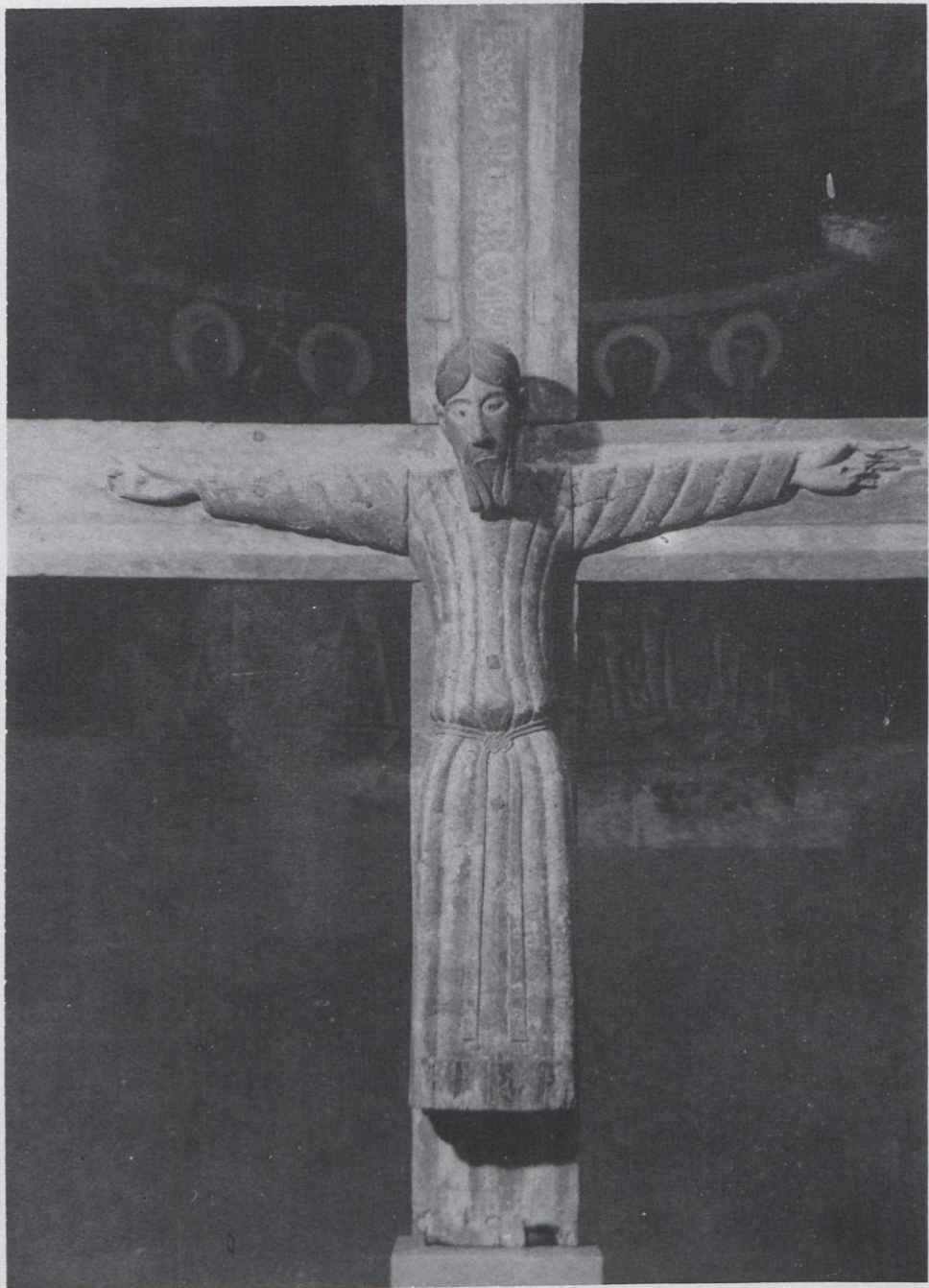
Majestat Batlló. Segle XIè. M.A.C..