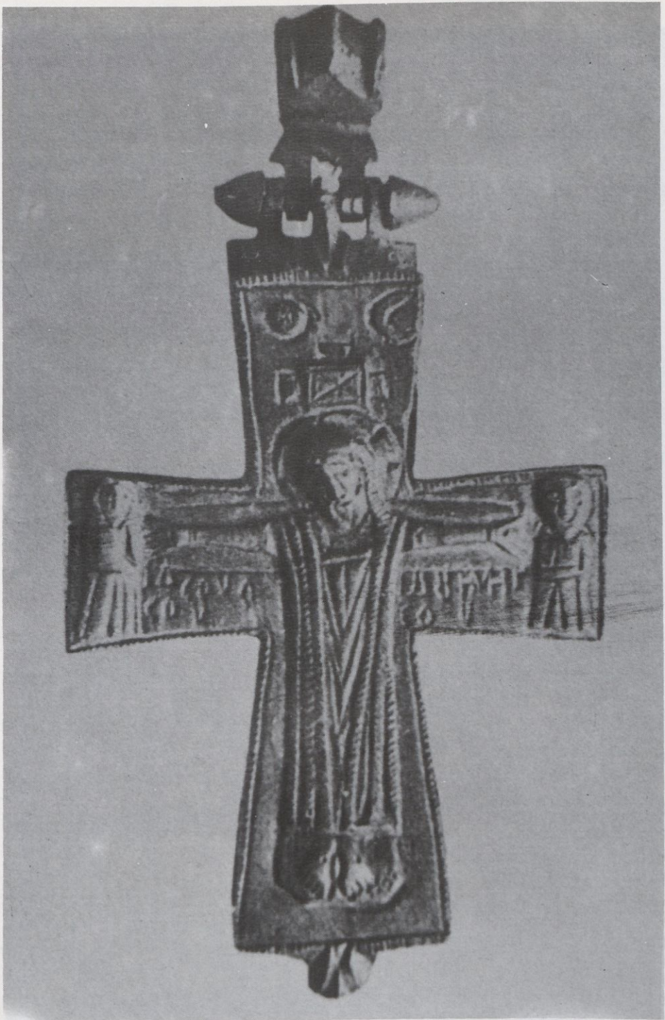
Encolpia de Sant Pere de Roda. Segle XIè. M.D.G.