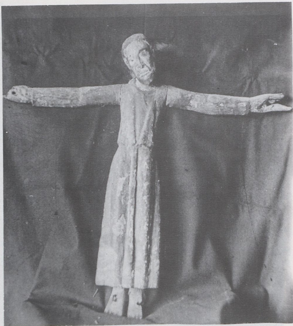
Majestat d'All. Segle XIVè. M.A.C.