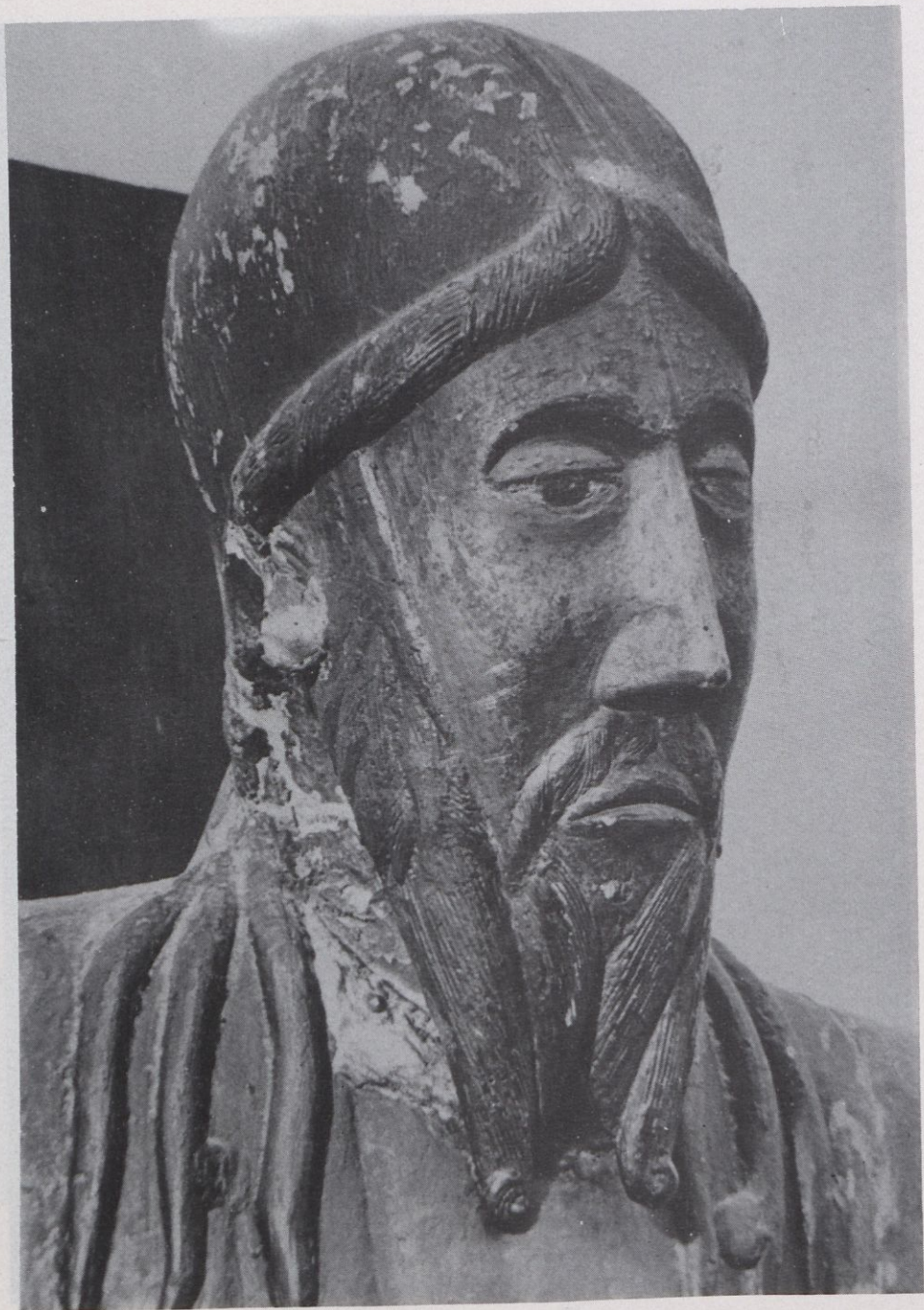
Majestat de Beget. Segle XIIè.