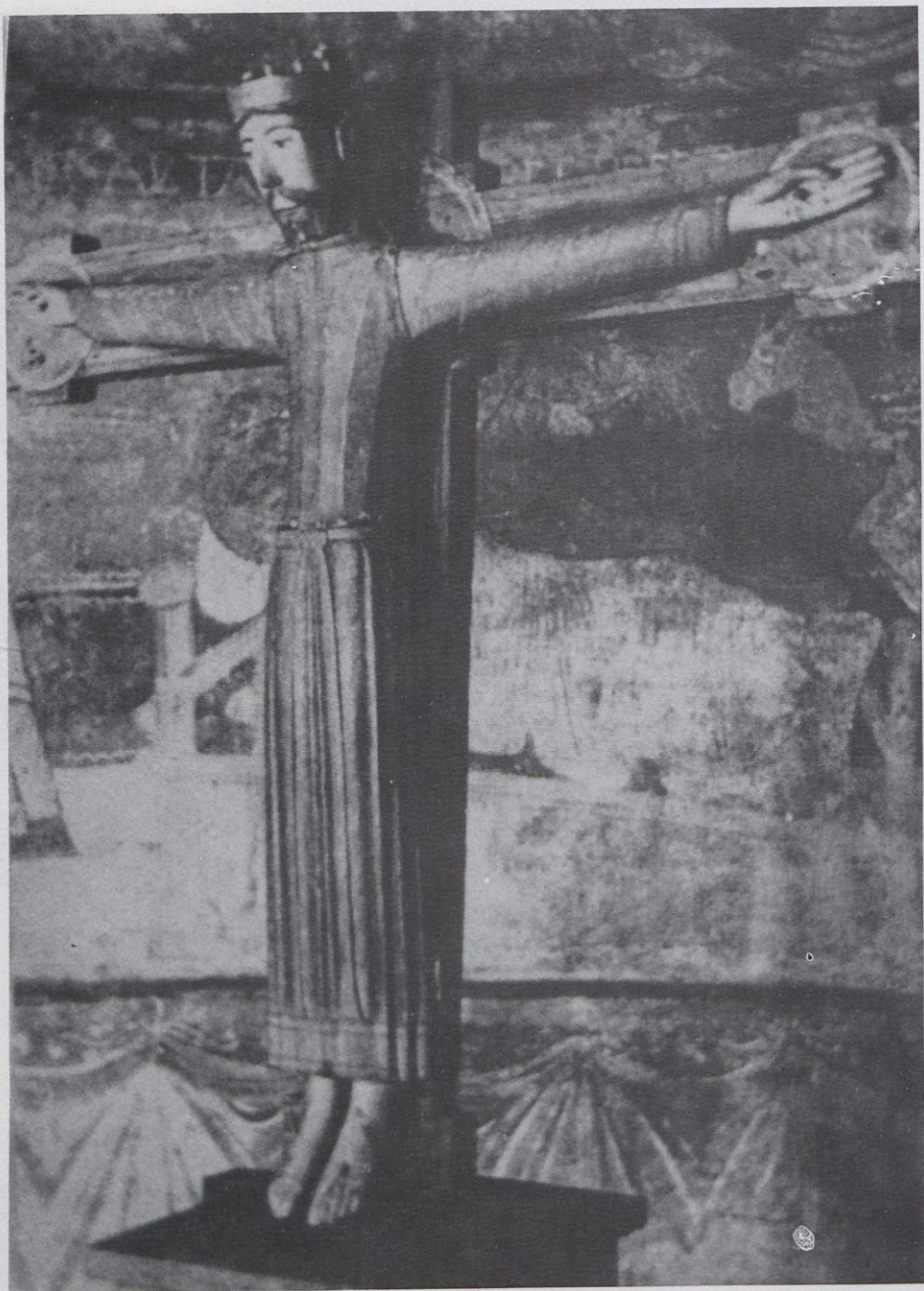
Majestat de Cruïlles. Segles XII-XIII M.D.G.