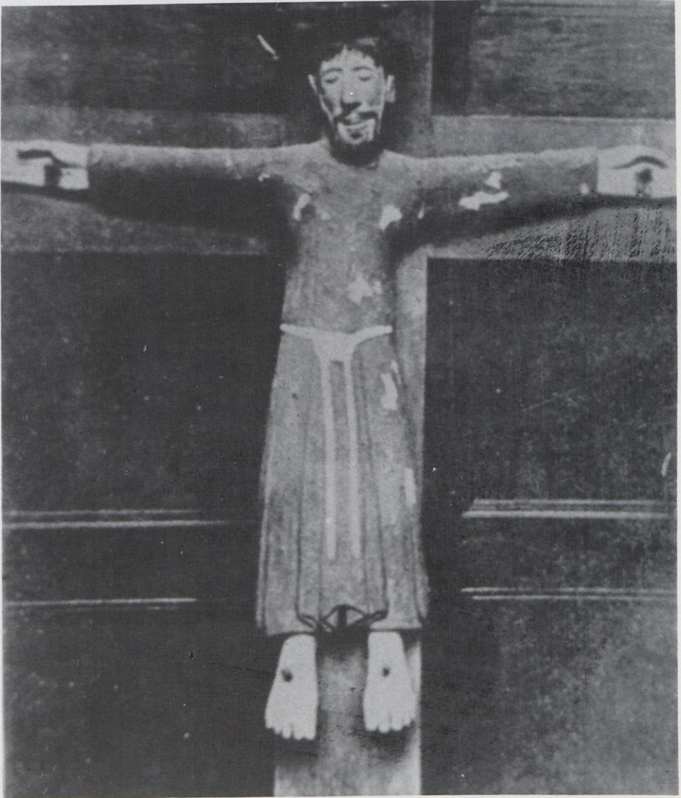
Majestat dels Arcs. Segle XIVè. Destruïda.