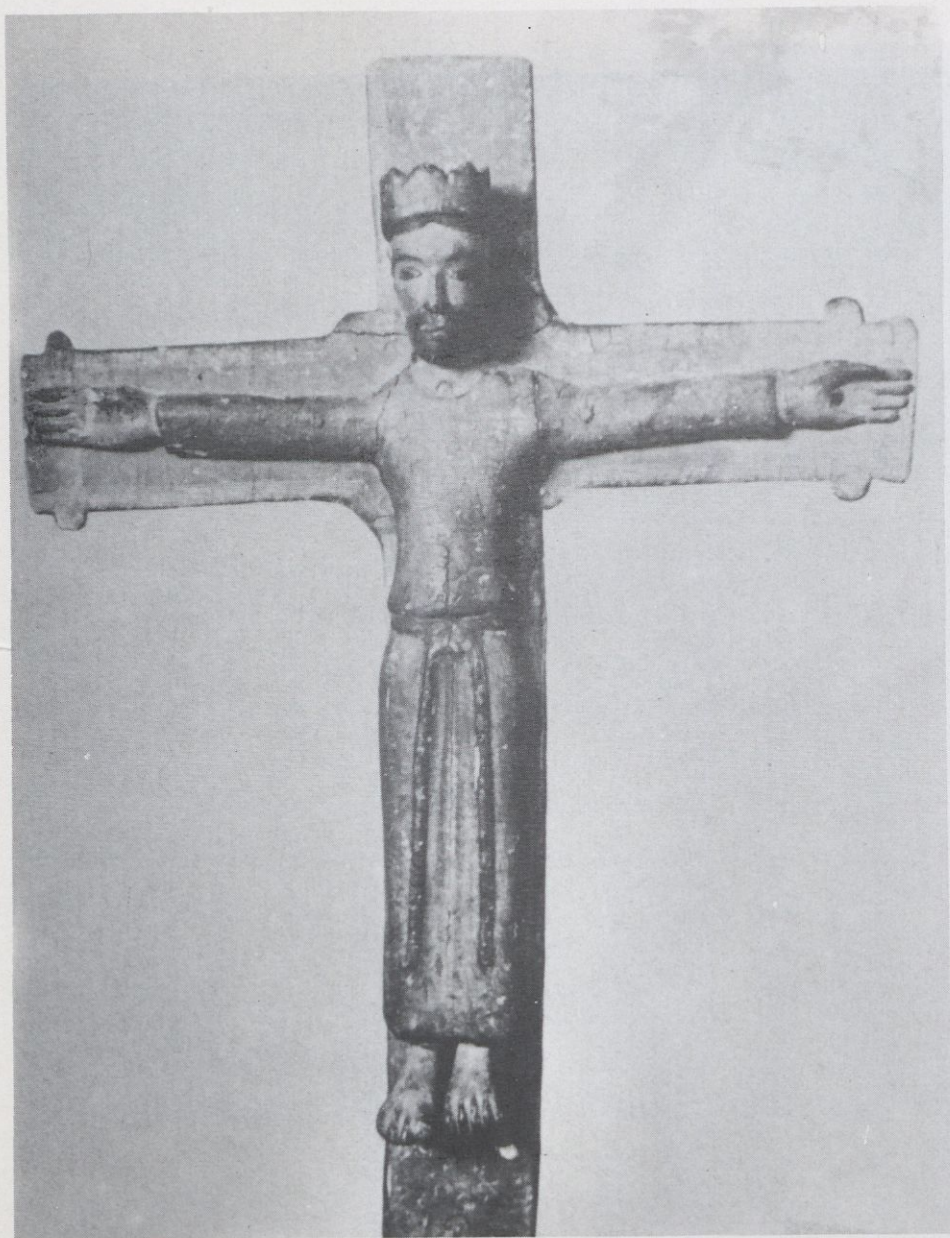
Majestat Espona XIIIè. M.A.C.