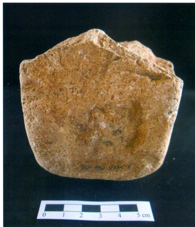
Figura 5. Chopper de pòfir (BN1GC). Pla d'en Serra 6.