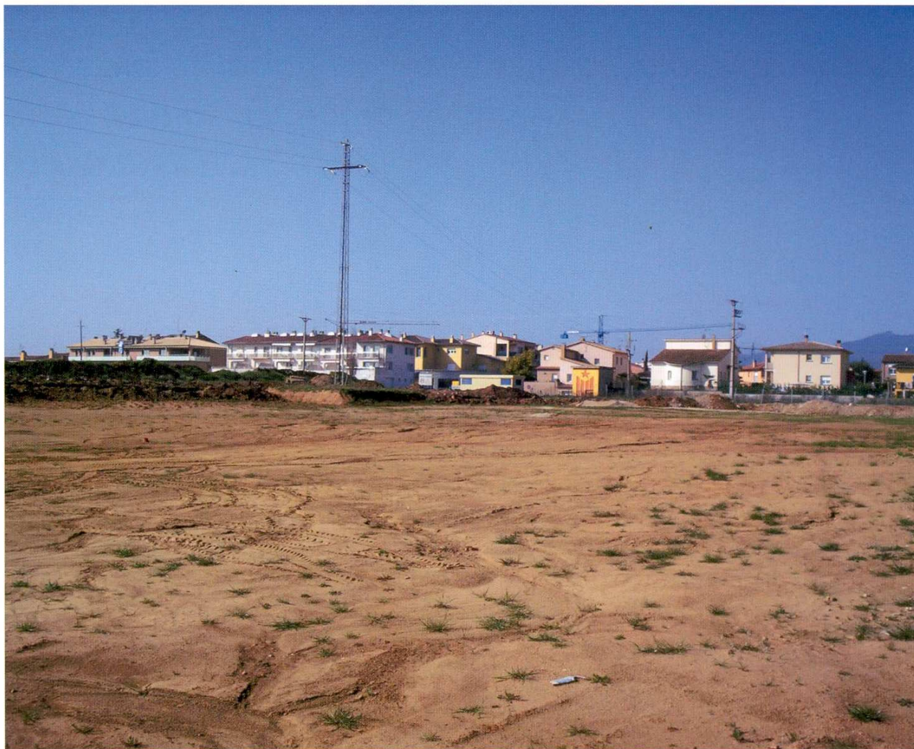
Figura 1. El Pla d'en Serra és el topònim de l'àrea de terreny situada a l'est del poble de Sant Gregori.

És en aquest context que cal situar la localització, aquest 2008, del nou jaciment que presentem en aquest article i que hem batejat amb el seu topònim original: El Pla d'en Serra (Sant Gregori). En conjunt, es tracta de 22 instruments lítics, els atribuïts tècnics del qual són idèntics als de Domeny i del Pla de la Jueria, la qual cosa constata que a finals del paleolític inferior el Pla de Sant Gregori va estar ocupat intensament pels homínids d'aleshores, els Homo Heidelbergensis .