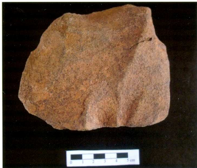
Figura 11. Nucli bifacial centrípet de quarsita (BN1GE). Pla d'en Serra 5

de les administracions públiques. Però és a mesura que anaven avançant les obres de construcció quan apareixen les eines de pedra, sense, però, l'autorització de cap seguiment o control arqueològic previ per part de les administracions competents en la matèria del patrimoni arqueològic. Llavors, de cop i volta, apareixia un problema imprevist, tant pels constructors com per l'administració, i, a corre-cuitat, s'havia de solucionar: obres parades i excavació d'urgència. Perjudicats immediats: l'empresa constructora no pot continuar treballant i els arqueòlegs queden identificats com un estorb i de seguida adquireixen mala premsa. En canvi, sorprenentment, l'administració, que no ha estat capaç de prevenir-ho quan tenia els mitjans legals per intervenir-hi amb antelació i de forma conciliadora, ni s'immuta, com si li fos quelcom aliè.