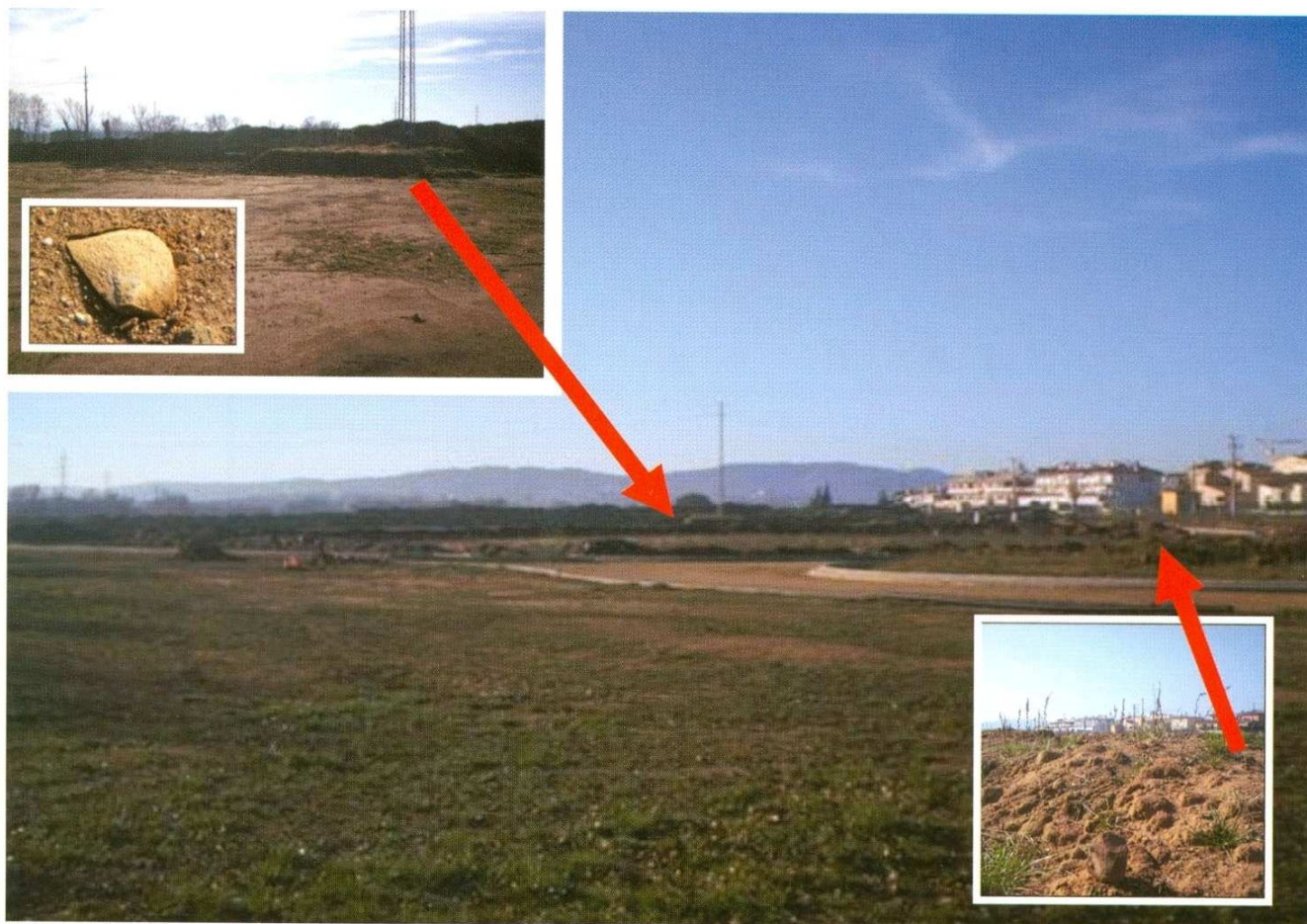
Figura 3. Àrees de concentració dels materials lítics localitzats l'any 2008 al Pla d'en Serra

Àrea 1: Indústria lítica, objectes números Pla d'en Serra 1 - Pla d'en Serra 4. Coordenades són: 41° 59. 461' i E002° 45. 899'.