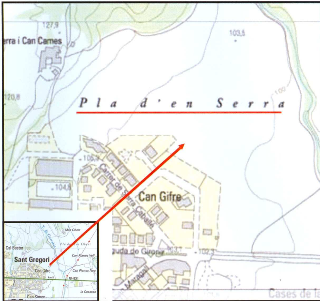
Figura 2. Situació geogràfica del Pla d'en Serra: a la part oriental del poble de Sant Gregori, just a l'entrada de la carretera que porta fins a la ciutat de Girona.