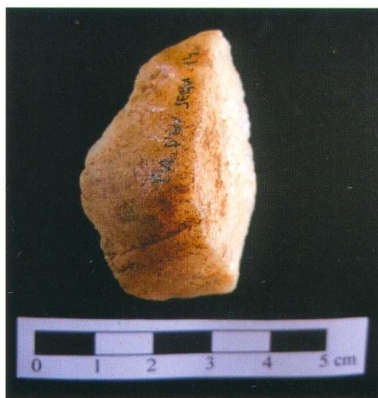
Figura 8. Ascle de quarz (BPE). Pla d'en Serra 14.