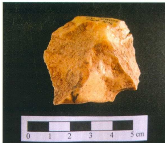
Figura 6. Ascle de quarz (BPE). Pla d'en Serra 19.