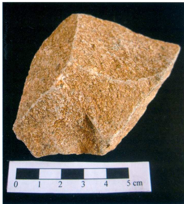
Figura 4. Ascle de pòfir (BPE). Pla d'en Serra 1. La cara dorsal és completament no cortical i presenta tres extraccions netes que indiquen un sistema de talla de preparació del nucli abans d'extreure'n definitivament les ascles.

Pla d'en Serra 22: És una resta de talla de quars (BPE). Mesures: 26x17x10 cm. Totalment no cortical. (figura 9)