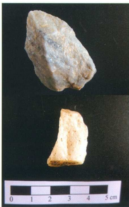
Figura 9. Punta de quarz (BPC) (Pla d'en Serra 4) i resta de talla de quarz (BPE) (Pla d'en Serra 22).