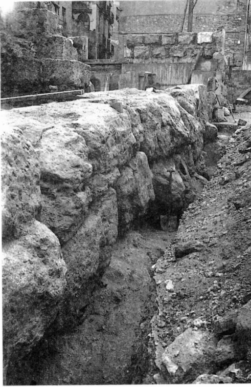
Placa de vidre núm. 1135 (MNAT).