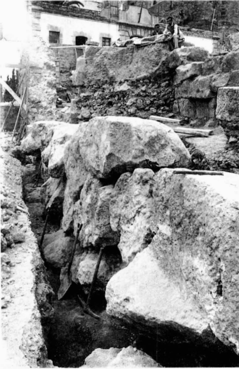
Placa de vidre núm. 1139 (MNAT).