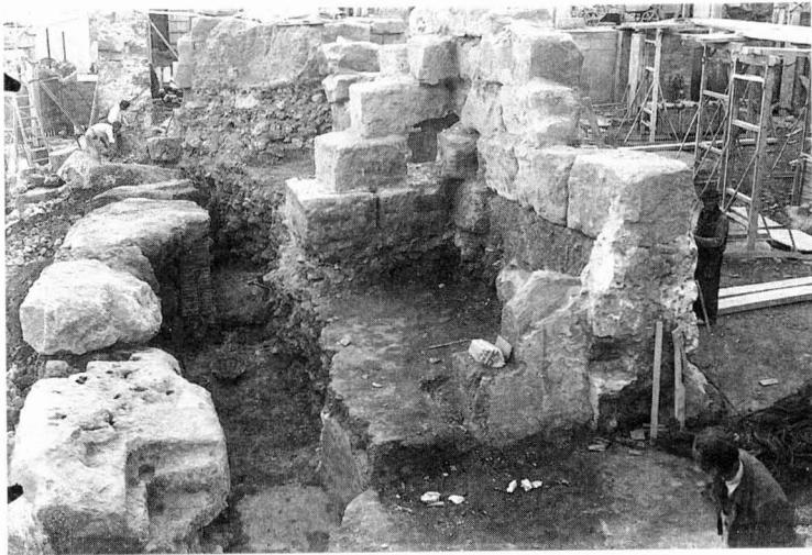
Placa de vidre núm. 1136 (MNAT).