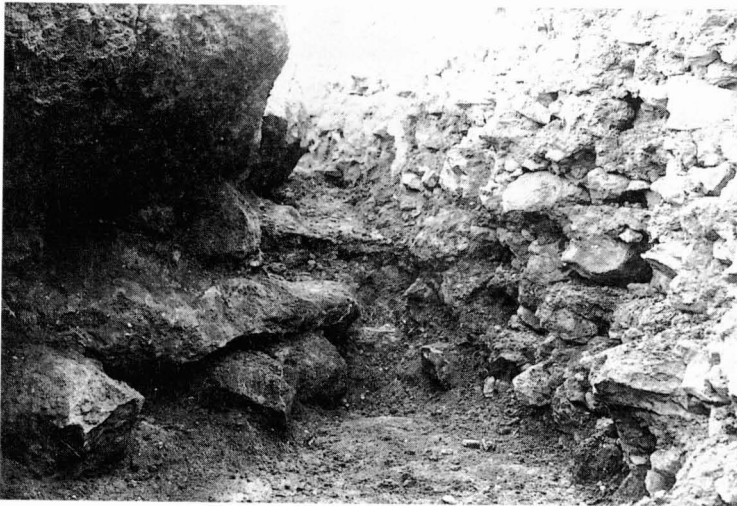
Placa de vidre núm. 1138 (MNAT).