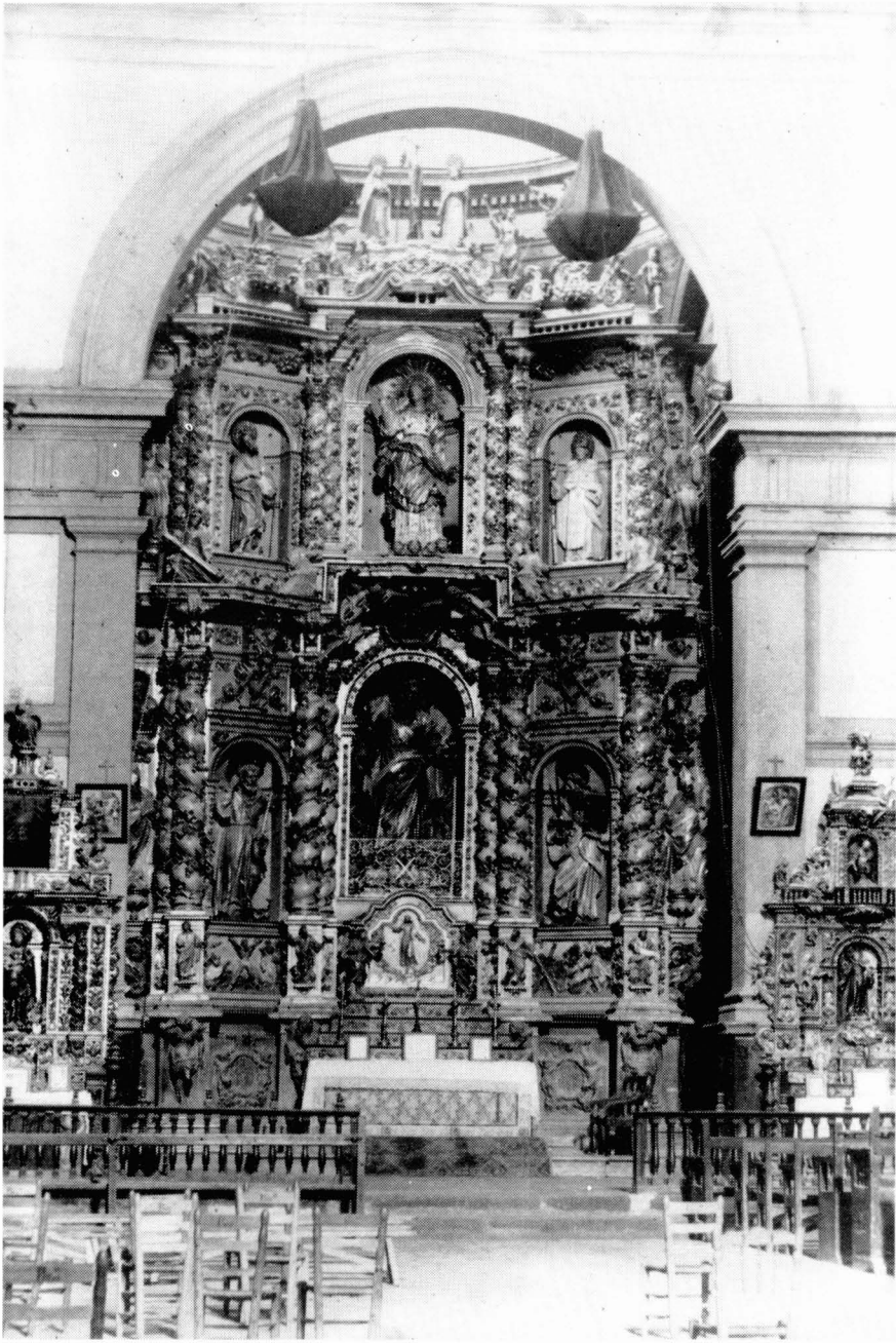
Aspecte que oferia el retaule major de la Parròquia de Sant Andreu abans de la seva destrucció el 1936. Al costat veiem els retaules de Sant Josep (esquerra) i de Sant Antoni de Pàdua (dreta), també destruïts.