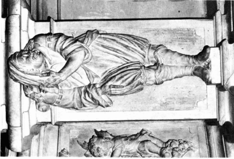
Figures 1 i 2: Atlants (esquerra) del peu de pedra del retaule de Sant Andreu, coneguts popularment com bastaixos.